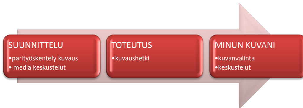
KUVIO 1. Kolmivaiheinen kehittämispöessi

Toimintatutkimuksellisen kehittämispöessin tavoitteena oli löytää uusi työskentelyn toimintamalli Helsingin Diakonissalaitoksen Lastenkaareen. Kehittämispöessi oli kolmivaiheinen. Valokuvausprojektissa toteutuksen keskeisimmät käsitteet olivat suunnittelu, toteutus ja kuvan valintaan liittyvä pöessi.