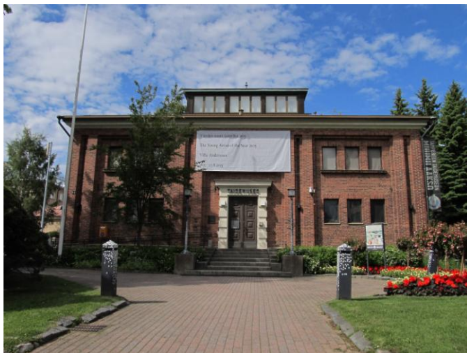
KUVA 2. Tampereen Taidemuseo