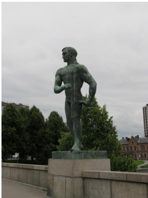
KUVA 5. Veronkantaja, yksi Hämeensillan Pirkkalaisveistoksista