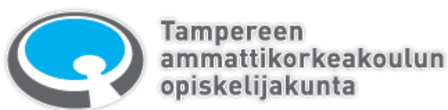
KUVA 1. Tamkon logo (Tamko 2015)

Suomen opiskelijakuntien liitto ry (SAMOK) on ammattikorkeakoulu-opiskelijoiden edunvalvonta- ja palvelujärjestö, johon myös Tamko kuuluu. SAMOKin ansiosta Tamkon jäsenet saavat käyttöönsä myös valtakunnallisia alennuksia paikallisten etujen lisäksi.