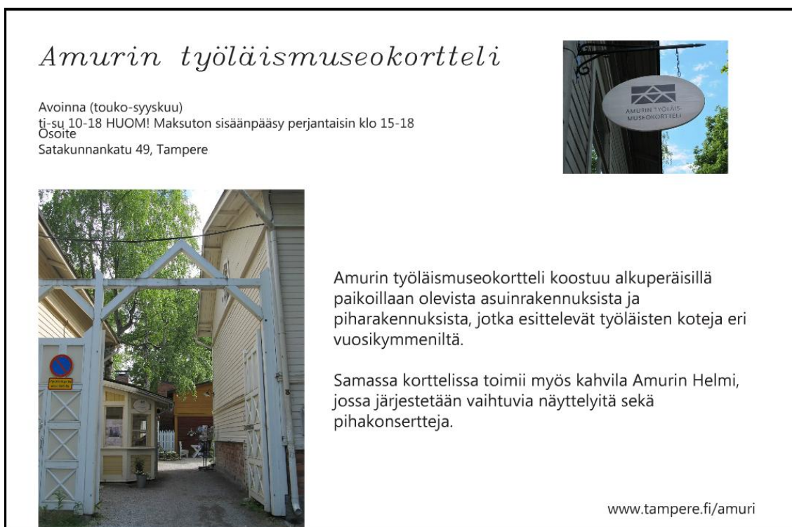
KUVA 6. Sivun valmiista esitteestä

tarpeisiin. (Puustinen & Rouhiainen 2007, 225.) Kerroimme kohteista tärkeimmät tiedot; aukioloajat, osoitteen sekä linkin kotisivuille havainnollistavan kuvan kanssa. Lähes kaikista kohteista on esitteessä ulkokuva, joka osaltaan helpottaa kohteen löytämistä. Lukija saattaa myös huomata esitteessä tutun näköisiä rakennuksia, joista hänellä ei ole ollut tarkempaa tietoa eikä sen vuoksi ole tullut vierailleeksi kohteessa.