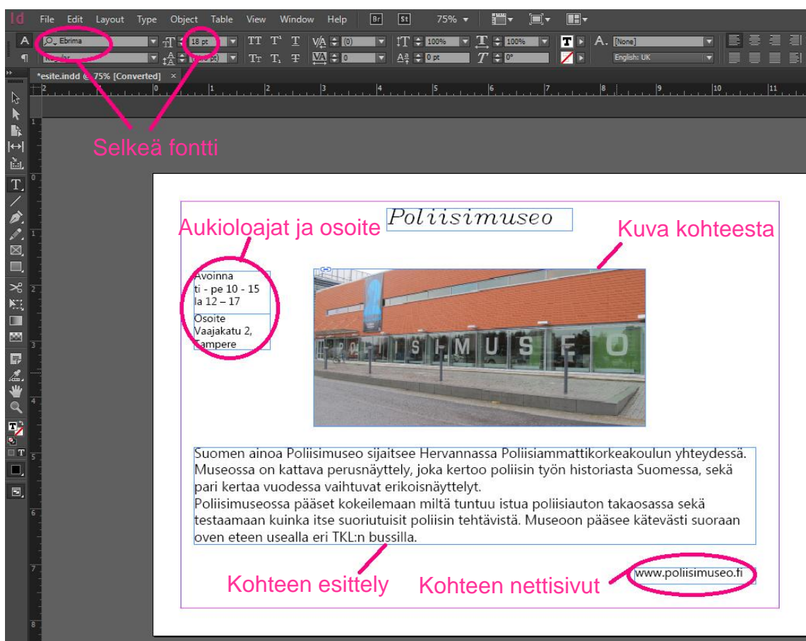
KUVA 7. Esitteen suunnittelua

Esitteen teossa käytimme Adobe InDesign CS6 -julkaisuohjelmaa. Esitteessämme käytimme runsaasti värillisiä kuvia ja pyrimme pitämään sivut yksinkertaisen selkeinä. Sivujen pohjaväri on valkoinen, josta sekä teksti että kuvat erottuvat hyvin. Päädyimme käyttämään itse ottamiamme kuvia, jotta saamme juuri sellaiset kuvat kuin haluamme. Näin välttyimme myös tekijänoikeuksien selvittämiseltä. Fontiksi valitsimme Ebriman ja käytimme fonttikokoa 18pt. Fonttiasetuksilla halusimme taata hyvän käytettävyyden useimmilla laitteilla, koska pienempi fonttikoko ei välttämättä näkyisi kunnolla esimerkiksi mobiililaitteilla.