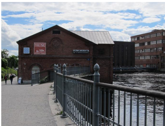
KUVA 4. Käsi- ja taideteollisuuskeskus Verkaranta

Erilaisia taidenäyttelyitä pääsee katselemaan maksutta monissa gallerioissa, joista kokosimme kulttuurioppaaseemme listan. Maksuttomia näyttelyitä järjestetään myös käsi- ja taideteollisuuskeskus Verkarannassa ja Taidekeskus Mäntinrannassa. Lisäksi Tampereen kirjastoissa järjestetään pääsymaksuttomia taidenäyttelyitä ja muita kulttuuritapahtumia. Kulttuurioppaaseemme valitsimme pääkirjasto Metson, koska siellä tapahtumia on eniten ja kirjasto on jo itsessään arkkitehtuurinen nähtävyys erikoisen ulkomuotonsa vuoksi.