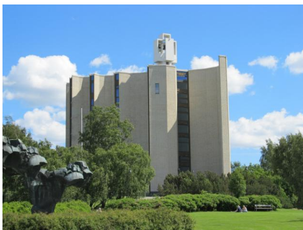
KUVA 3. Kalevan kirkko

Mielenkiintoinen kohde, jota monikaan ei yleensä tule ajatelleeksi kulttuurikohteena, on kirkot. Niitä Tampereelta löytyy useita ja ainakaan tällä hetkellä ei yhteenkään Tampereen kirkoista ole mitään sisäänpääsymaksua. Valitsimme kulttuurioppaaseemme vain muutaman kirkon, joissa meidän mielestämme on eniten nähtävää arkkitehtuurisesti tai sisustuksen vuoksi. Varmasti yksi kiinnostavimman näköisistä kirkoista on Kalevan kirkko, jonka upeuden ymmärtää kunnolla vasta sisään astuessaan. Kulttuurioppaaseemme pääsivät myös uusgotiikkaa edustava Aleksanterin kirkko sekä Tuomiokirkko, joka arkkitehtuuriltaan edustaa kansallisromanttista tyyliä ja josta löytyy hyvin tunnettuja taideteoksia Hugo Simbergiltä ja Magnus Enckelliltä (Tampereen seurakunnat 2015)