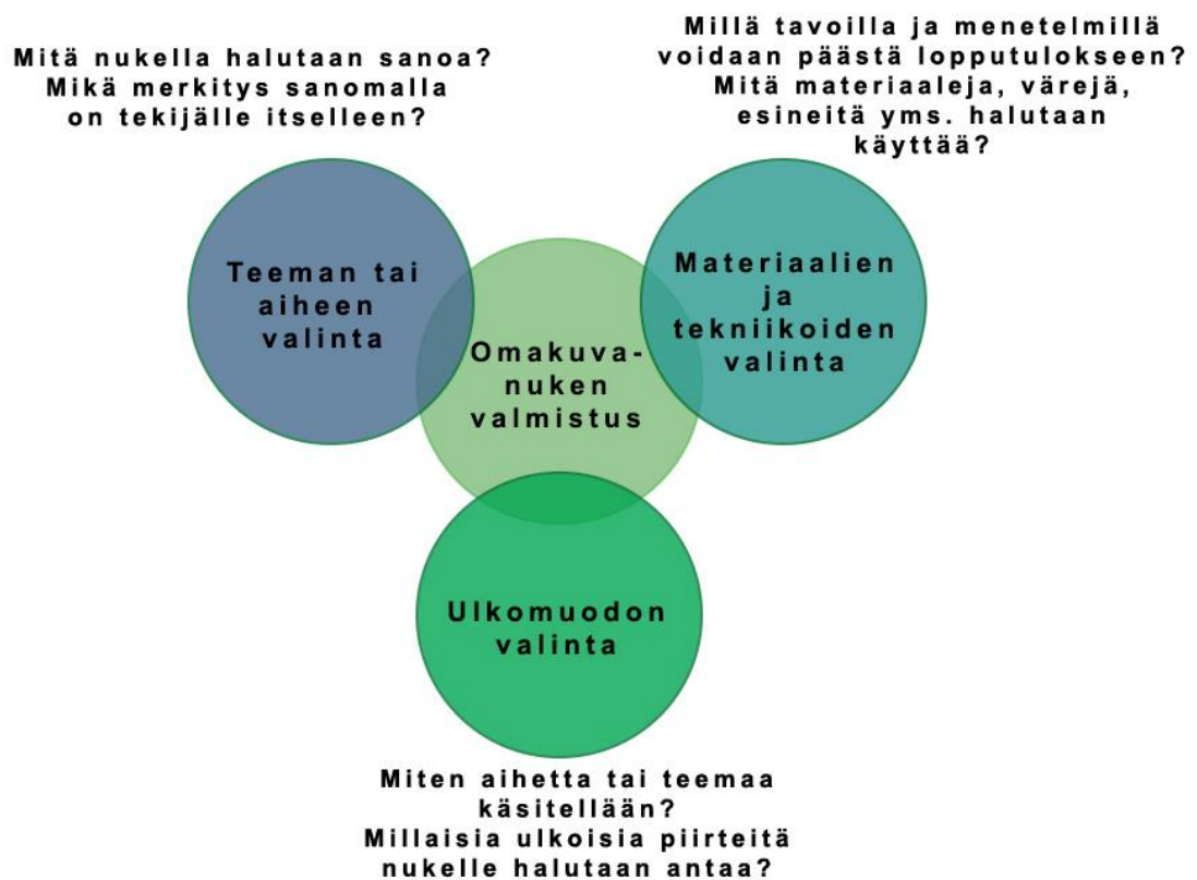
Kuvio 2. Teema, muoto ja materiaalit sekä tekniikat nukan valmistuksessa.

Nukan ulkomuoto puolestaan muovaantuu niiden elementtien mukaan, joiden avulla aihetta tai teemaa halutaan tuoda näkyvään muotoon. Näin voidaan vastata kysymykseen ”Miten valittua aihetta käsitellään?” ja ”Millaisia ulkoisia piirteitä nukelle annetaan?” Kysymykseen ”Millä välineillä ja materiaaleilla voidaan päästä lopputulokseen?” vastataan tekemällä materiaaleihin ja teknisiin seikkoihin liittyviä ratkaisuja. Käytettävät materiaalit ja tekniikat voidaan osaksi päättää ennen työskentelyä tai nukan valmistuksen aikana.