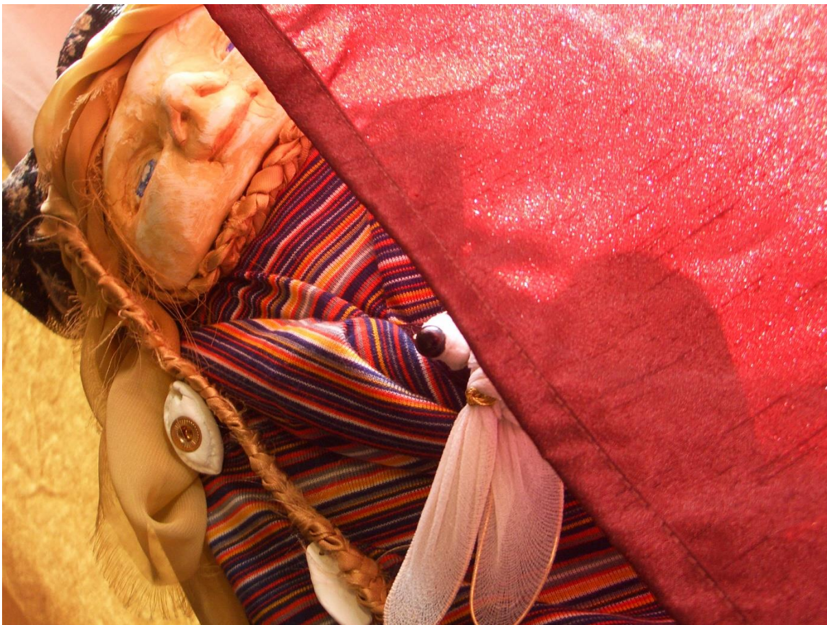
Kuva 4. Sudenkorenon pelastaja