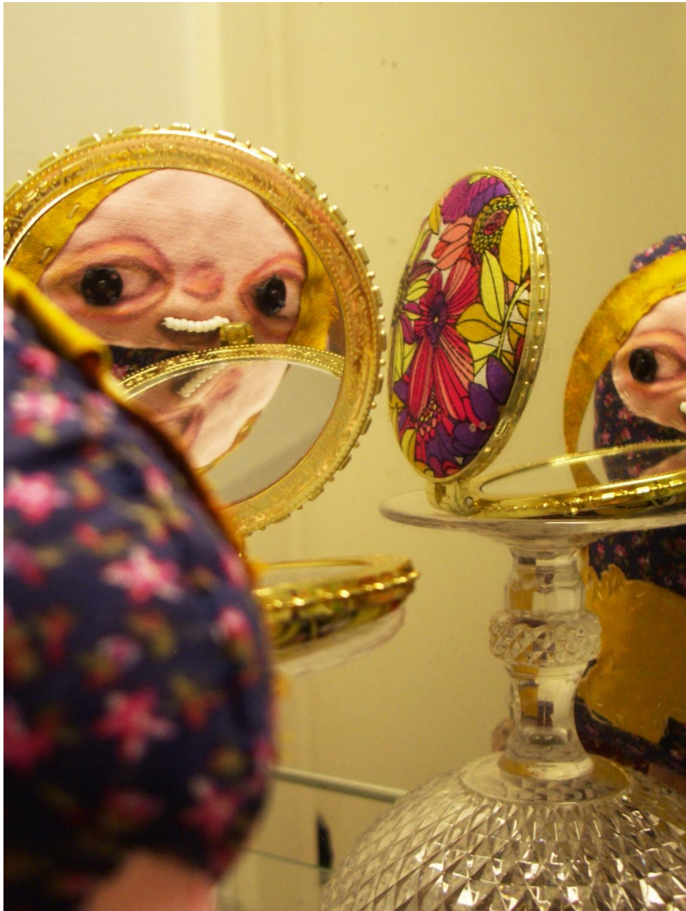
Kuva 6. Mutanttilapsi/Sulotar.