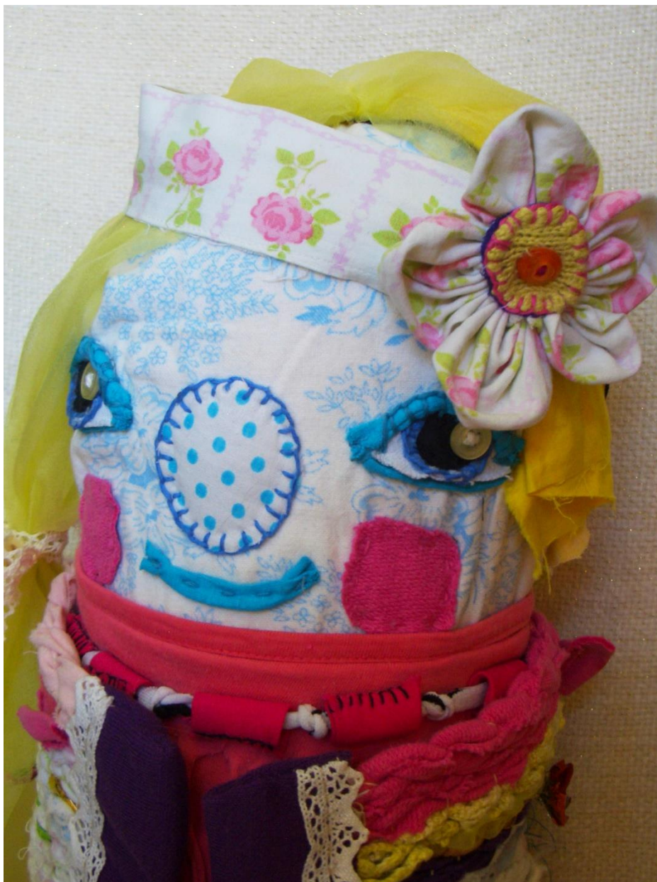
Kuva 3. Puen kesän ylleni.