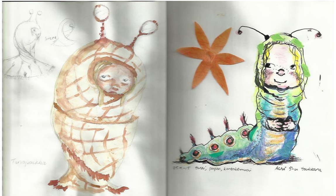
Kuva 1. Minä toukan hahmossa.

minulle merkitsee tässä tapauksessa olla toukka. Aiheen sanallistaminen toi lisää merkityksiä työskentelylle ja omat käsitykseni ja mielikuvani aiheeseen liittyen laajenivat. Olin myös aiemmin hahmotellut kaksi luonnosta itsestäni toukkana (Kuva 1. Minä toukan hahmossa). Kuvien avulla olin lähestynyt aihetta värien, muotojen, piirteiden, asennon, ilmeen jne. kautta, joita hyödynsin myös nukan valmistuksessa.