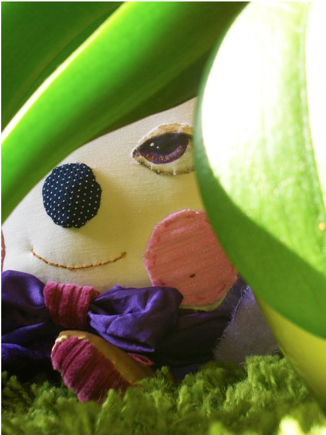
Kuva 10. Minun muusani.