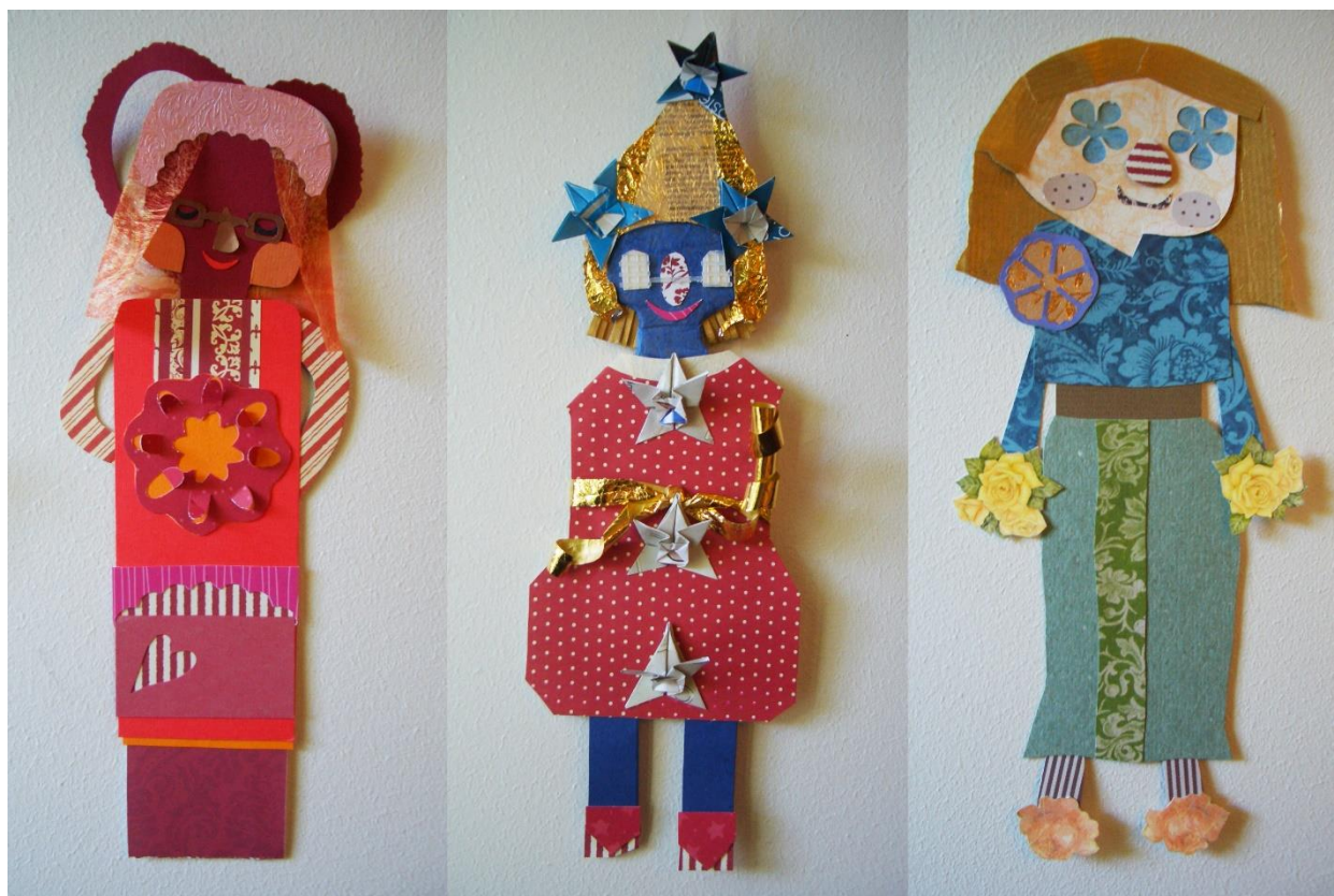
Kuva 13. Hölmö rakkaus, Tähtipaimen ja Keto-orvokki.