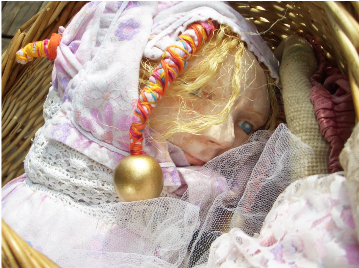
Kuva 2. Toukan uni.