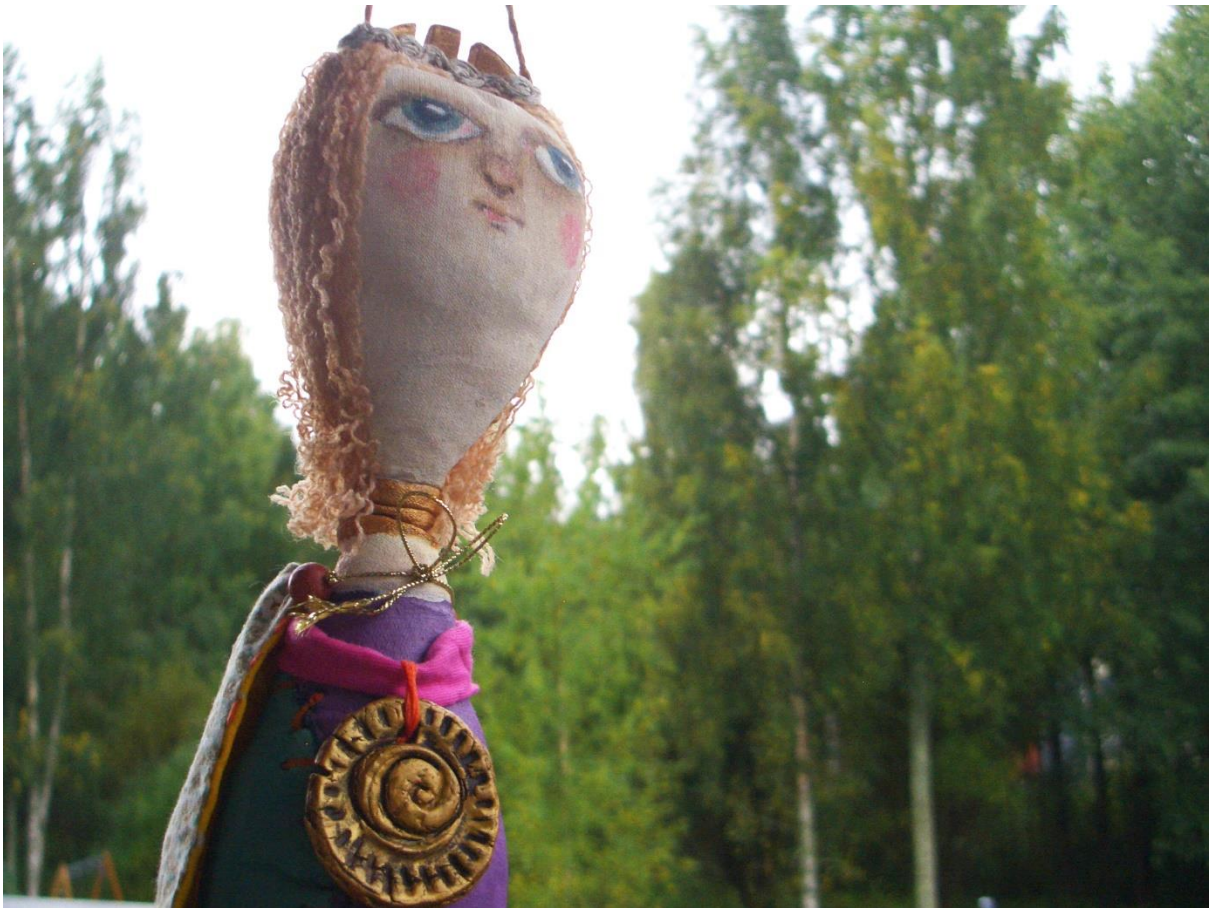
Kuva 5. Päivän sankari.