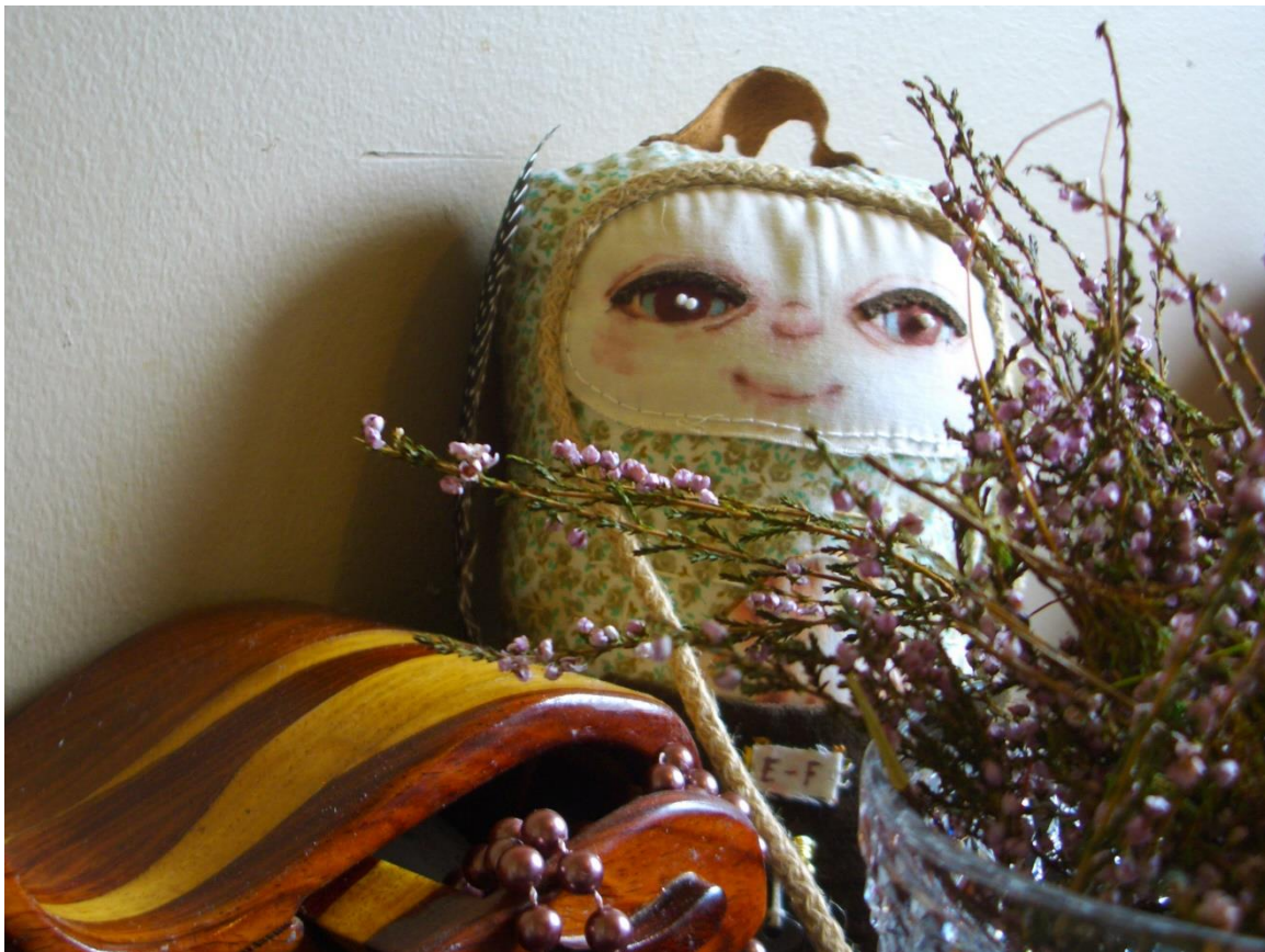
Kuva 7. Keräilijäsielu.