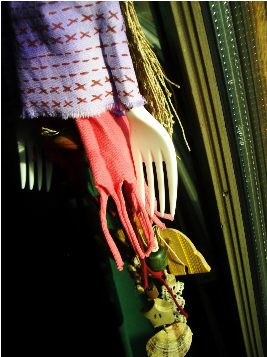
Kuva 12. Mitä kannan mukani.