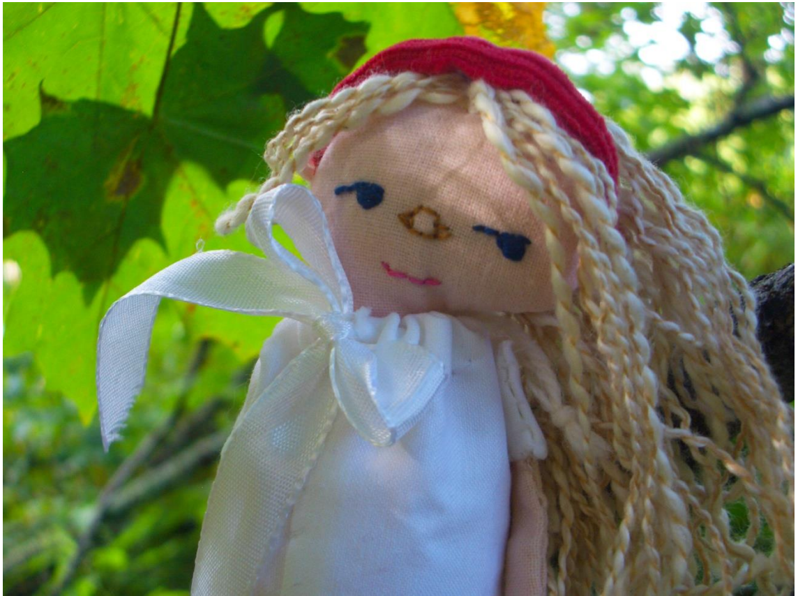
Kuva 11. Miniminä.