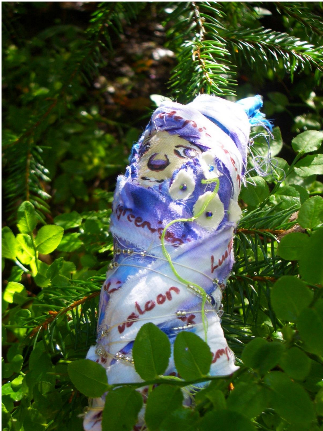
Kuva 9. Syreenimorsian.