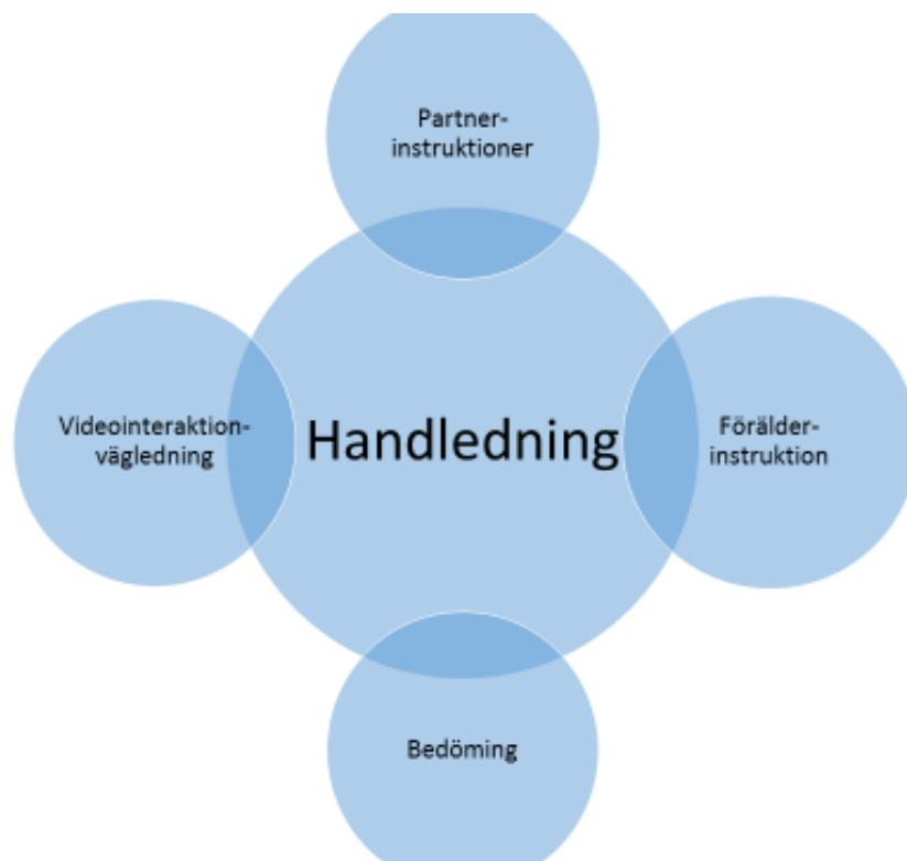
Figur 3 - Handledning

Figur 3 klargör att handledaren som är en av huvudkategorierna har fyra underkategorier som framkom i artiklarna. Dessa underkategorier har handledare som en gemensam faktor.