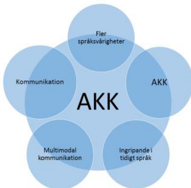
Figur 1 – Alternativ och kompletterande kommunikation