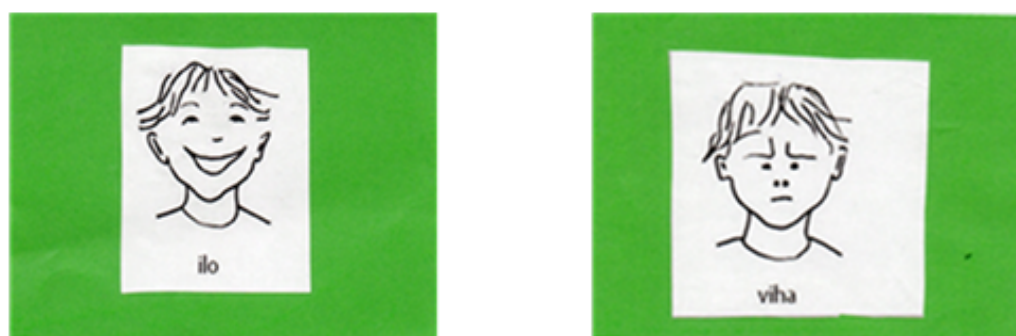
KUVA 1. Tunnekortti ilo ja viha (Opetushallitus 2013)