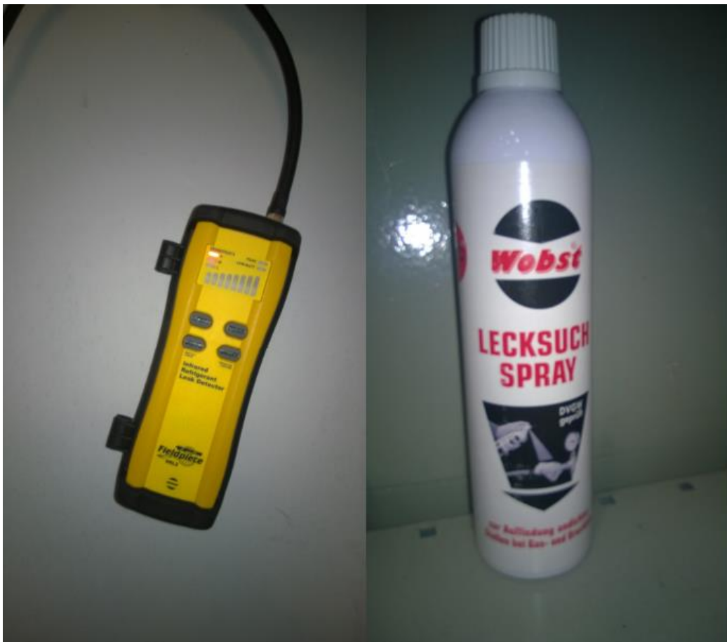
Kuva 2. Elektroninen vuoto-testeri ja vuotovaahtopullo, joiden avulla etsitään vuotokohtia kylmälaitteista.

Kylmälaitteiden määräaikaiset vuototarkastukset koskevat laitteita, jotka sisältävät otsonikerrosta heikentäviä aineita tai fluorattuja kasvihuonekaasuja. Näitä aineita ovat mm. CFC- HCFC- ja HFC-kylmäaineet. Kylmälaitteiden omistajan on huolehdittava, että pätevä henkilö suorittaa laitteiden määräaikaistarkastukset riittävin väliajoin. Tarkastuksien tarkoituksena on ennaltaehkäistä/estää vaarallisten kylmäaineiden vuotaminen ulos kylmälaitteista. Tarkastuksissa apuvälineinä käytetään elektronista vuoto-testeriä ja vuotovaahtopulloa, jotka auttavat paikantamaan mahdollisia vuotokohtia. (Kuva 2.)