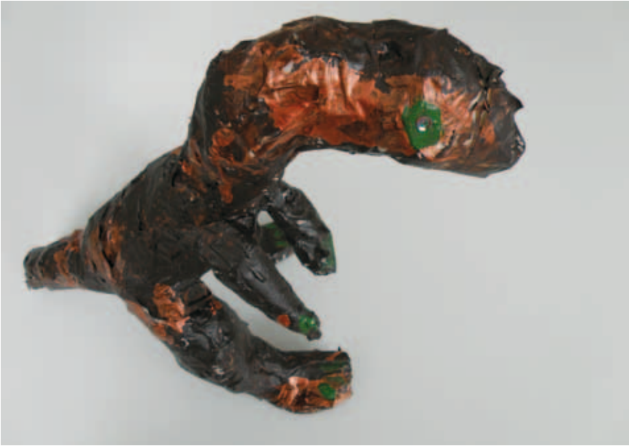
Kuva 4. T-Rex.

Känkäinen ja Tiainen (2007, 81) käsittelevät artikkelissaan tilaa tavalla, jollaisena itsekin sen pohtimani vapaavyöhykkeen yhteydessä ymmärrän. He näkevät tilan ihmisen sisäisenä maisemana ja olotilana kuin myös fyysisenä paikkana ja jaettuna kokemuksena. He tarkastelevat tilaa henkilökohtaisten kokemusten ja elämysten tasolla. Koulukotien työntekijöille suuntaamassaan koulutuksessa he asettivat keskeiselle sijalle oman tilan tunnustelemisen ja etsimisen, jotta aikuiset voisivat päästä lasten elämäntarinoiden äärelle. Tämä on mielestäni tärkeä näkökulma vapaan tilan luomiseen. Päästäkseen lähelle toista ja tukeakseen mahdollisuuksien ilmapiiriä, on oltava itse matkalla ja tietoinen omista tunteistaan. ”Koti on paikka, joka muodostuu sinne, missä joku on läsnä”, kirjoittaa Hellsten. (Hellsten 2009, 37). Toinen tilaa ja kotia käsittelevä taiteentekijämme Laurin maalaus on nimeltään Laurin unelmatalo . Talo on mahdollisuuksien tila, jossa ”voi viettää mukavaa aikaa”. Lauri kertoi teoksen tarinaa taloa maalatessaan. Tässä katkelma tarinasta: