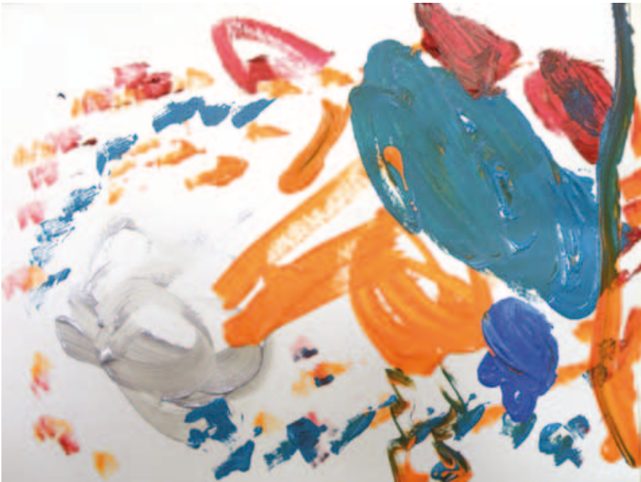
Kuva 9. Nepali.

Sovelsin sadutusta taidetoimintaan yksilöllisesti, siten kuin taiteentekijämme siihen tarttuivat. Toisille tuntui mielekkäältä kertoa tarina ja lähteä tuon tarinan innoittamana kuvalliseen työskentelyyn. Joskus valmistuneelle teokselle alkoi syntyä sanallinen tarina. Toisinaan tarina ja teos syntyivät samassa hetkessä. Taiteentekijämme Ylöjärvi otti jälkimmäisen menetelmän omakseen ja saattoi joskus nopeasti pensseleihin tarttuen heittäytyä kertomaan jännittävää tarinaa samalla maalaten. Tämän vauhdin ja heittäytymisen voi aistia mm. hänen Nepali - teoksensa (Kuva 9) kuvauksesta: ”Tää ei oo pitkä. Tänne tulee, arvaa! Se liittyy saareen, liittyy Nepaliin. Vihreet on taas ne poikanorsut ja ne on saaria samalla. Punaset on sydämiä ja vauvanorsuja. Noin.” Maalaus ja tarina syntyivät muutamassa minuutissa. Taustalla olivat erään työntekijän Nepalin matkakertomukset, joita Ylöjärvi muisteli useassa teoksessaan. Norsut ja krokotiilit olivat tehneet häneen suuren vaikutuksen.