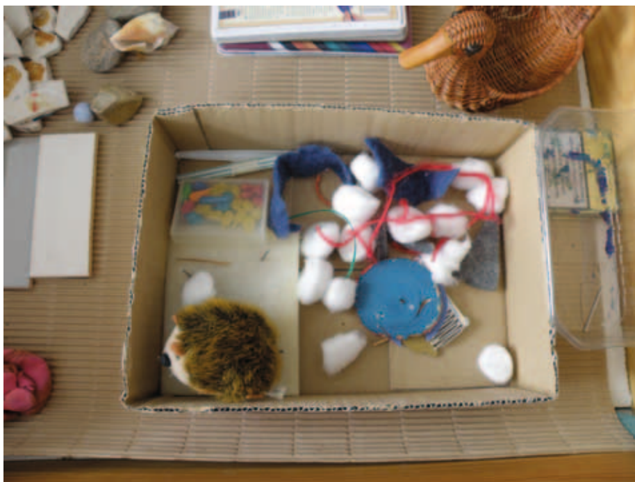
Kuva 10. Siili muistokaupungissa