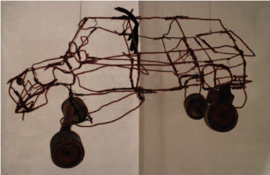
Kuva 9. Namibian lasten teos.

Kylän raitilla lapset leikkivät itse tehdyillä autoillaan. He tekevät autot jättemateriaalista. Rautalangan pätkät, joista auton runko taivutellaan, on kerätty pitkän ajan kuluessa sieltä täältä, pyörät saadaan peltisistä juomatölkeistä, jonkun auton puhjenneen ulkokumin riekaleista saa hyvät roiskeläpät. Autoissa on käytetty mielikuvitusta: yksityiskohtia antennissa, lampuissa, peileissä. Joskus etuakseliin on kiinnitetty ohjaamista varten pitkä keppi, jonka toisessa päässä on auton ratti, josta autoa voi seisaaltaan ohjata.