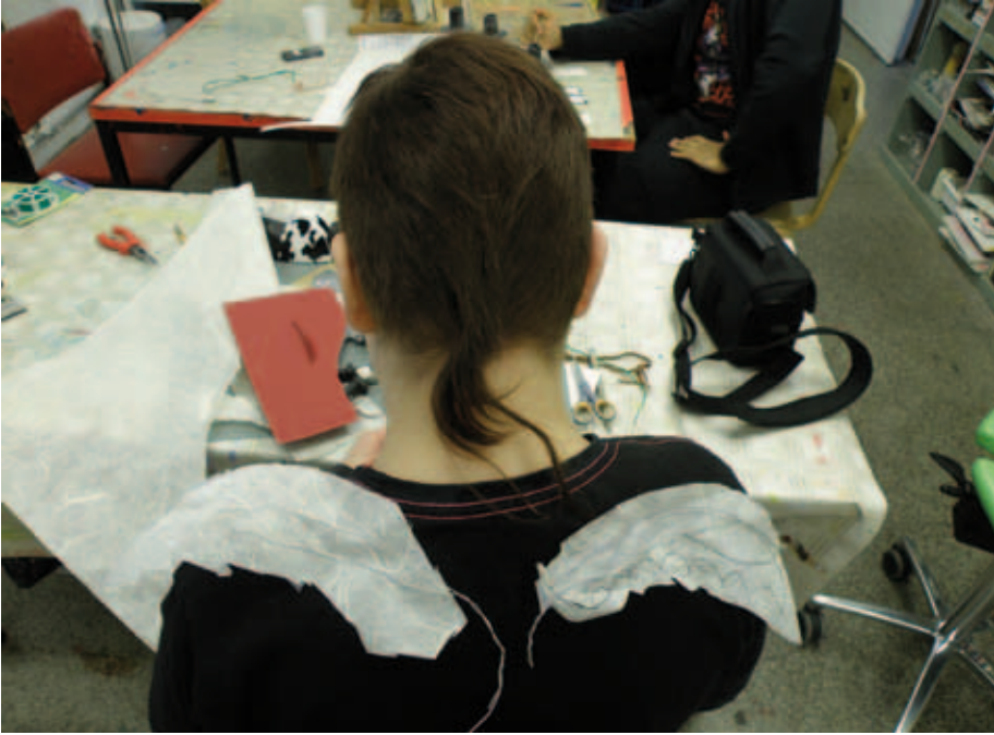
Kuva 1. Väinön siipien prototyypit.

Tässä luvussa pohdin, millainen voisi olla vapaa tila, joka rohkaisee luovaan työskentelyyn? Entä toisinpäin: millainen voisi olla vapaa tila, joka voi alkaa saada muotoaan luovassa työskentelyssä? Koetan löytää erilaisia nimitäjiä tarkastelemalleni ilmiölle. Tekstini on syntynyt tässä etsinnässä. Pohdin erilaisia näkökulmia, joiden ajattelen raivaavan tilaa taiteelle leikkinä sekä tukevan kotoisan tilan rakentumista luovalle prosessille. Olen ajatellut, että vapaavyöhykkeellä ihminen voi jakaa taidetyöskentelyssä aidoimpansa. Hän voi iloita luovuudestaan ja ehkäpä aavistella sen, mitä hän teoksellaan ja työskentelyllään haluaa kertoa, tavoittavan myös toisen ihmisen. Lähtökohtanani tätä tilaa tunnustellessani on ollut ajatus, että sisäinen kotoisuuden kokemus, jollaiseksi vapaata vyöhykettä voisi myös kutsua, avautuu taidetyöskentelyssä juuri samaisessa paikassa, missä myös taiteen terapeuttisuus koskettaa ihmistä syvimmin. Päivi Känkänen ja Ulla Tiainen kuvaavat kotoisuuden kokemusta osuvasti artikkelissaan Omaa tilaa etsimässä :