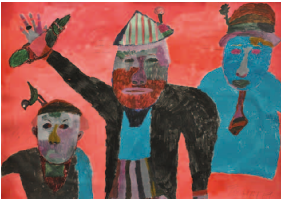
Kuva 3. Mikkelin taidemyrskystudio. Sanna Kontinen 2013.