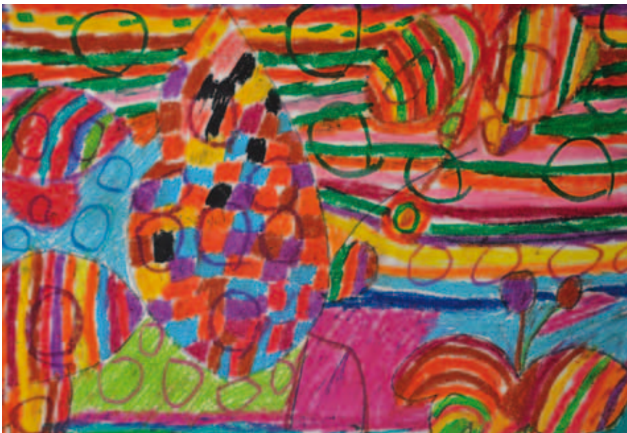
Kuva 1. Vaalijalan taidepesula. Pirkko Lyytinen 2012.

Lapsi muistaa näköhavainnon avulla, yhdistämällä kuvan paikkaan. Vasta kirjoituskyvyn ja lukemiskyvyn kehittyttyä, kuvaan liittyy sana. Aikuisuudessa muistot säilyvät muistissa sanoina ja kuvina. Vanhuudessa jäljelle jää pelkkä kuva.