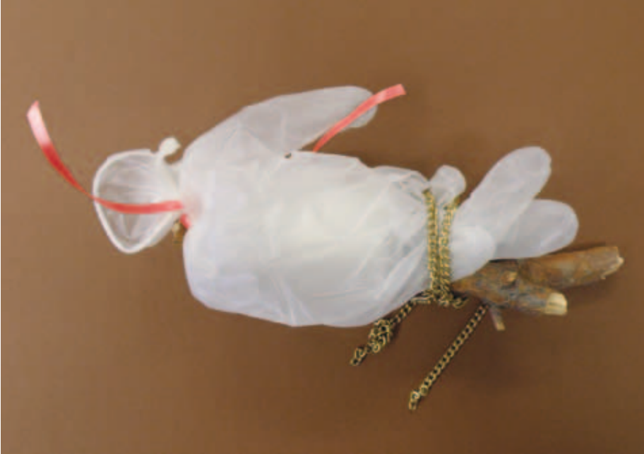
Kuva 7. Kultainen sorsa.

heenvuoro. Koin suurena luottamuksen osoituksena saadessani ottaa hoivini tämän sorsan. Se muistuttaa minua kolmesta vapaavyöhykkeen sulottaresta: luottamuksesta, antautumisesta ja yhteisestä päämäärästä.