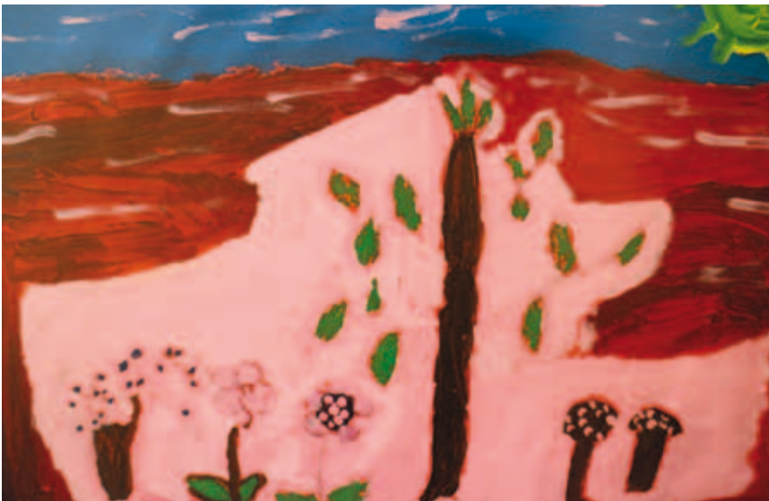
Kuva 2. Mikkelin taidemyrskystudio. Raili Liukkonen 2012.

Raili Liukkonen esitteli näyttelyssä olevaa akvarelliaan: ”Tämä on merimaisema, jossa on iso kivi keskellä, se on tehty akryylimaaleilla”. Sitten hän sanoi pontevasti: ”Minä kerron tästä kaikille palvelukodissa, että täällä on nyt minun maalaus esillä, kyllä heidän on tultava katsomaan tätä!”