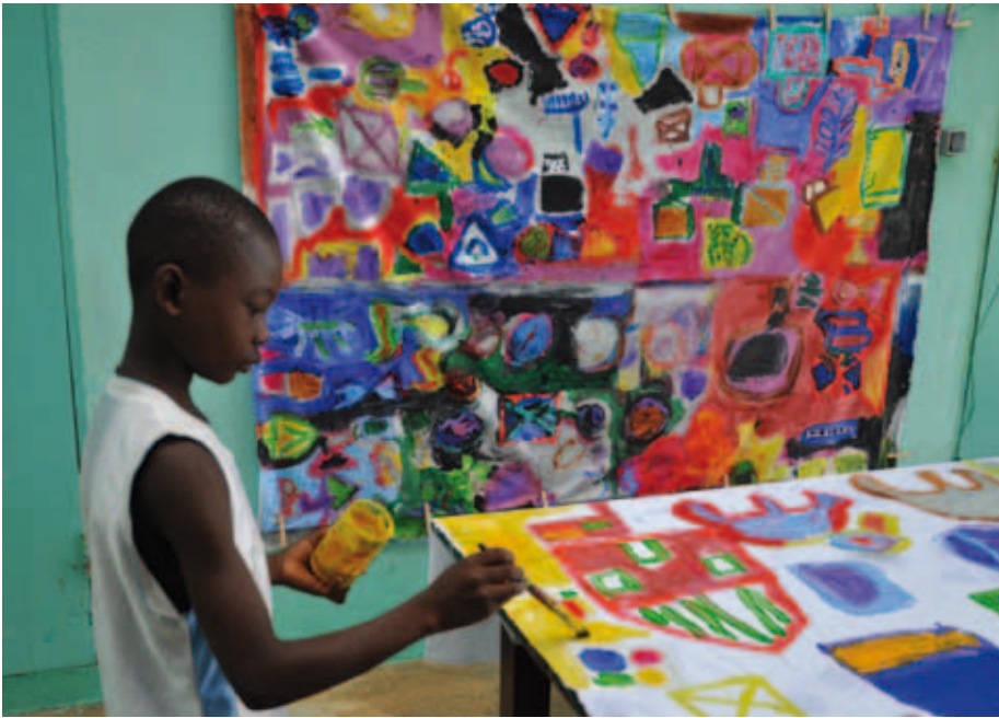
Kuva 15. Poika maalaa aurinkoa Sunshinen orpokodissa.

Namibian Ambomaalla kuvallinen ilmaisu oli sosiaalinen, yhteisöllinen tapahtuma: monta lasta yhdessä tiiviissä ringissä maalaamassa kangasta, eikä haitannut vaikka kankaan ympärillä oli ahdasta. Tunnelma oli iloinen ja äänekäs. Yksi poika esitti rumpusoolon pöydänpintaan siveltimet rumpupalikoinaan. Lasten maalaamassa kankaassa oli nähtävissä viitteitä heitä ympäröivästä arkielämästä: pyöreitä taloja, lavallisia pickup-autoja, maissinjauhatusastia, palmuja.