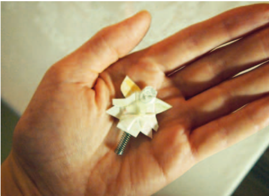
Kuva 12. Vieterienkeli

Ensimmäiseen kuvaani olen tallentanut erään enkelin. Työstäessäni artikkeliani postilaatikostani putosi puhutteleva yllätys. Kirjekuoressa oli lahja pieneltä ystävältäni. Vieterienkeli (kuva 12) on ollut matkallani mitä suurin aarre ja muistutus. Tekstiini kudottuna se symboloi sisäisen lapsen huomioidamisen merkitystä. Sisäinen lapsi on vieterienkelin lailla hauras, joustava ja ihmeitä tekevä, sellainen, jonka voi helposti kadottaa näkyvistä. Olen laittanut vieterienkelin kotonani pieneen peltirasiaan ja tarpeen vaatiessa voin kurkistaa kannen alle.