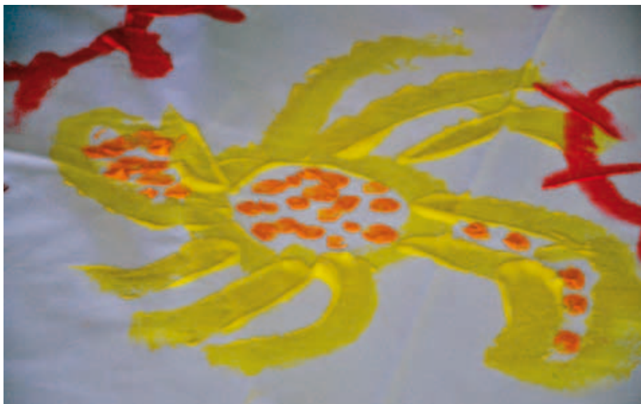
Kuva 11. Grand Popon koululaisten teos.

ihmisten puheet ja huudahdukset, naurut, kaikki ne yhtä aikaa tässä kuumuutta väreilevässä väkevässä ilmanalassa.