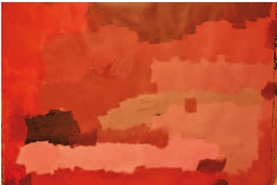
Kuva 4. Kuopion taidemyrskystudio. Marko Tiihonen 2013.