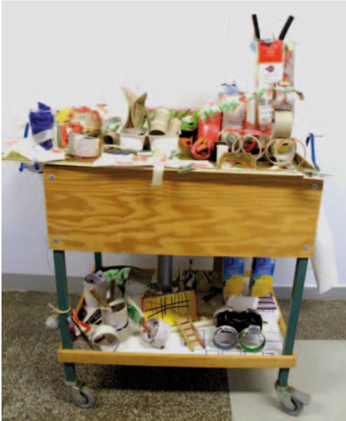
Kuva 2. Ylöjärven kaupunki.

Rakentaessaan kaupunkiaan hän kertoo samalla, mitä kaikkea juuri tuona kyseisenä hetkenä tapahtuu. Minun tehtäväni on olla kiinnostunut kirjuri. Kaupunki on elänyt läpi lukuisia eri vaiheita ja muodonmuutoksia, joiden käsikirjoittajana Ylöjärvi on ottanut haltuun jatkuvasti yhä uudenlaisia reittejä ja ratkaisuja. Ylöjärvi on ollut kaupunkinsa johtaja. Johtaja kuitenkin kuolee kapinassa (idean Ylöjärvi oli saanut uutisista), jolloin Ylöjärvestä tulee kaupungin Pomo. Kaupungin rakentaminen on täynnä leikkiä, kysymyksiä ja ratkaisuja, materiaaleilla herkuttelua, tutkimista, kertomista ja jakamista, kuten saattaa aistia seuraavasta tarinasta, joka syntyy kaupungin rakentuessa: