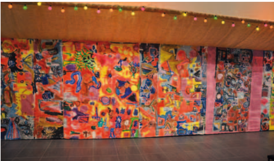
Kuvat 12.–13. Mukara, mukara -lasten ja nuorten kansainvälinen taidebasaari.

Vienankarjalaisten nuorten kangas-maalaukset vievät katsojan Jyskyjärvelle, Venäjän Karjalaan, runonlaulualueelle ja suomalaisen kulttuurin juurille. Värikkäät telttakankaat ovat syntyneet lasten työpajoissa Grand Popon kylässä Beninissä sekä Ongwedivan kylässä Namibiassa. Mukana on runsaasti