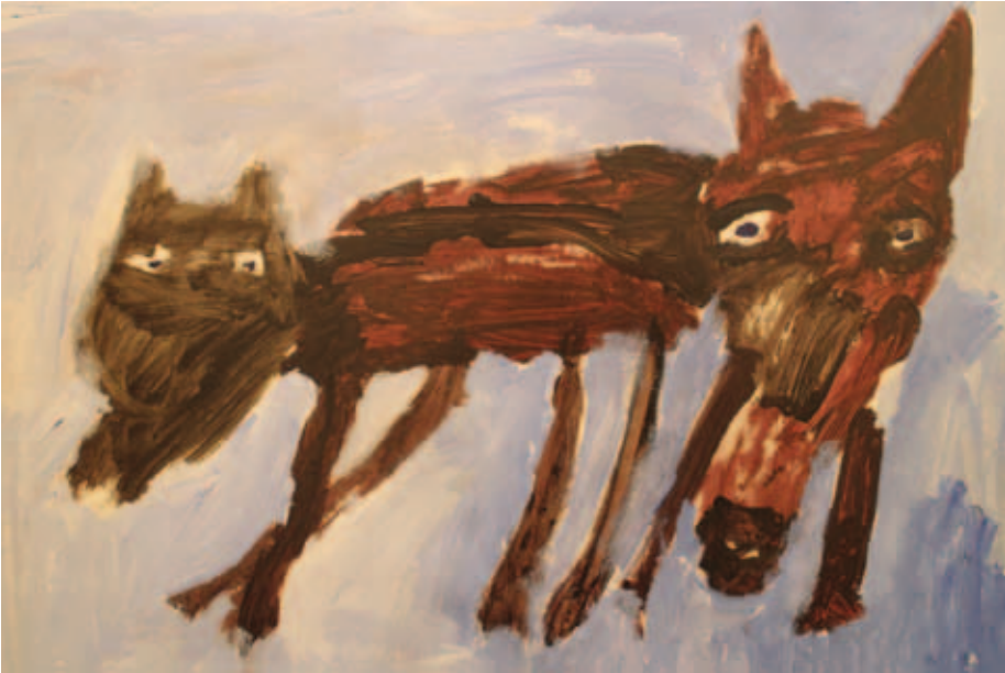
Kuva 5. Varkauden taidemyrskystudio. Marcus Nissinen 2013.