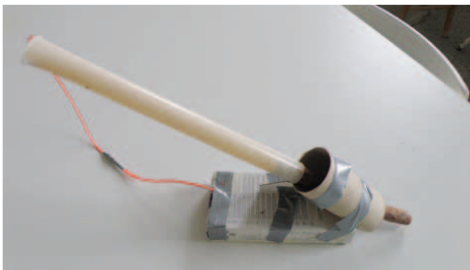
Kuva 8. Imu-Ilmari.