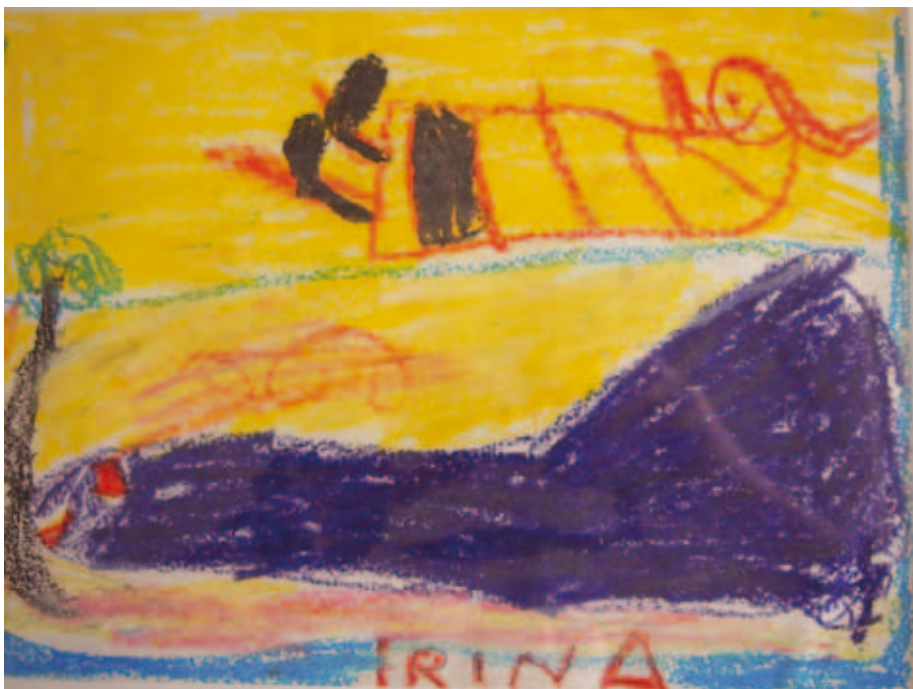
Kuva 13. Lapsuuteni piirros