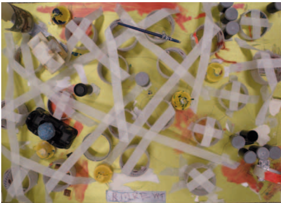
Kuva 15. Labyrinttipeli