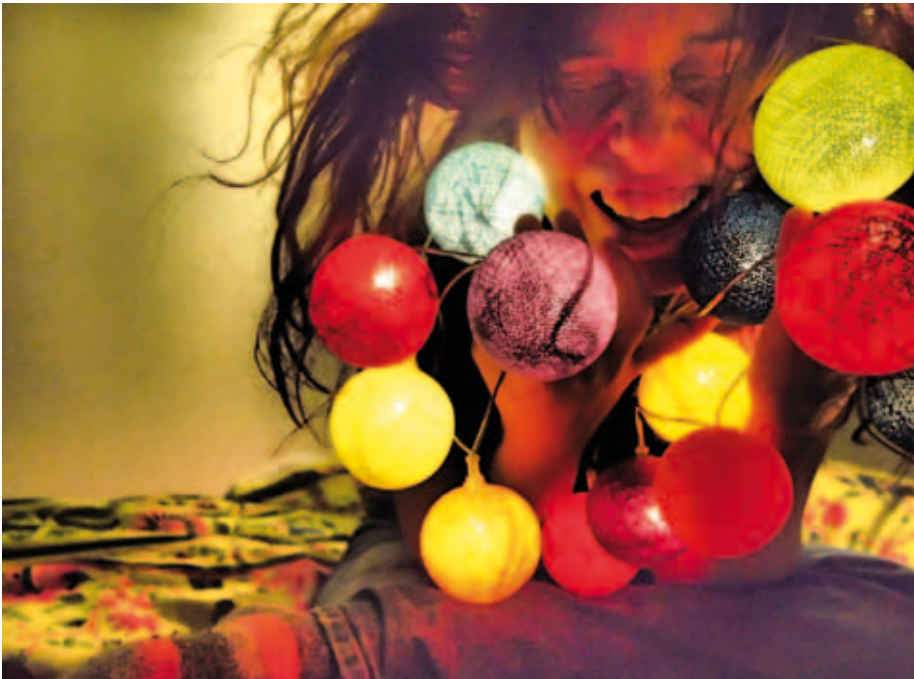
Kuva 14. Annamari, joulupallot ja villasukat

Tämän luvun viimeiseen kuvaan (kuva 14) on tallentunut leikinmaailmojen matkantekoon liittyvä ilo ja kotoisuus. Dokumentoin valokuvaamalla tietyn ajanjakson oman leikinprosessini täyteläisiä hetkiä. Olin kylässä ystävälläni Annamarilla. Hän on kuvassa villasukat jalassaan. Olen kirjoittanut artikkelissani vapaaseen tilaan liittyvästä kotoisuuden kokemuksesta. Mikä voisikaan tätä paremmin ilmentää kuin villasukat? Kuva on värikäs ja huoleton. Se on osuvimmalta tuntuva likiarvo leikille ja läsnäololle, joita olen kirjoituksessani koettanut kaivertaa esiin ja jota etsin myös oman sisimpäni kuvakerroksiin kaivautumalla.