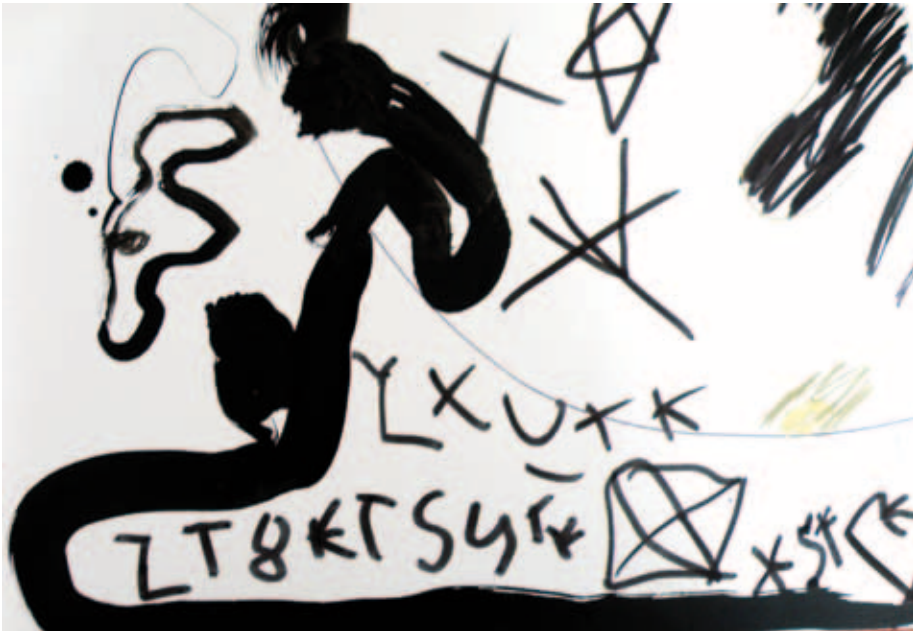
Kuva 3. Kiinan maapallo.

Mukaien Ylöjärven kertomusta: vapaavyöhyke on arvoituksellinen tila, jossa jollakin merkillisellä tavalla saletisti natsaa. Tämä natsaaminen taas voi ihmisen kokemusmaailmassa olla hyvin monimerkityksistä. Kun ihminen löytää sisäisen kodin avaruutta ja vapaata tilaa taiteelliselle ilmaisulle, tuo se mukanaan arvaamattomuuden, josta Känkänen ja Tiainen seuraavassa sitaatissa muistuttavat: