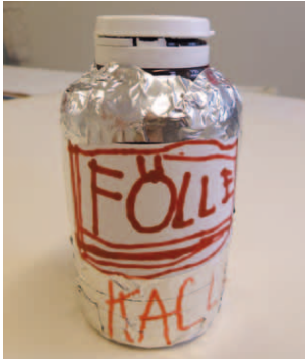
Kuva 5. Erikoisvalmistetta: Fölle – silmänlumetta.

Tää on vaarallista ainetta kaikille. Tää pannaan vain lentokoneisiin. Hengenvaarallista! Siihen kuolee, tähän aineeseen, jos tähän koskee. Niin. Ainakin sissään jos koskee. Tällai. Se on semmosta ainetta. Ei muuta.