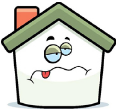
BILD 1. Inomhusmiljöproblem orsakar stora kostnader för samhället.

Målet med handboken är att ge en bred objektiv syn på vad inomhusklimat och – miljö är, hur de påverkas av olika faktorer, ge kunskap om problemställningar med inomhusmiljön och byggnadstekniska problem samt påvisa att faktorer i inomhusmiljön kan påverka trivselen och hälsan för individen. Med hjälp av handboken kan man belysa olika sätt att mäta faktorer i inomhusmiljön, visa hur lagstiftningen i Finland styr undersökningen av problembyggnader och påföljande åtgärdsprocesser samt lyfta fram den senaste forskningen inom området, de studerande skall även känna till var man söker information. Målgrupp är byggnadsingenjörstudenter och yrkesverksamma.