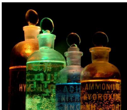
BILD 10. Gifter

Biociderna är kemiska ämnen, produkter eller mikroorganismer vars uppgift är att förintä, bekämpa eller oskadliggöra skadliga organismer, förhindra deras inverkan eller begränsa deras förekomst. Vid mögel- och fuktsanering används det ibland olika typer av biocider för att förhindra ny tillväxt och döda de sporer som är kvar. I föreläsningen betonas förståelsen av vad olika varningsmärken och anvisningar betyder, användning av korrekta personskydd och kunskap om vilken information som finns på MSDS-blad (Material Safety Data Sheet, på svenska säkerhetsdatablad). Som övningsuppgift skall studerande leta reda på MSDS-blad till en viss produkt, ta reda på om den är godkänd för försäljning och användning i Finland samt vilken