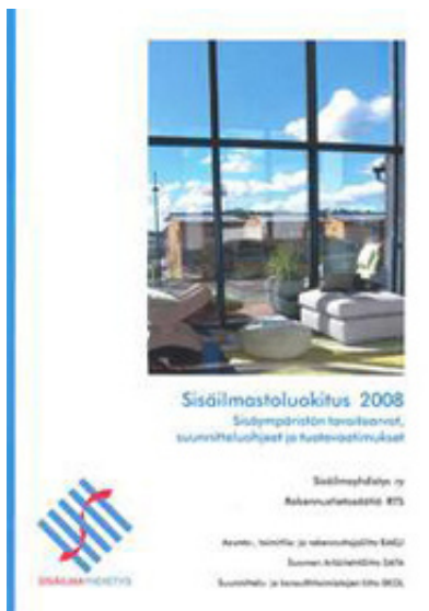
BILD 4. Utgiven av Sisäilma-yhdistys ry.

Föreläsningens budskap skall vara att man genom god planering och åtagande från alla parter kan påverka inomhusmiljön i den färdiga byggnaden så att den är trivsamt och inte orsakar ohälsa. Publikationen "Klassificering av inomhusklimat 2008" (Sisäilmastoluokitus 2008 1 ) är ämnad att användas som hjälp vid planering och byggande av hus och tillhörande husteknik samt vid tillverkning av byggnadsmaterial, för att bygga hälsosammare och trivsammare byggnader. Man kan även tillämpa delar av den vid renovering. Klassificering av inomhusklimat anger mål- och planeringsvärden och stöder byggherrens, planerarnas, apparattillverkarnas, entreprenörernas och driftspersonalens arbete.