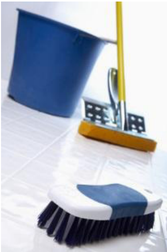
BILD 12. Korrekta redskap och personskydd är viktigt

Under föreläsningen presenteras upplägget till grupparbetet där studerande skall planera och beskriva tillvägagångssättet för planeringen och utförandet av ett riktigt eller fiktivt fukt- och mögelskadesaneringsobjekt. Som material kan de studerande använda bl.a. RT-kort.