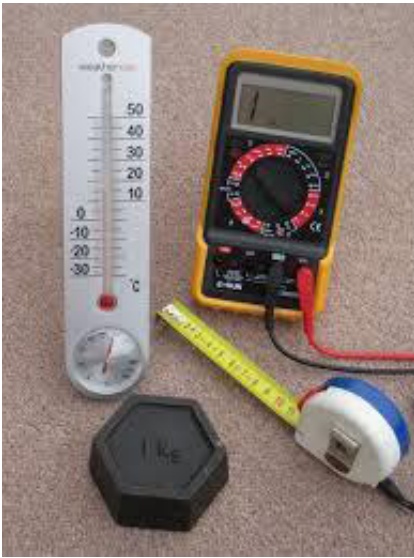
BILD 5. Olika typer av mätare

ran hanteras korrekt och öka förståelse för hur upptäckta defekter påverkar byggnaderna och därigenom inomhusklimatet.