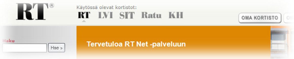
BILD 11. RT-kort databasen finns tillgänglig via nätet

”Tilaaajan ohje sisäilmasto-ongelman selvittämiseen” 4 , lämpar sig för undersökningar på arbetsplatser. Den riktar sig till disponenter, ägare av byggnader samt administrativt ansvariga när man skall ta itu med ett inomhusklimatproblem. Den berättar steg för steg hur man gör ett helhetsbetonat angreppssätt för att utreda problem med inomhusklimatet, den definierar ansvarsområden för beställare och arbetsgivare och preciserar de olika stegen i utredningen, den definierar kompetenser för undersökningsskedets ansvarige och konsulterande experter, den anger minimikraven för rapporteringen av utredningsskedet och ger en modell för offertförfrågningar.