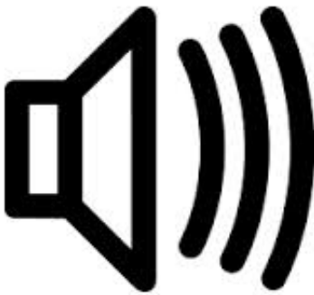
BILD 6. Akustikmätningar

Maskinell ventilation påverkar trycket inuti byggnaden, därför bör speciell vikt sättas vid hur tryckskillnader mäts. Förståelsen för följderna av respektive undertryck och övertryck i en byggnad bör betonas. Mätinstrument som används för kontroll av ventilationens funktion är CO 2 -mätare och utflödesmätare. En byggnads täthet påverkar bl.a. energiförbrukningen. Brister i tätheten kan även leda till fukt- och mögelskador. För att undersöka en byggnads täthet används en s.k. blower door, om man kombinerar med termografering kan man lokalisera bristerna i byggnadens klimat skärm.