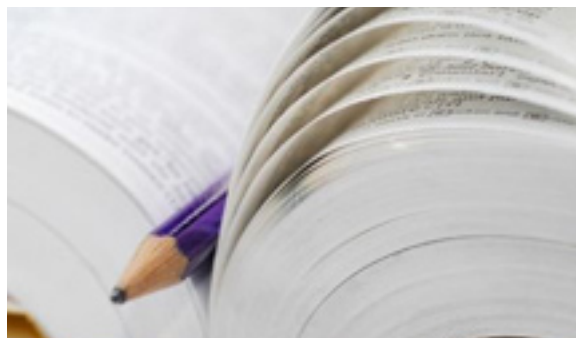
BILD 3. Hälsoskyddslagen reglerar inomhusmiljön i bostäder.

Förutom lagen är Finlands byggbestämmelsesamling 2 bindande. Den kompletterar markanvändnings- och bygglagen och byggnadsförordningen 3 (895/1999) och omfattar bl.a. byggnadstekniska och motsvarande föreskrifter och anvisningar. Byggbestämmelsesamlingen innehåller föreskrifter och anvisningar i 7 klasser, A-G. Föreskrifterna är förpliktande medan anvisningarna inte är det utan andra lösningar kan användas så länge resultatet når kraven i föreskrifterna. Hurudant inomhusklimat och inomhusmiljö det bör vara i bostäder regleras i Finland av hälsoskyddslagen 1 (763/94). Den reglerar även ansvarsområden för myndigheter, samt kompetenskrav på de externa experter som myndigheten kan använda sig av.