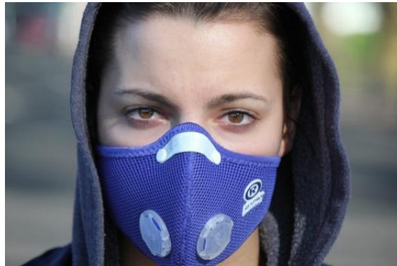
BILD 9. Andningsmask

Om reningstekniken producerar sekundära föroreningar måste även dessa noteras vid val av teknik. Det är även vanligt att luftrenare används under en kortare eller längre period före sanering eller som komplement till den befintliga ventilationen. På marknaden finns luftrenare med många olika funktionsprinciper. Man behöver förstå deras funktion för att kunna välja rätt utgående från de kartlagda problemen.