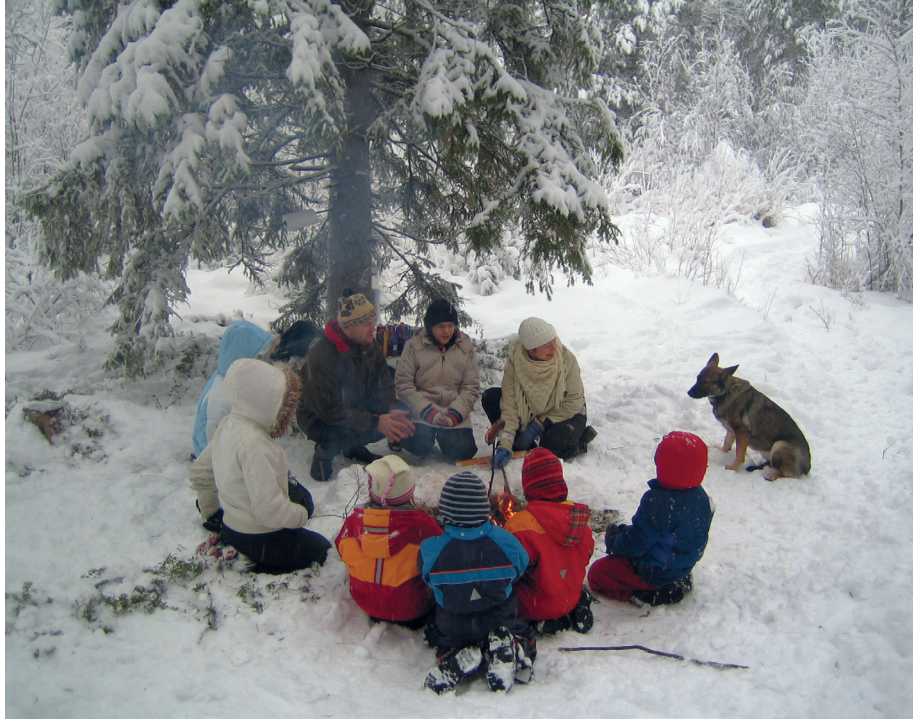
Kuva 4. VillaNutun iloisia retkeläisiä nuotiolla

lena Häkkilän elämäntilanne ja arvomaailma haastoi heitä tekemään merkittävää ja yhteiskunnallisesti arvokasta työtä lasten parissa. Aito auttamisen halu innosti keskittymään lastensuojelutyöhön. VillaNuttu tarjoaa laadukkaita lastensuojelun sijais- ja avohuollon palveluja sekä perhetyön palveluja.