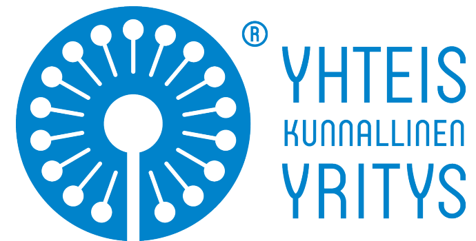
Kuva 3. Suomalaisen Työn Liiton Yhteiskunnallinen yritys- merkki

Suomalaisen Työn Liiton Yhteiskunnallinen yritys- merkin avulla yhteiskunnalliset yritykset voivat viestiä yhteiskunnallisesta vaikuttavuudestaan asiakkailleen ja muille sidosryhmilleen. Suomalaisen Työn Liitto voi myöntää merkin hakemuksesta sellaiselle yritykselle, joka täyttää liiton määrittelemät yhteiskunnallisen yrityksen kriteerit.