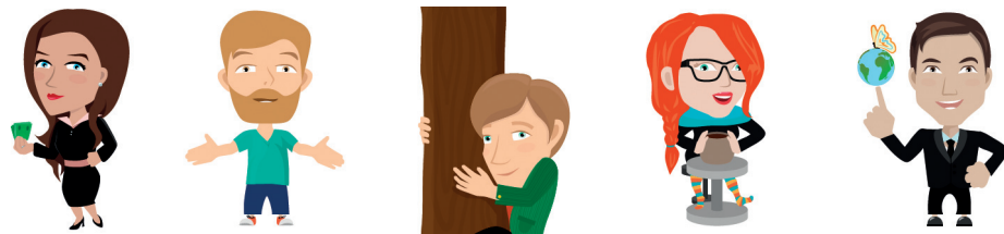
Kuva 6. Testin hahmot Mari Massi, Heikki Hoiva, Eero Ekologinen, Liisa Luova ja Taito Tomera

Projektin loppuvaiheessa ideoitiin, konseptoitiin, käsikirjoitettiin, visualisoitiin ja tuotettiin yhteiskunnalliseen yrittämiseen painottunut facebook-testi, jonka pääasiallinen tehtävä oli tehdä yhteiskunnallista yrittäjyyttä ja Yhteiskunnallinen yritys-merkkiä tutuksi leikkimielisellä tavalla. Testin aikana käyttäjä vastasi erilaisiin kysymyksiin ja tulokseksi hän sai yhteiskunnallisen yrittäjän profiilin hauskaasti visualisoituna.