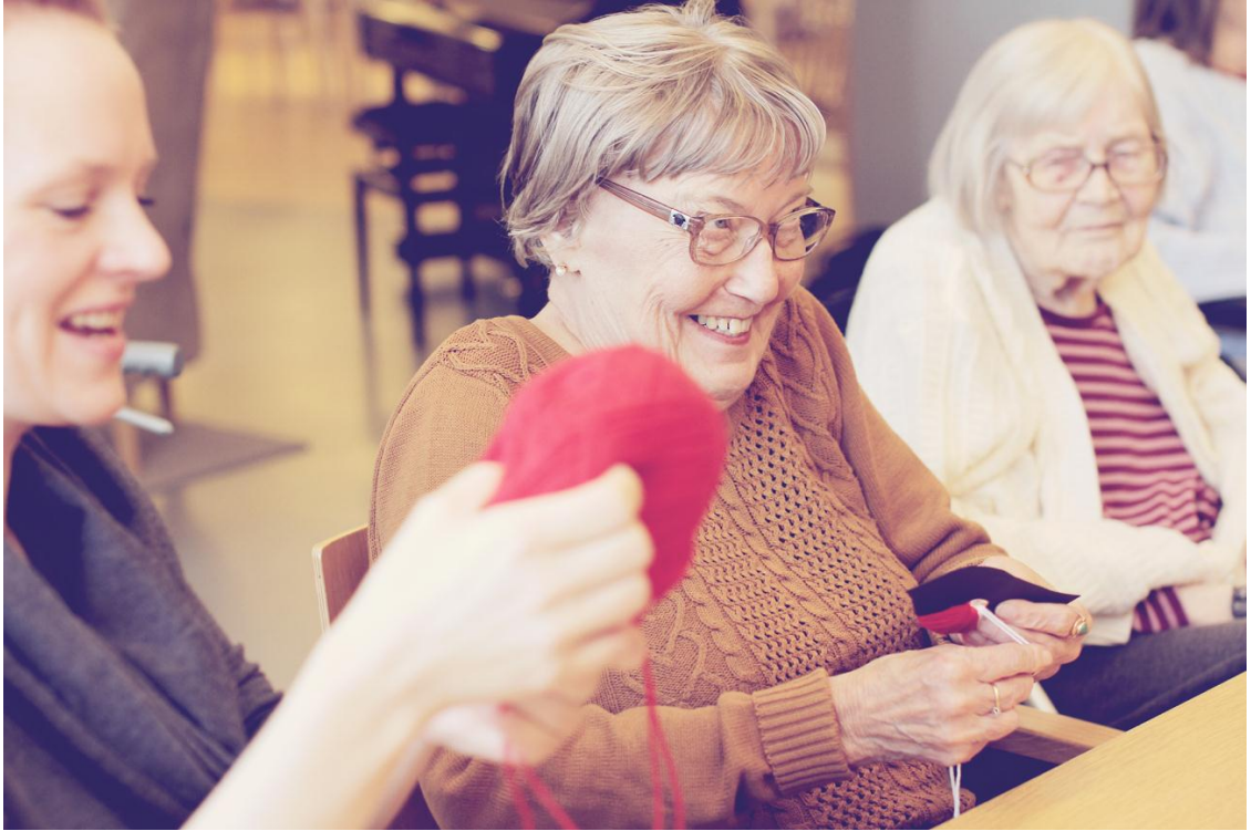
Kuva 5. Lankapunatulkkujen tekoa