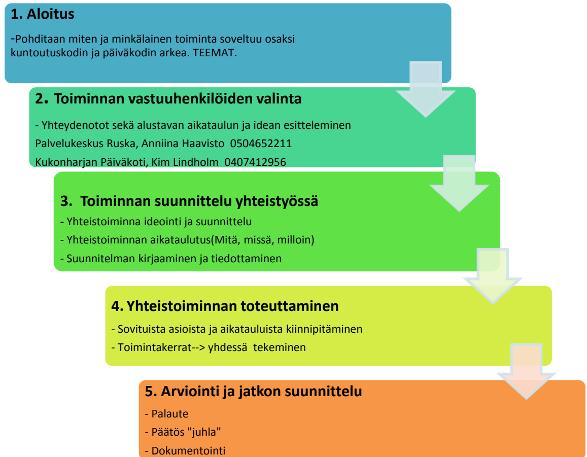
Kuvio 6. Palvelukeskus Ruskan ja Kukonharjan päiväkodin työtapamalli.