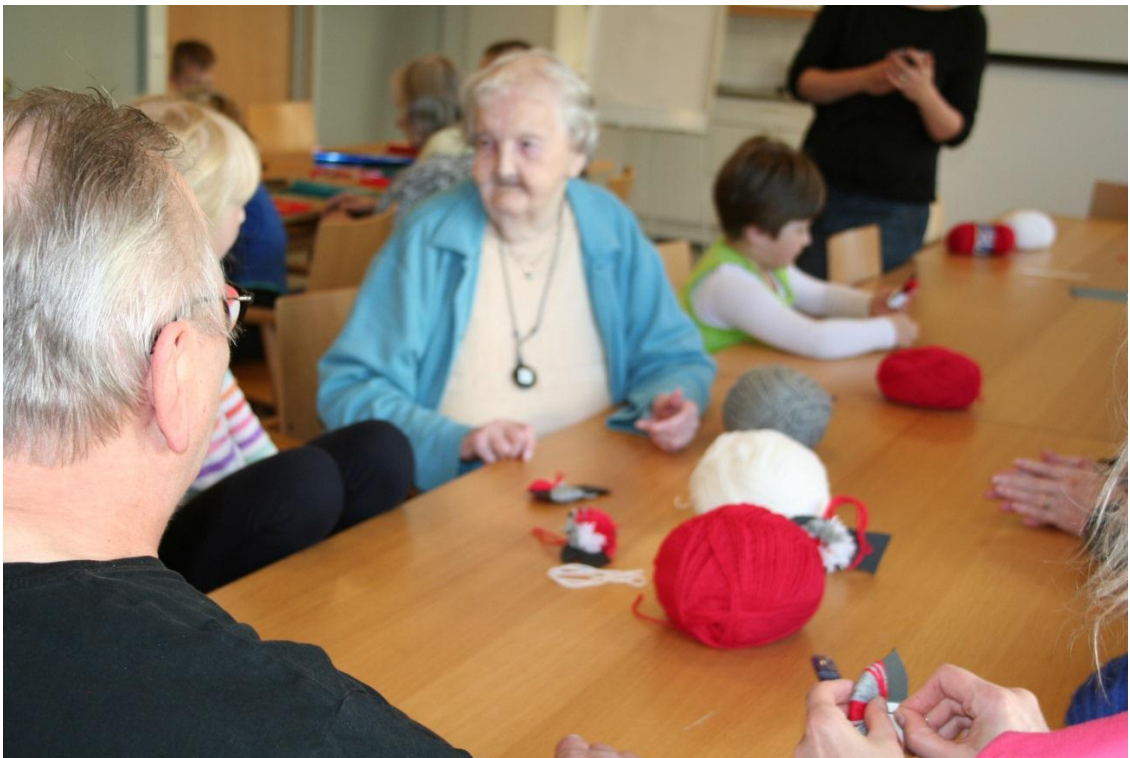
Kuva 6. Lankapunatulkkujen tekoa