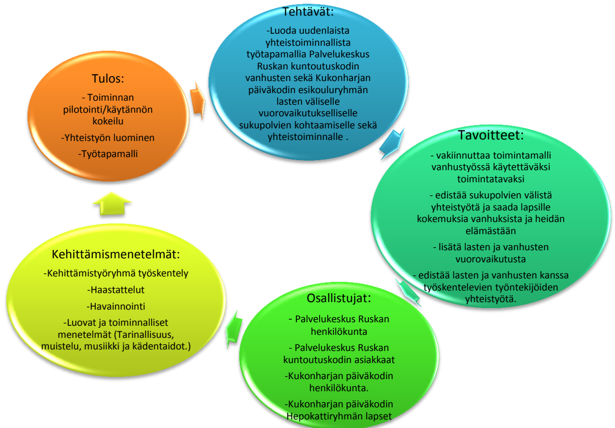
Kuvio 1. ”Matka joulun, matka muistoihin.” Sukupolvien välistä kohtaamista kehittämistyön kokonaisuus.

Yhteisen toiminnan vähäisyys eri-ikäisten ihmisten välillä antaa loistavan mahdollisuuden uuden kehittämiselle. Toimintaa suunnataan pääasiassa samanikäisille ihmisille ja eri sukupolvien ylittäviä rajoja haastetaan harvemmin. On tärkeää, että lapset ja vanhukset saavat kokemuksia kiireettömästä ja ystävällisestä vuorovaikutuksesta. Tärkeiden ihmissuhteiden luominen ja säilyttäminen on tärkeää läpi koko elämänkaaren (Ukkonen - Mikkola 2011, 123, 132; Siltala 2013, 82–86).