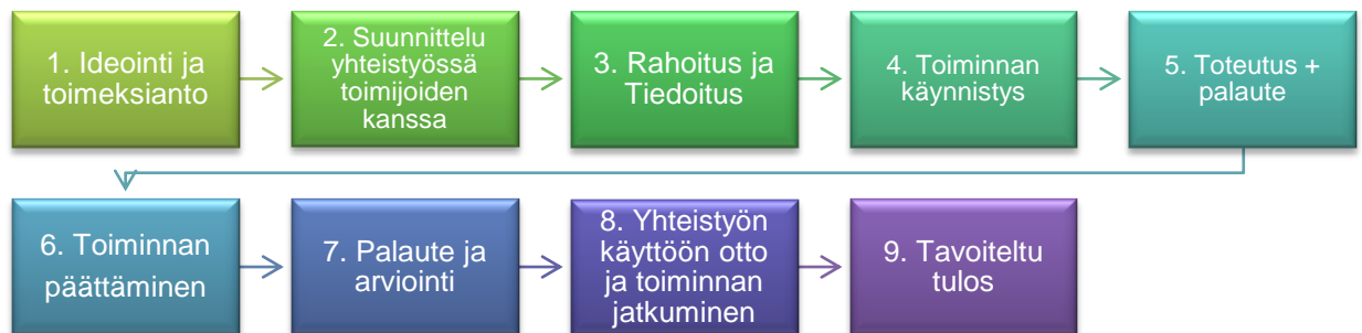
Kuvio 5. Kehittämistyön eteneminen vaiheittain.

Opinnäytetyöhöni sisältyvä kehittämistyö eteni koko prosessin ajan lineaarisesti vaiheistettuna. Kuviossa viisi on kuvattuna kehittämistyöni eteneminen.