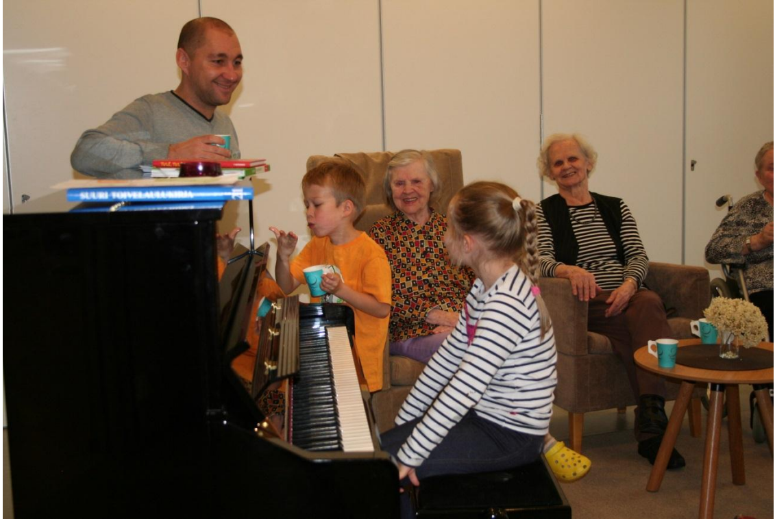
Kuva 10. Lauluhetki