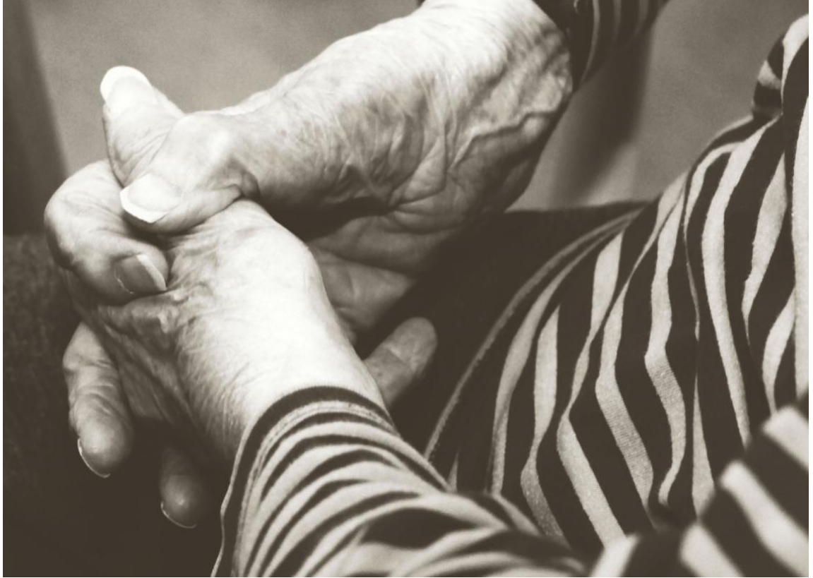
Kuva 12. Tunnelmaa toimintatuokiosta

Luomallaan yhteisöllisyydellä sukupolvityö tukee ihmisten hyvinvointia sekä elämässä viihtymistä (Ruoppila ym. 1999, 344). Kuvassa 12 on tunnelmaa lasten ja vanhusten yhteistoiminnan aikana.