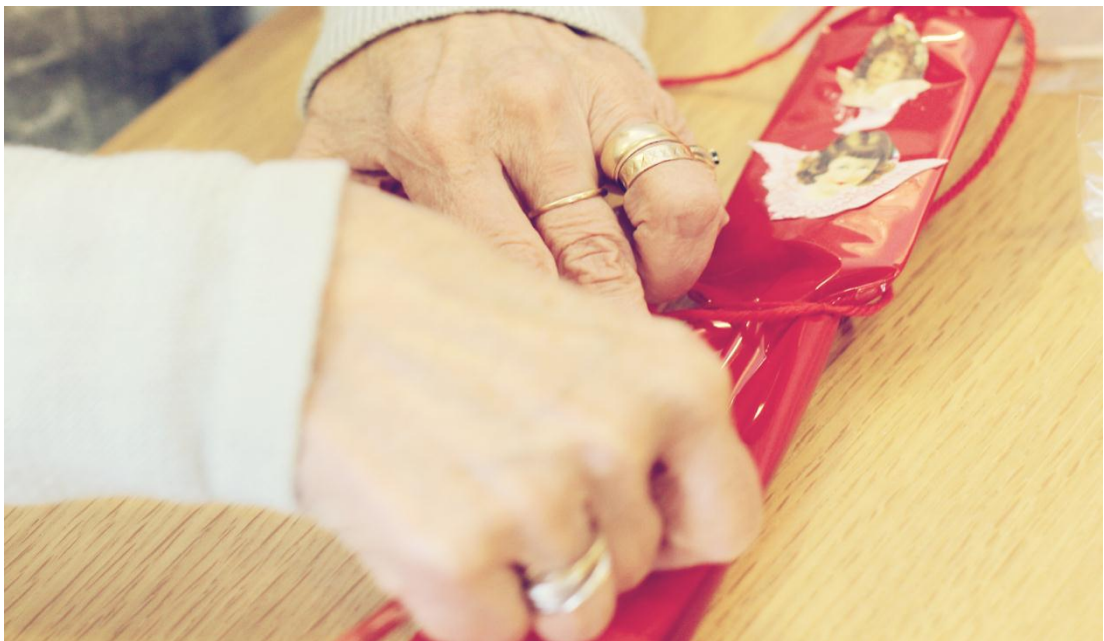
Kuva 2. Karkkikoristeen tekoa.