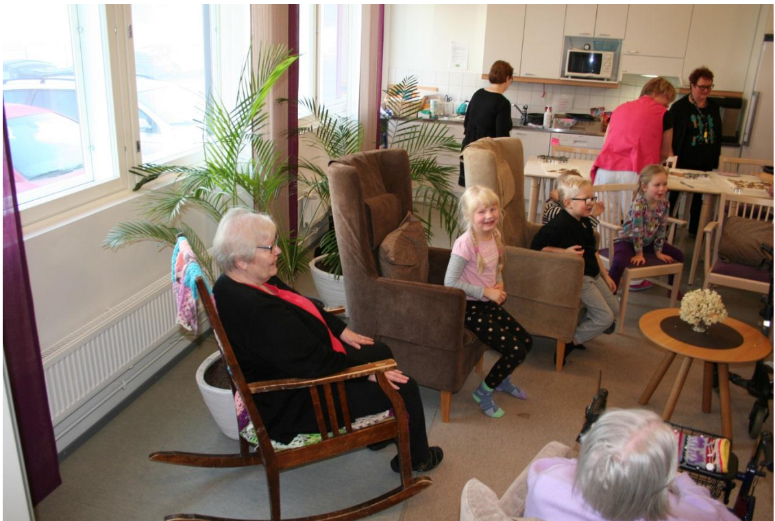
Kuva 11. Tarinoita