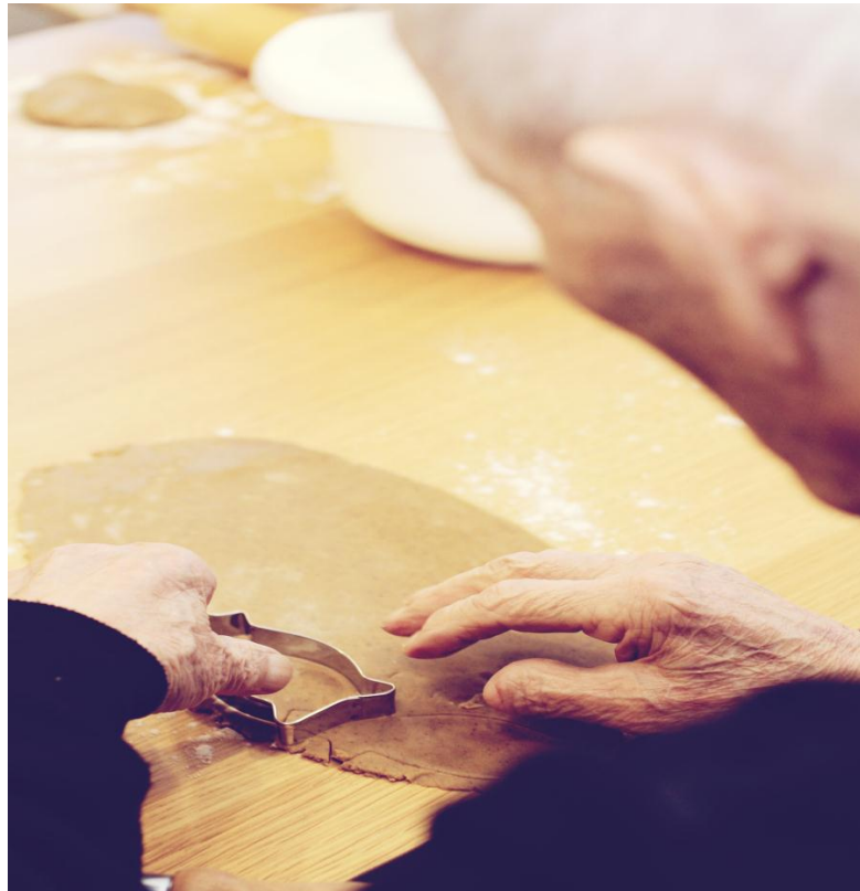
Kuva 7. Pipareiden leipomista.

Viikon toinen toimintakerta oli sisällöltään hieman erilainen. Myös toinen toimintakerta alkoi sadulla, joka johdatteli toiminnansisältöön. Sopivan sadun löysin Hannele Huovin (2001, 5-6) kirjoittamasta Matka Joulun taloon kirjasta. Satu kuunneltiin tiiviissä piirissä ja teema pysyi joulussa. Jouluinen tarina herätteli muistoja joulun herkuista kuviteltujen tuoksujen kautta. Tarinan jälkeen alkoi varsinainen toiminta, pipareiden leivonta ja koristelu. (Kuva 5-7) Leivonnan jälkeen lauleskeltiin joululauluja, jutusteltiin, nautittiin leipomistamme pipareista ja glögistä. Toimintatuokio päättyi yhteislaulantaan, jossa laulettiin yhdessä sovitut toivelaulut. Sama toimintamalli toistui 3 viikon ajan. Lapsi ja vanhusryhmät vaihtuivat viikoittain. (Kuva 5.)