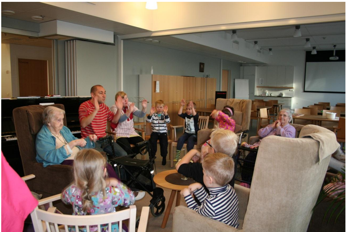
Kuva 9. Laulu/leikki hetki