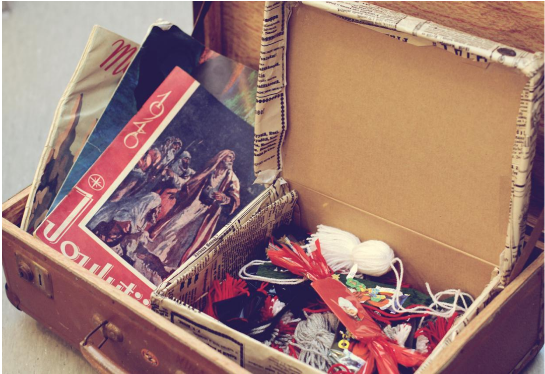
Kuva 1. Joulun salaisuuksien matkalaukku.