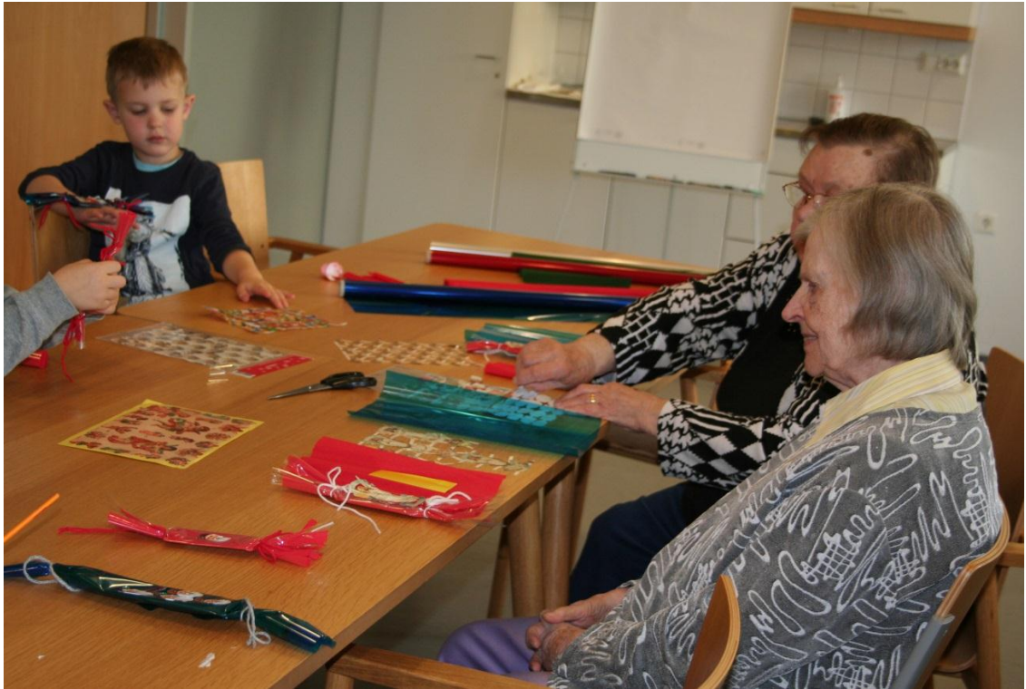
Kuva 3. Karkkikoristeen tekoa.