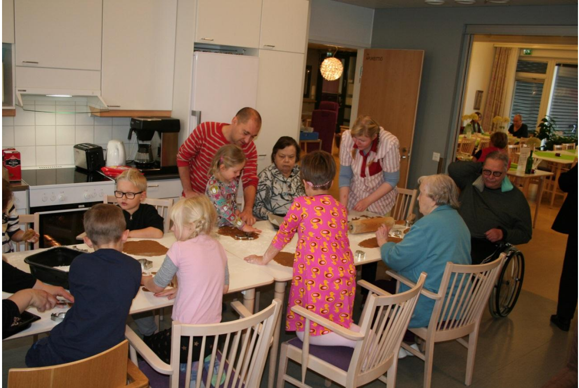
Kuva 8. Pipareiden leipomista.