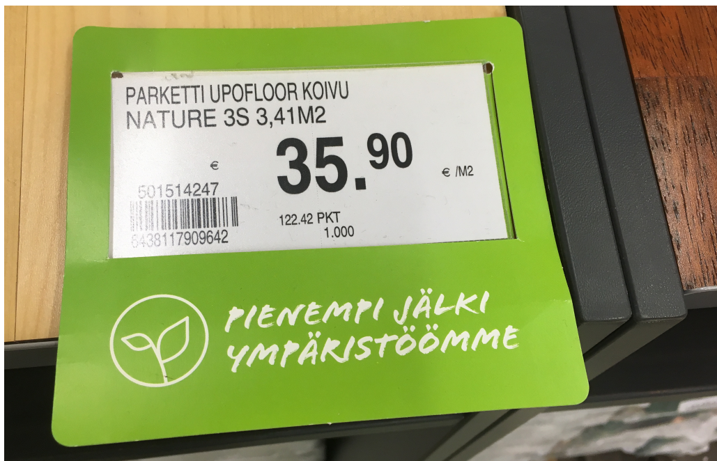
Kuva 4. Ekologisesti vastuullisen tuotteen ostoalintaa helpottava opastin..

Myymälässä on esillä runsaasti hyllyopasteita (Kuva 6.), jotka helpottavat asiakkaan vastuullista ostopäätöstä ja ennen kaikkea antavat tietoa tuotteiden ekologisesta elinkaaresta.