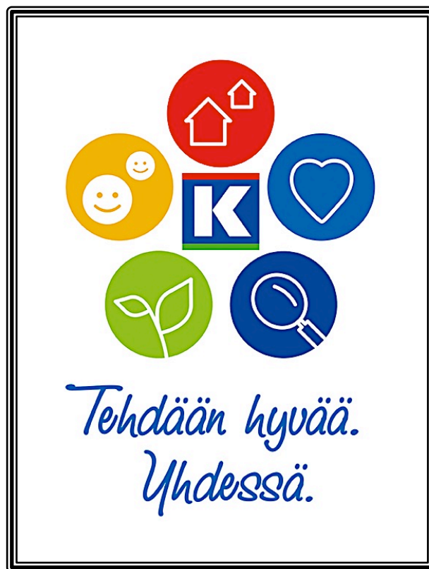
Kuva 2. Vastuullisuuskaupan logo. (Kesko Oyj 2016.)

Vastuullisuuskaupan viisi teemaa ovat: Paikallisessa elämässä mukana, Hyvää asumista, Luotettava valikoima, Pienempi jälki ympäristöömme ja Hyvä työ on sinua varten.