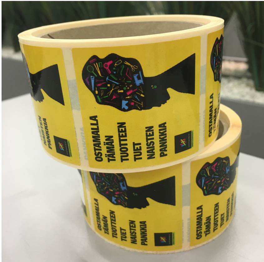
Kuva 7. Naisten Pankki -kampanjan tarrat.

Hyvä esimerkki sosiaalisen vastuun kantamisesta yritystoiminnassa on Rautakeskon Naisten Pankkia tukeva kampanja. Jokaisesta vuoden 2016 aikana ostetusta Cello, joka on Rautakeskon oma tuotemerkki, valaisimesta Kesko lahjoittaa lyhentämättömänä 0,50 euroa Naisten Pankille.