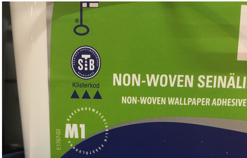
Kuva 5. M1-merkitty seinäliima.

Myös M1-päästöluokkaan, eli pienimpään rakennusmateriaalien päästöluokkaan, kuuluvien tuotteiden opasteita löytyy ympäri myymälää (Kuvat 5 & 6). Rakennusmateriaalien päästöjen pienentäminen edistää niin ekologista kuin sosiaalista ja terveydellistä kestävyyttä.