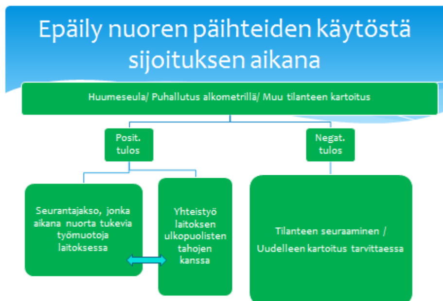
Kuvio 3. Epäily nuoren päihteidenkäytöstä sijoituksen aikana

Nuoren päihteidenkäyttöä voidaan selvittää myös jotain kartoitusta tai kyselyä hyväksi käyttäen. Tällöin nuoren tilannetta hahmotetaan enemmänkin kokonaisuudessaan eikä kyseessä ole akuutti päihtymystila. Esimerkkinä tällaisesta mittarista on Nuorten päihdemittari (Adsume), jonka avulla voidaan arvioida nuoren päihteidenkäyttöä (Terveyden ja hyvinvoinnin laitos 2016c).