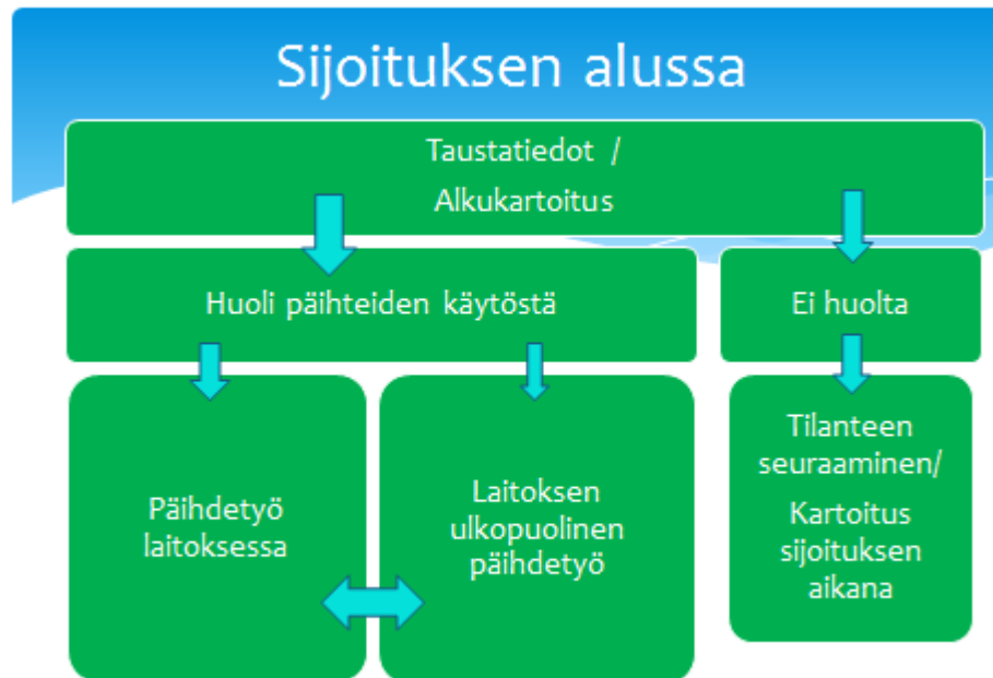
Kuvio 2. Sijoituksen alussa tapahtuva tilanteen kartoitus ja päihdetyö

Nuoren päihteidenkäytöstä noussut huoli on hyvä tuoda heti sijoituksen alussa selkeästi esille myös nuoren sosiaalityöntekijälle ja nuoren huoltajille. Tilanteen auki puhuminen ja kaikille osapuolille selväksi tekeminen helpottavat työskentelyä jatkossa. Asia voidaan keskustella esimerkiksi nuoren sijoituksen ensimmäisessä asiakassuunnitelmanneuvottelussa.