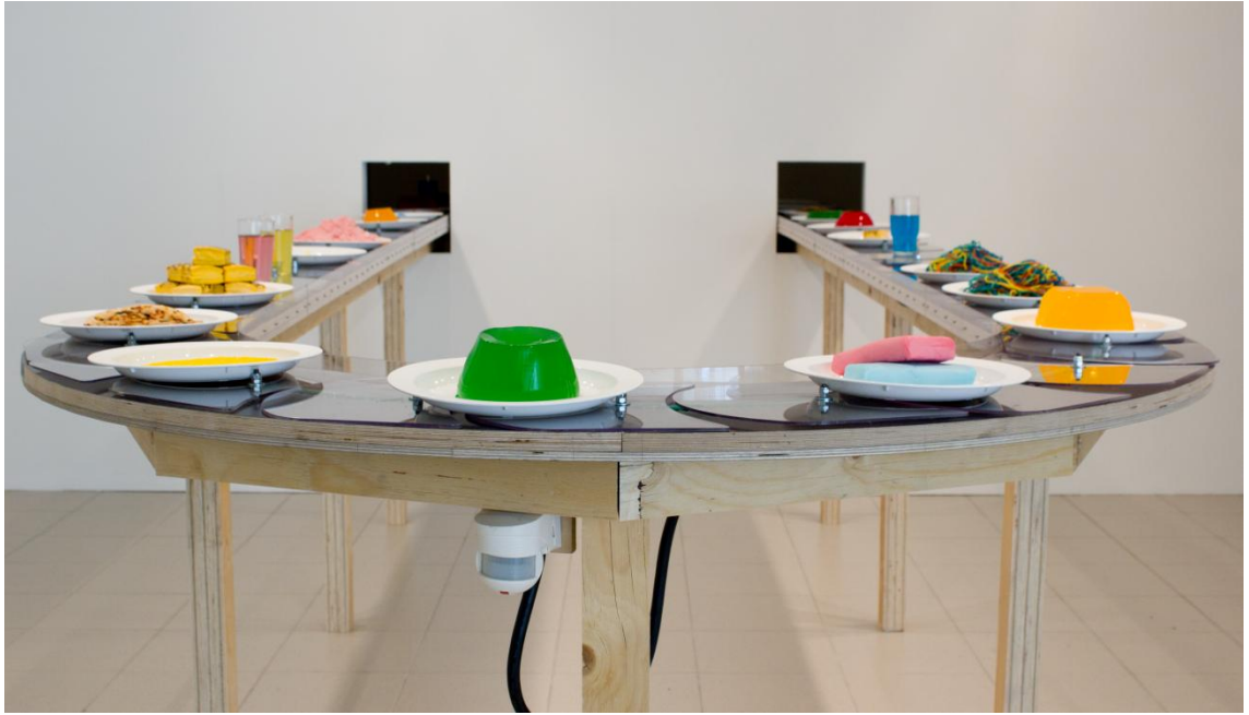
Kuva 4. Installaatio E133 lopputyönäyttelyssä Imatran taidemuseolla