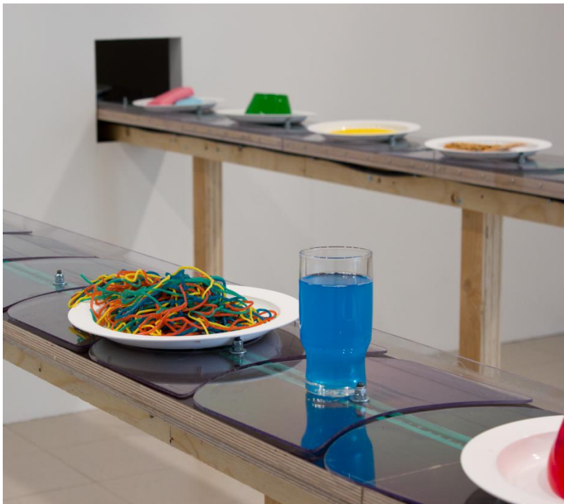
Kuva 3. Yksityiskohta teoksesta E133