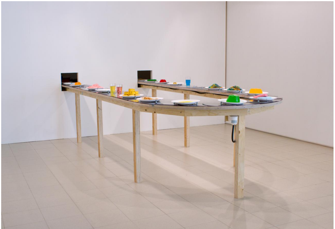
Kuva 5. Installaatio E133 lopputyönäyttelyssä Imatran taidemuseolla, koko: 550 cm x 150 cm x 85 cm