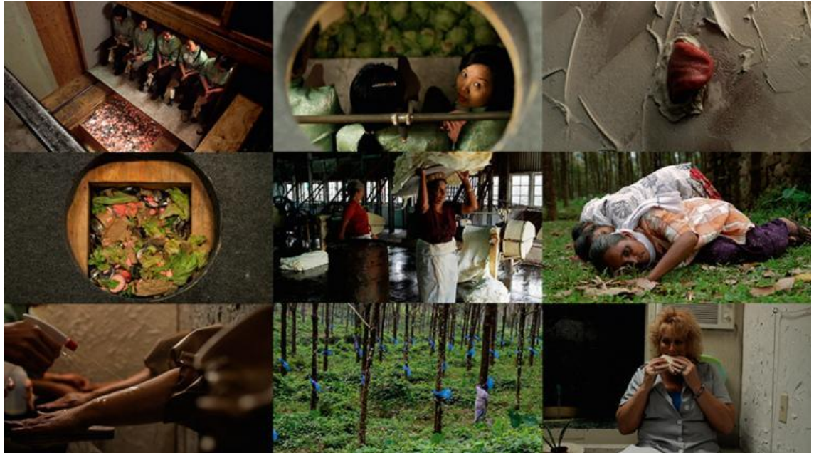
Kuva 9. Still-kuvia Rottenbergin videoteoksesta Squeeze, 2010 (Andrea Rosen Gallery)

Olen usein ihmetellyt omia ja muiden tottumuksia, rutiineja ja sitä, kuinka usein myös kuluttamamme hyödykkeet ovat surrealistisen epätodellisia. Missä vaiheessa ihminen on päätenyt itselleen ja luonnolle vahingolliseen tapaan toimia ja ajattelee sen olevan normaalia? Halusin toteuttaa ruokaan liittyvän teokseni, joka ilmentää juuri tällaista ajatusta todellisuuden kummallisuudesta.