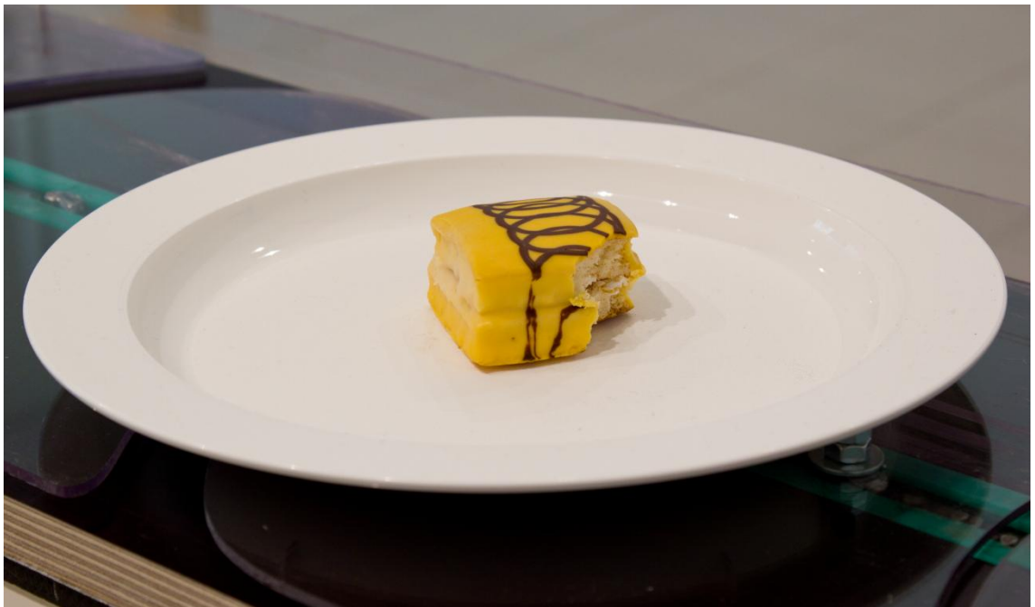
Kuva 1. Yksityiskohta teoksesta E133

Vaikka liukuhihnateokseni syvemmät ajatukset ovat huolestuneen luonnollisuutta arvostavan ihmisen ajatuksia, toin teoksellani esiin myös toisen puolen ravinnosta: syöminen on kivaa. Värikkäät asiat houkuttelevat maistamaan, mikä olisikaan nautinnollisempaa kuin sokerihuurrettu karamelli? Lapset eivät ainakaan tiedä, mikä voisi olla parempaa kuin lauantain esanssinen karkkipäivä. Myös veikeys ja ravintoon liittyvä absurdius ovat läsnä toteutustavassani, joka ilmentää suuhun laittamamme aineen luonnetta.