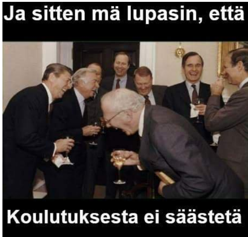
Kuva 7. Esimerkki Internet-meemistä (Huumonen)

Vaikka yksittäisten ihmisten tai heidän sanomistensa pilkkaaminen ei välttämättä johda suurempiin tuloksiin, hieman veikeä asenne ympärillä oleviin ongelmiin mielestäni todistaa niiden loppujen lopuksi olevan ihmisten kokoisia, käsiteltäviä asioita. Siksi olen myös omassa opinnäytetyössäni halunnut poistaa kriittisen taiteen etäännyttävää luonnetta huvittavalla, jopa humoristisella lähestymistavalla. Teokseni visuaalisuus voi aluksi olla ilahduttava ja viedä huomion sanomalta kokonaan. Se ei kuitenkaan välttämättä alenna teoksen vaikuttavuutta, sillä juuri hymyn esiin saaminen katsojassa voi rohkaista häntä käsittelemään asiaa laajemminkin.