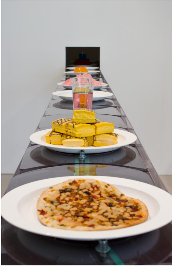
Kuva 2. Yksityiskohta teoksesta E133