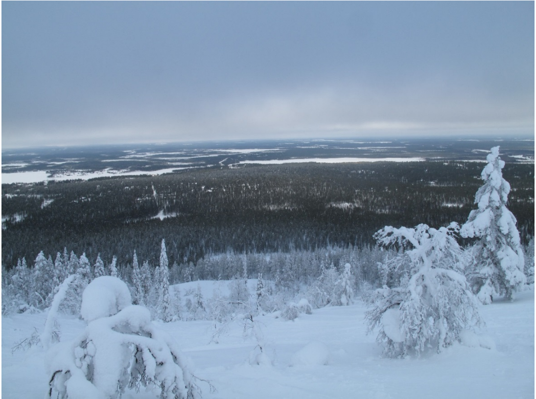
Kuva 2. Levitunturi

(Kuva 2, Kuva 3). Luonto nähdään ja tunnetaan, se on taianomainen ja mystinen sillä on oma vahva luonto, tahto ja henki. Paulaharju osaa kirjoittaa erittäin hienosti ja kirjan avulla pääsee hetkeksi matkaamaan ajassa taaksepäin. Mil-laista oli elää ristimättömänä suuressa erämaassa? (Paulaharju 1939, takakan-si.)