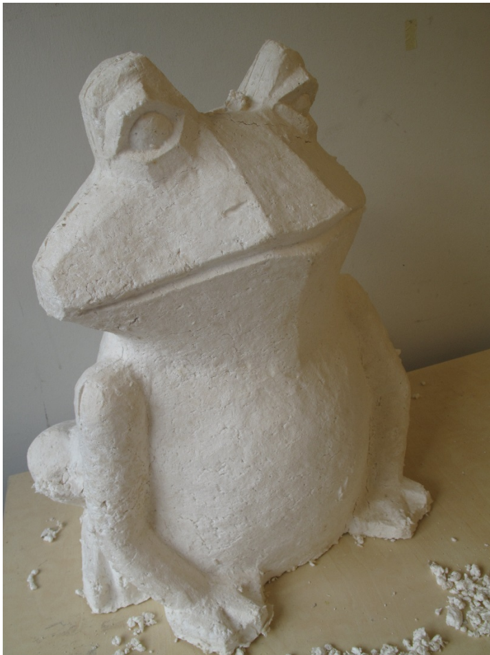
Kuva 9. Valmis paperimassa sammakko