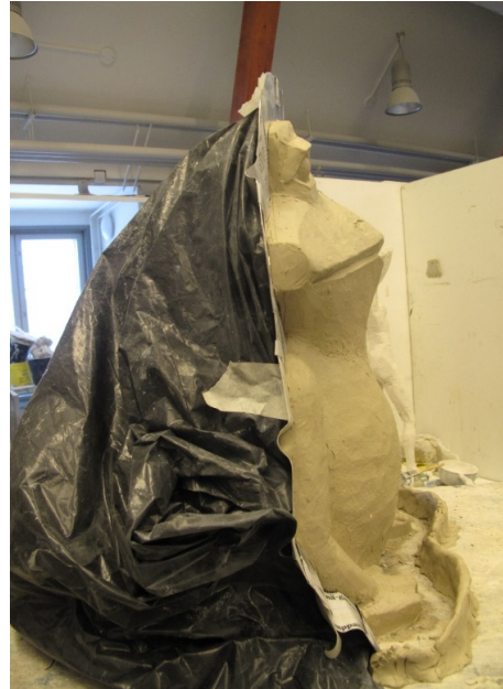
Kuva 6. Muotin valmistus