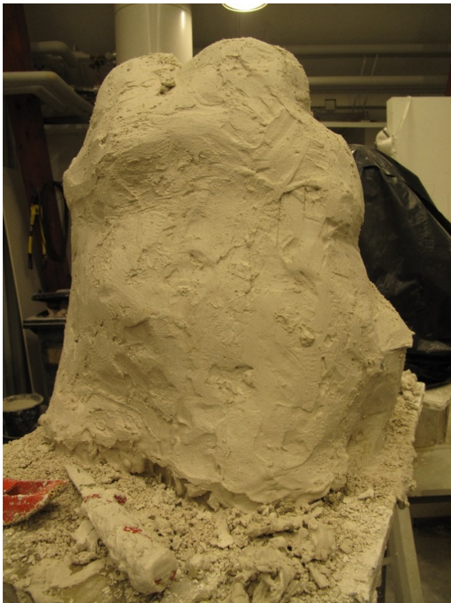
Kuva 7. Valmis muotti