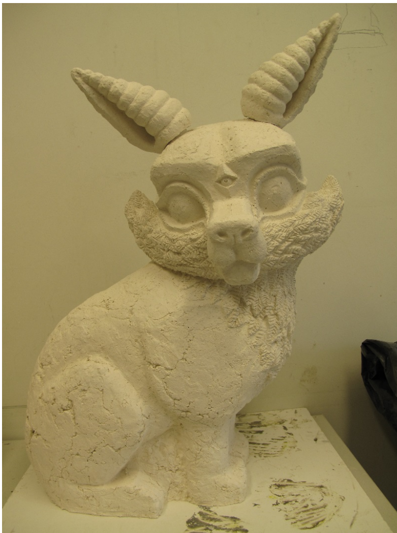
Kuva 13. Valmis paperisavi-henkiovento