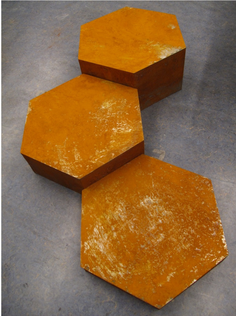
Kuva 14. Valmiita ruostutettuja kuusikulmioita