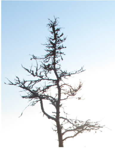
Kuva 3. Haukkavuori