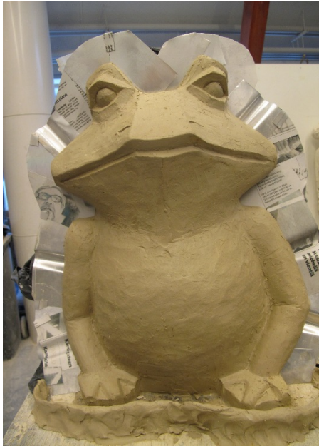
Kuva 5. Muotin valmistus