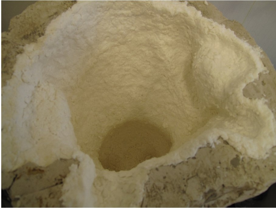
Kuva 8. Paperimassan painaminen muottiin