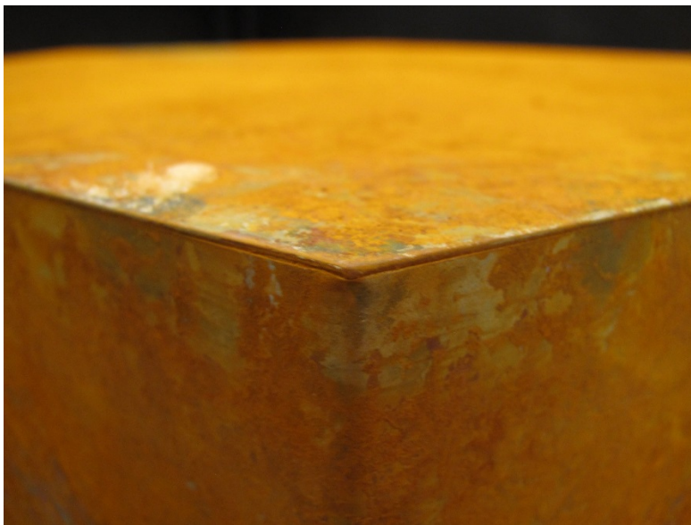
Kuva 15. Kuusikulmio, yksityiskohta