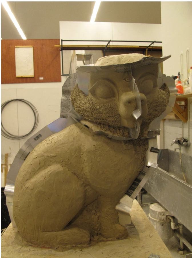
Kuva 10. Muotin valmistus

Henkiolento on savesta tehty, muottiin painamalla (Kuva 10–12). Käytin savena rakusavea mihin lisäsin paperia vähentämään saven määrää ja näin ollen keventämään veistosta (Kuva 13). Halusin materiaaliksi saven, koska se on luonnon oma materiaali. Halusin myös korostaa luontomme, sekä oman luontosuhteenme haurautta jättämällä veistokseen halkeamia.