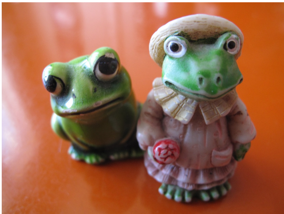
Kuva 1. Tuttisammakot

Olin silloin alle 3-vuotias lapsi, kun muiden lapsien tapaan minunkin oli luovuttava tutista. Jostain syystä olin äärimmäisen kiintynyt tuttiini enkä millään suostunut luopumaan siitä. Äitini keksi kuitenkin ovelan keinon saada tutin minulta: hän vaihtoi tuttini kahteen pieneen posliiniseen sammakkoon (Kuva 1). Rakastuin näihin kahteen sammakkoon välittömästi ja niistä tuli minun rakkaimmat aarteeni. Näitä kahta sammakkoa kutsuin tuttisammakoiksi ja niiden myötä löysin sammakkojen ihmeellisen maailman. Olin suorastaan hulluna sammakkoihin! Minusta tuli mestari sammakon nappaamisessa ja minulta ei jäänyt yksikään sammakko huomaamatta. Piirsin sammakoita, keräsin sammakkoaiheisia tavaroita, pussasin sammakoita ja tarkkailin sammakkojen kehitystä kudusta sammakoksi pihaojassa. Kasvatin itse nuijapäitä ja päästin ne takaisin pihajaan, kun jalat olivat alkaneet kasvaa. Kaikki sammakot olivat mieleeni ja ihmettelin miten paljon erilaisia sammakoita oli.