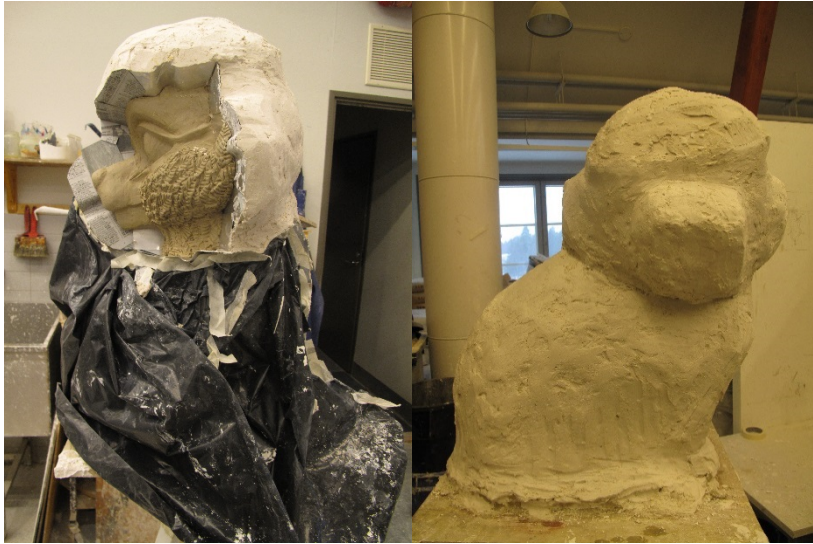
Kuva 11. Muotin valmistus