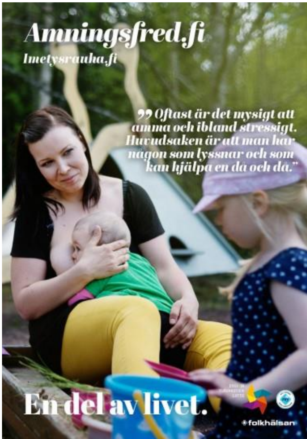
Affisch 3. "En del av livet."