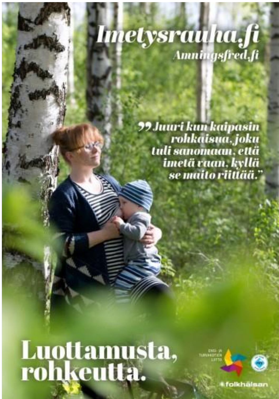
Affisch 1. ”Luottamusta, rohkeutta.”