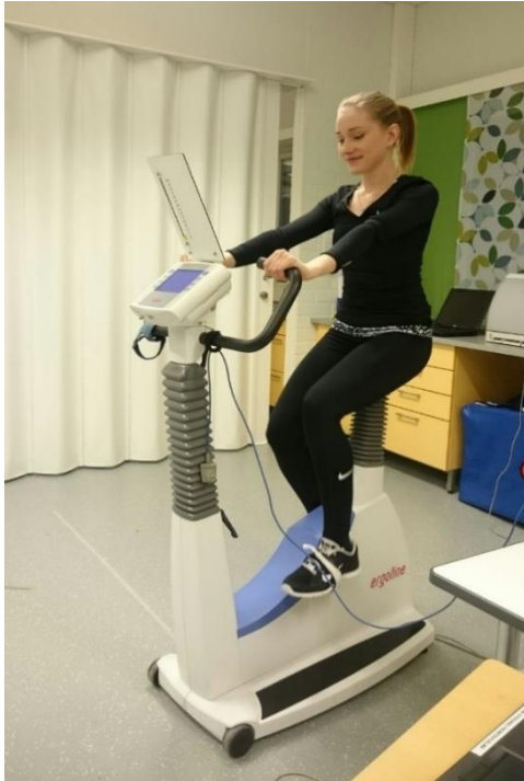
Kuva 1. Harjoitteluympäristö