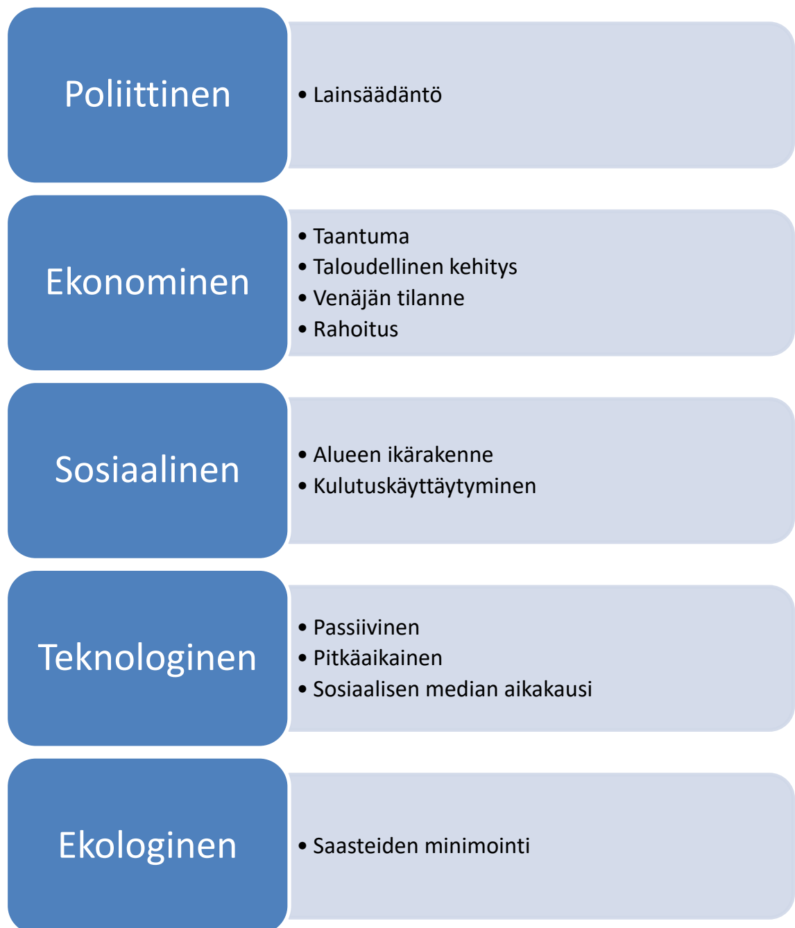
Kuvio 2. PESTE-analyysi

PESTE-analyysi kuuluu myös hyvään toteutettavuusselvitykseen. Alla on kuvio, joka nostaa opinnäytetyötä käsittelevään asiaan liittyen tärkeitä seikkoja, joita tulee pohtia toteutuksen kannalta. Kuvion alla avataan sekä analysoidaan laajemmin kuvion esille nostamia kohtia.