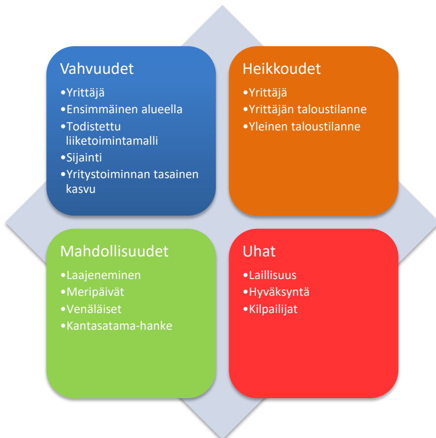
Kuvio 1. SWOT-analyysi

Hyvän liiketoimintamallin toteutettavuuden selvittämiseen kuuluu nelikenttäanalyysin suorittaminen. Nelikenttäanalyysin suorittaminen oikein antaa erittäin hyvän kokonaiskuvan projektia koskevista seikoista, jotka tulee ottaa huomioon. Kyseisen analyysin kuvio löytyy alta sekä siihen liittyvä kohtien analysointi kuvan alta.