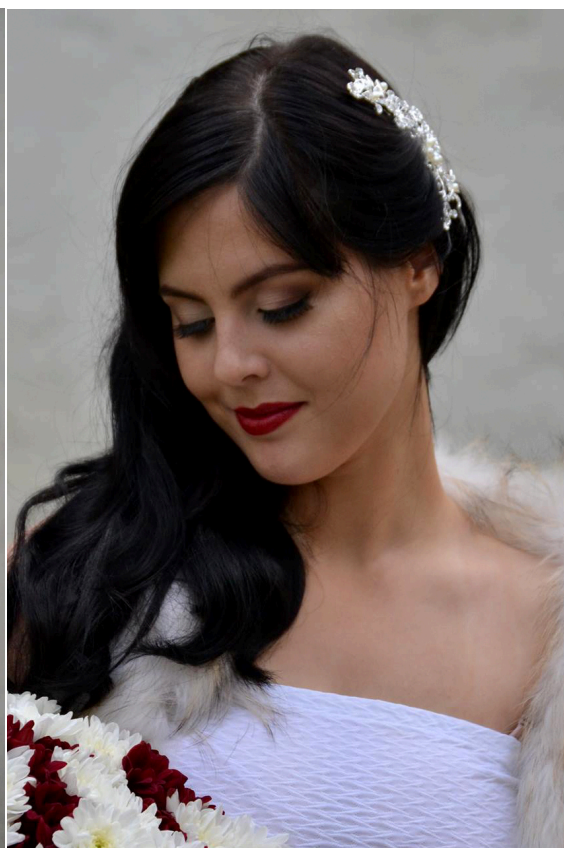
Figur 6 Vinterkyla

På bilden ser vi en kvinna med svart hår som står vid en vit stenvägg. Modellen är fotad i centralperspektiv. Hon har en vit ögonskugga på de inre delarna av ögat och en ljusbrun ögonskugga mot de yttre delarna av ögat. I globlinjen har hon en blandning av en brun ögonskugga men även en mörklila ögonskugga. Vid den allra yttersta delen av ögat har hon en mörkbrun ögonskugga som är nästan svart. Hon har även en svart eyeliner vid den övre franskanten. Under nedre franskanten har hon en ljusbrun ögonskugga. Hennes läppar är ifyllda med röd läppenna och mörkrött läppstift. Hennes ögonbryn är ifyllda med en mörkbrun brynskugga och en mörkbrun brynpenna. Hon har en rätt dramatisk skuggning under kindbenen, vid käkbenen och vid tinningarna. Ririnui, et Al., (2013) och Kidd (2009) nämner att skuggning bör appliceras på de ställen man vill ge en naturlig skugga och som ska "sjunka in". Modellens rouge är naturlig i en svag beige rosa nyans. Highlighten är applicerad på några av ansiktets högsta punkter, alltså på kindbenen och näsbenet.