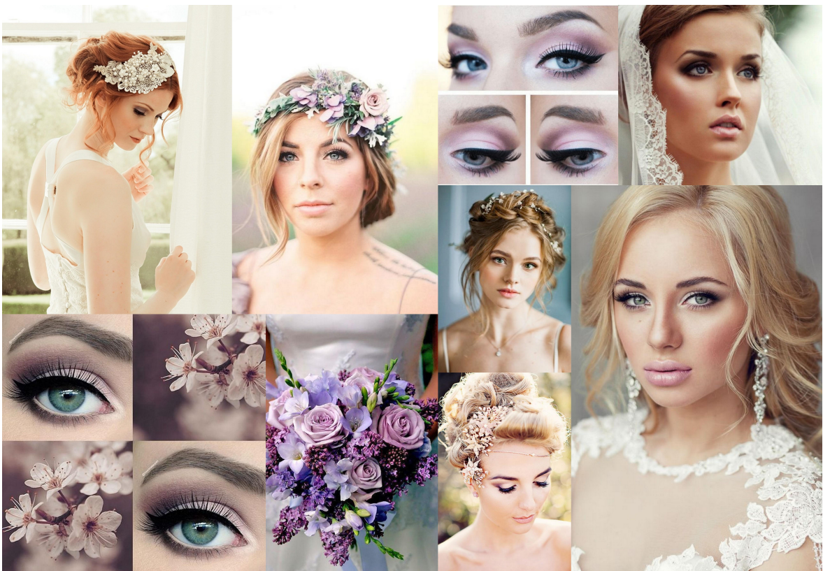
Bilaga 4 Vår