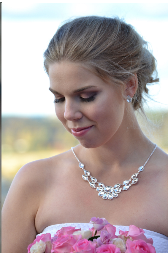
Figur 8 Vårvind

På bilden ser vi en kvinna med mörkblont hår i uppsättning som står vid en stenport och vid ett vårlandskap. Modellen är fotad i centralperspektiv. Sminkningen är lätt och inte allt för dramatisk. Keiko, Hitomi och Hiroshi (2016) nämner i sin forskning att kvinnor med lätt sminkning är att föredra framför kvinnor med tung sminkning. På bilden ser vi att modellen har ljusrosa ögonskugga på ögonlocket och flera nyanser av lila i globlinjen. Hon har även en ljusbrun skugga i globlinjen, så den lila ögonskuggans kant är inte skarp. Vid övre franskanten har hon mörklila ögonskugga istället för eyeliner. Söderberg och Wigur (2006) rekommenderar användning av en mjuk penna eller ögonskugga vid franskanten istället för eyeliner om man vill ha ett mjukare resultat. På bilden syns även att hon har en ljuslila ögonskugga under den nedre franskanten. Läpparna har blivit ifyllda med en rosa läppenna och ett ljusrosa läppstift. Brynen är naturligt ifyllda med en brynskugga i en blond färg och ett ögonbrynsgel i samma färg. Söderberg & Wigur (2006) och Sofia (2006) nämner att det är viktigt att fylla i ögonbrynen eftersom det ramar in hela ögat. Man kan