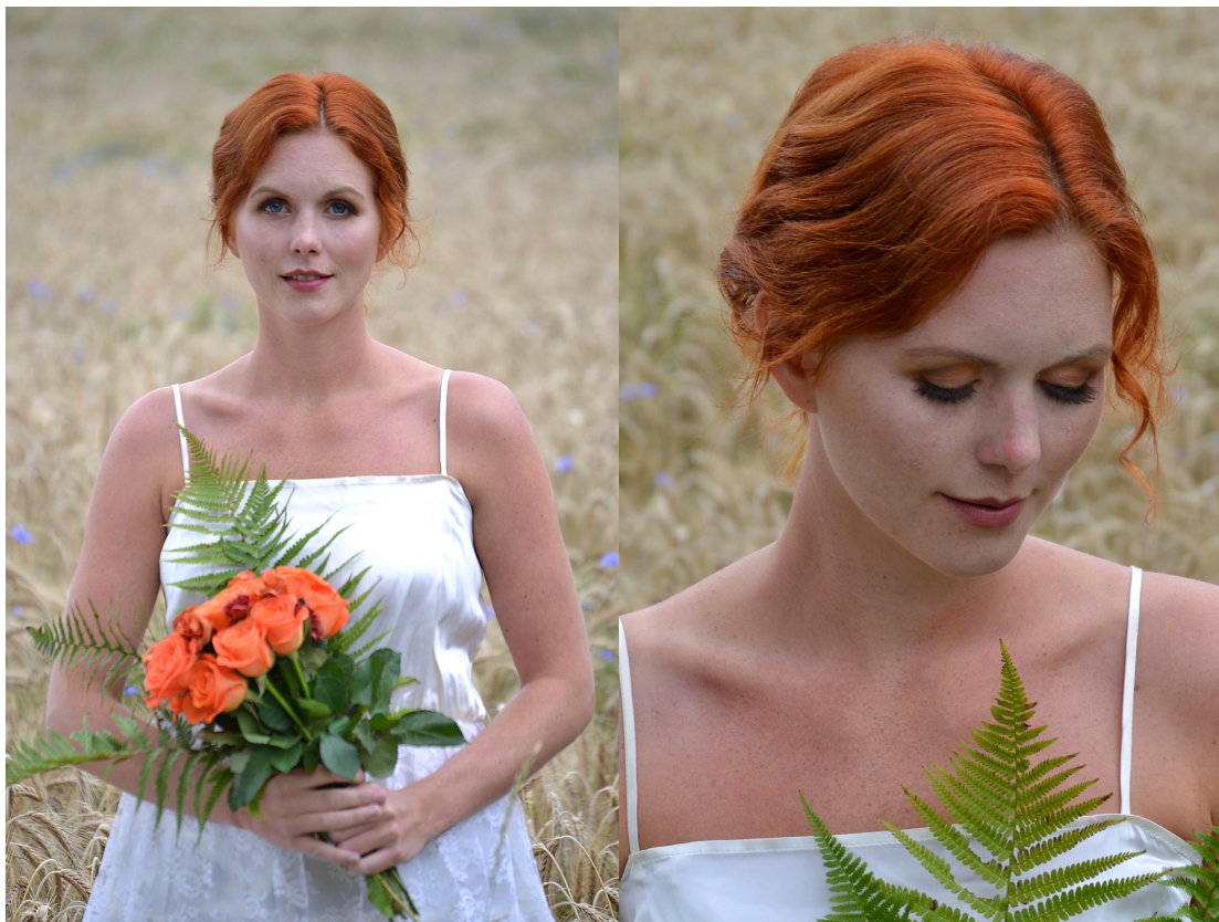
Figur 3 Varma färger