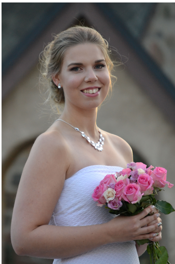
Figur 7 Lätt och ljusst