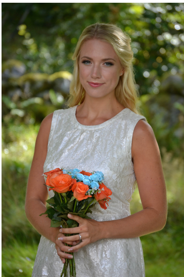
Figur 1 Färglick