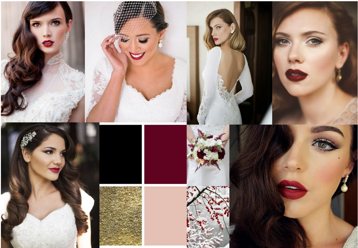
Bilaga 3 Vinter