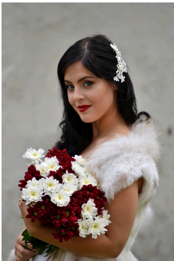
Figur 5 Dramatiskt