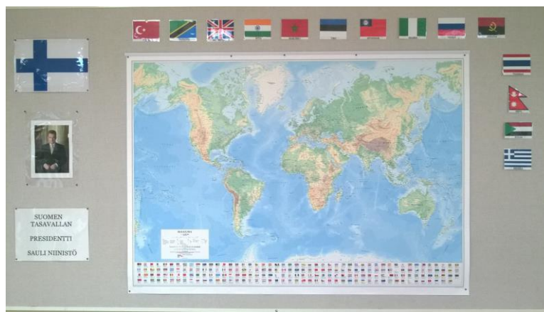
Kuva 1. Eri kansallisuudet Velhon päiväkodissa syksyllä 2014

Huomasin ihmisten olevan hiukan arkoja kertomaan kulttuuristaan, joten päätin, että teemme kertomiskierroksen järjestyksessä. Rohkeimmat aloittivat ja sitten etenimme järjestyksessä. Lopulta vanhemmat kertoivat innostuneesti omasta kulttuuristaan ja siinä olevista heille merkityksellisistä asioista sekä kulttuuriensa erityispiirteistä. Keskustelujen lomassa kirjasin ylös kerrottuja asioita muistin tueksi ja raportointia varten. Keskusteluissa kävi ilmi, että uskonto on tärkeässä roolissa monissa kulttuureissa sekä vanhemman ihmisen kunnioittaminen. Perhe koettiin myös tärkeäksi sekä vaatetuksen merkitys tapaamisissa esimerkiksi Intiassa ja Afrikan eri kulttuureissa.