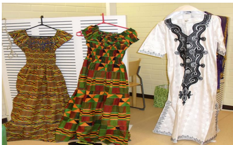
Kuva 3. Perinneasuja

Aloitimme tapahtuman minun toivottaessani kaikki paikalla olevat tervetulleiksi. Esittelin itseni ja kerroin paikalla oleville ihmisille tilaisuuden olevan osa opintoihini liittyvää opinnäytetyötä. Tämän jälkeen esittelin poikani ja kerroin hänen tulleen avustamaan minua tilaisuudessa tarvittavan tekniikan kanssa. Vanhemmat esittelivät itsensä ja ruokansa. Ajoittain lasten iloinen leikkisyys häiritsi vanhempien esittelyä, heidän kertoessaan paikoitellen heikolla suomenkielen taidolla ruuistansa, joten ryhdyin heitä auttamaan ja tulkitsin heidän kertomaansa sekä toistin heidän sanomia asioita, jotta he tulivat ymmärretyksi ja kuulluksi asiassaan.