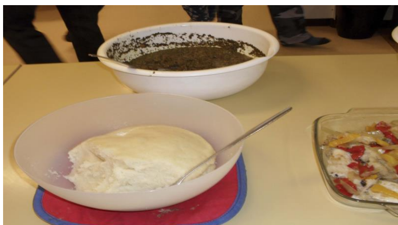
Kuva 2. Perinteinen afrikkalainen ruoka, maniokki

Järjestävistä vanhemmista ensimmäisenä saapui paikalle melkein kanssani samaan aikaan kongolainen äiti, joka toi tilaisuuteen maniokkia, joka on perinteinen afrikkalainen ruoka sekä afrikkalaisista sienistä tehtyä ruokaa, joka oli tehty keskiafrikkalaiseen tyyliin (kuva 2). Sienet oli ostettu Helsingistä, missä ulkomaalaiset käyvät paljon ruokaostoksilla, siellä olevan kattavamman valikoiman takia. Hänellä oli mukana myös afrikkalaiseen tapaan suolattua kalaa (kuva 2), ja hän oli pukeutunut kongolaiseen perinneasusteeseen. Hänen kerroessaan ruuistansa ja siitä, miten niitä valmistetaan, tuli minulle ideana, että kaikki vanhemmat kertoisivat jotakin ruuistansa ja saisimme siten tilaisuuden yhteisesti alkamaan ja näin teimmekin.