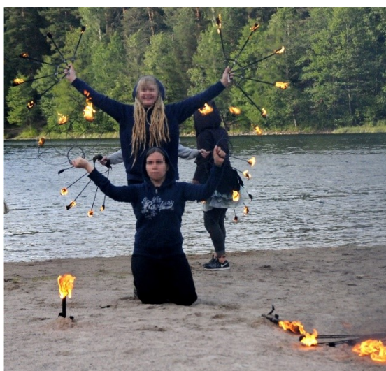
Kuva 9. Performanssiesityksen harjoittelua tulen kanssa.

Työpajan ohjaaja sytytti tulitaidvälineet tuleen ja jakoi välineet osallistujien käsiin. Taustalle laitettiin soimaan musiikkia ja ideana oli nopeasti koota videolle kuvattava performanssiesitys taustalla soivaa musiikkia mukaillen. Työpajan ohjaaja suunnitteli yksinkertaisen tuliviuhkojen käyttöön soveltuvan performanssin, jota toistettiin ja harjoiteltiin muutaman kerran illan aikana (Kuva 9). Performanssiesitys harjoitteluineen tallennettiin videolle.