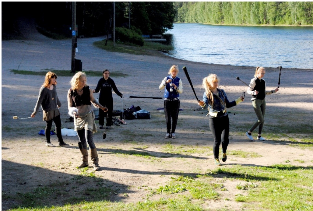
Kuva 8. Aluksi harjoiteltiin pain pyöritysliikkeitä ilman tulta.

Työpajan ohjaaja sytytti tulitaidvälineet tuleen ja jakoi välineet osallistujien käsiin. Taustalle laitettiin soimaan musiikkia ja ideana oli nopeasti koota videolle kuvattava performanssiesitys taustalla soivaa musiikkia mukaillen. Työpajan ohjaaja suunnitteli yksinkertaisen tuliviuhkojen käyttöön soveltuvan performanssin, jota toistettiin ja harjoiteltiin muutaman kerran illan aikana (Kuva 9). Performanssiesitys harjoitteluineen tallennettiin videolle.