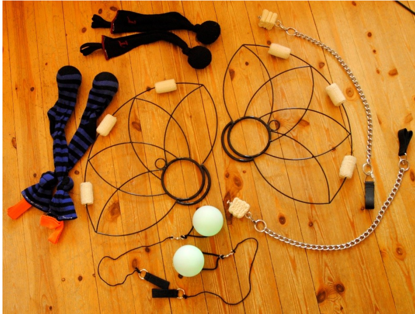
Kuva 1. Esimerkkejä tulitaiteessa käytetyistä välineistä: Sukista tehdyt harjoituspoit, tuliviuhkat, tulipoit ja ledipoit.

Tulitaiteessa käytettäviä välineitä on tullut lisää ja niitä kehitellään edelleen. Nykyisin pöin lisäksi suosittuja tulitaidevälineitä ovat kepit, soihdut, viuhkat (kuva 1.) ja vanteet. Välineitä valmistetaan yleisemmin teräksestä tai alumiinista ja välineiden tulipäinä käytetään luotiliiveistäkin tuttua kevlar-kangasta (Järvinen 2016).