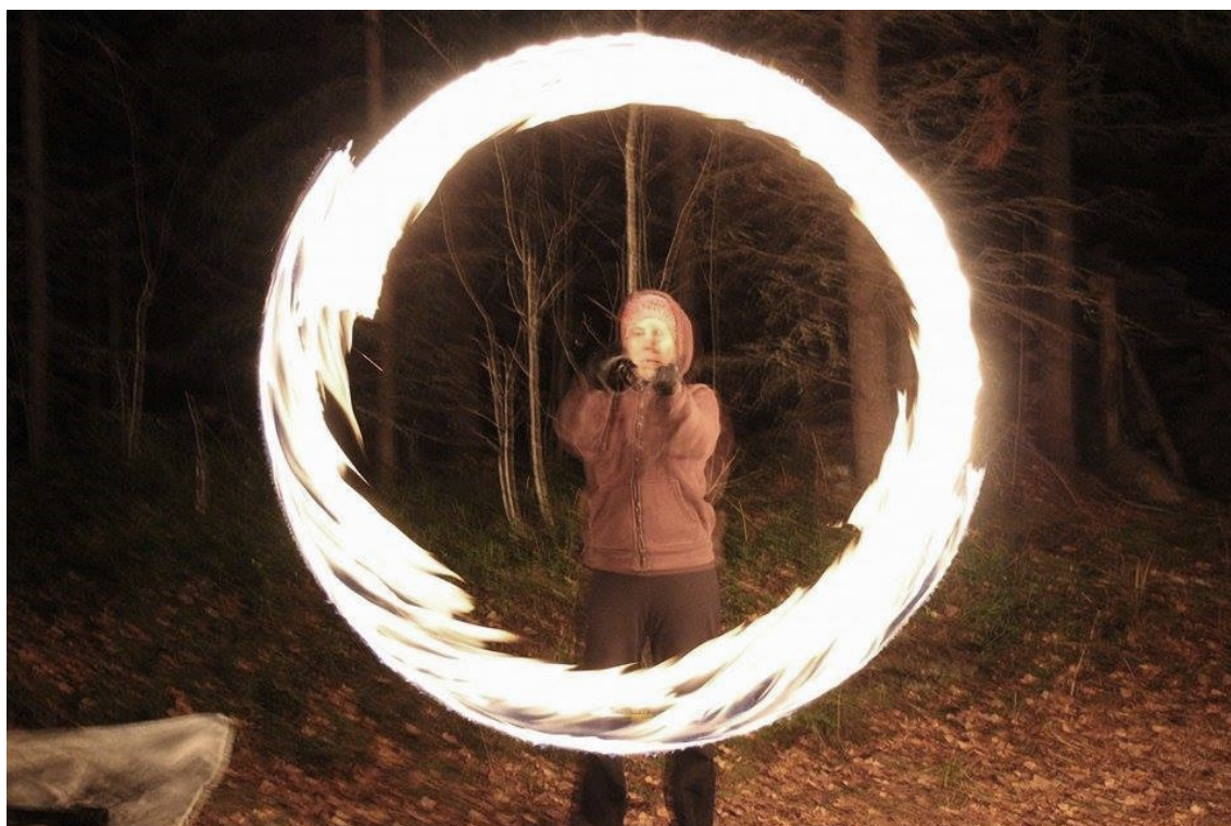
Kuva 13. Pauninmaan pimeätapahtuma.

Tulitaiteen harrastajaryhmän perustamisen sijaan jatkan tulitaiteen harjoittelua TulenTaittajien kanssa. Tarkoituksena on taitojen karttuessa myös tarjota tulitaide-esiintymisiä erilaisiin tapahtumiin ja tilaisuuksiin. Ensimmäinen tulitaide esiintymiseni tapahtui lokakuussa 2016 järjestetyssä Pauninmaan pimeätapahtumassa. (Kuva 10.) Esiinnyimme siellä TulenTaittajien ja muiden tulitaiteilijoiden kanssa vuorotellen. (kuva 11.)