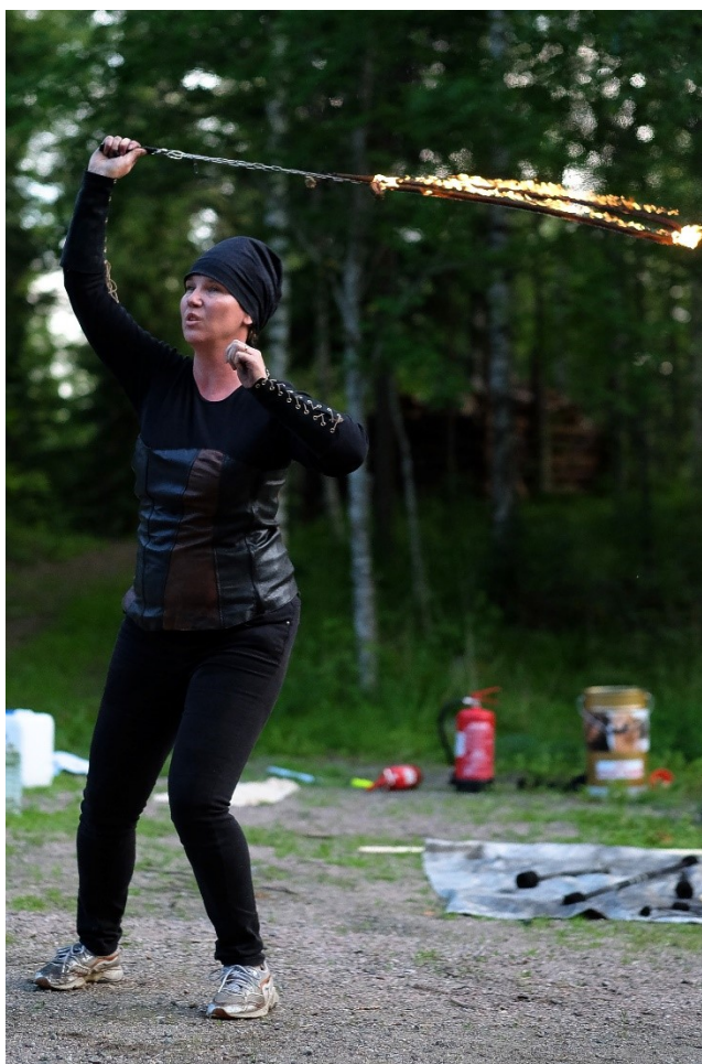
Kuva 12. Työpajanohjaaja tarjosi tapahtuman loppuhuipennuksena esi-tyksen tulihiippynarun kanssa.