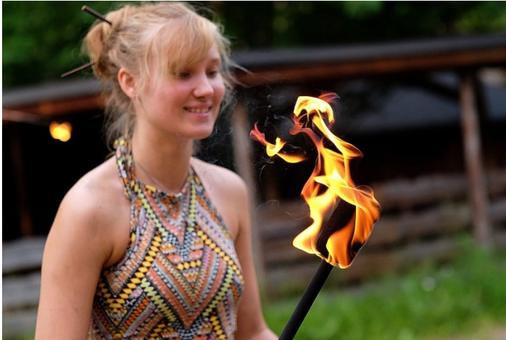
Kuva 3. Tulitaiteessa käytettävä tuli on käytännössä avotulta, ja avotulen sytyttäminen tapahtuu aina maanomistajan luvalla.

Ilmoitusta poliisille ei tarvitse kuitenkaan tehdä sellaisesta yleisötilaisuudesta, joka osanottajien vähäisen määrän, tilaisuuden luonteen tai järjestämispaikan vuoksi ei edellytä toimenpiteitä järjestyksen ja turvallisuuden ylläpitämiseksi tai sivullisille ja ympäristölle aiheutuvan haitan estämiseksi taikka erityisiä liikennejärjestelyjä (Kokoontumislaki 3 luku 14 §.)