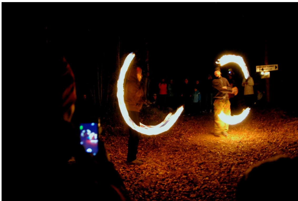
Kuva 14. Pimeätapahtuma Pauninmaalla.