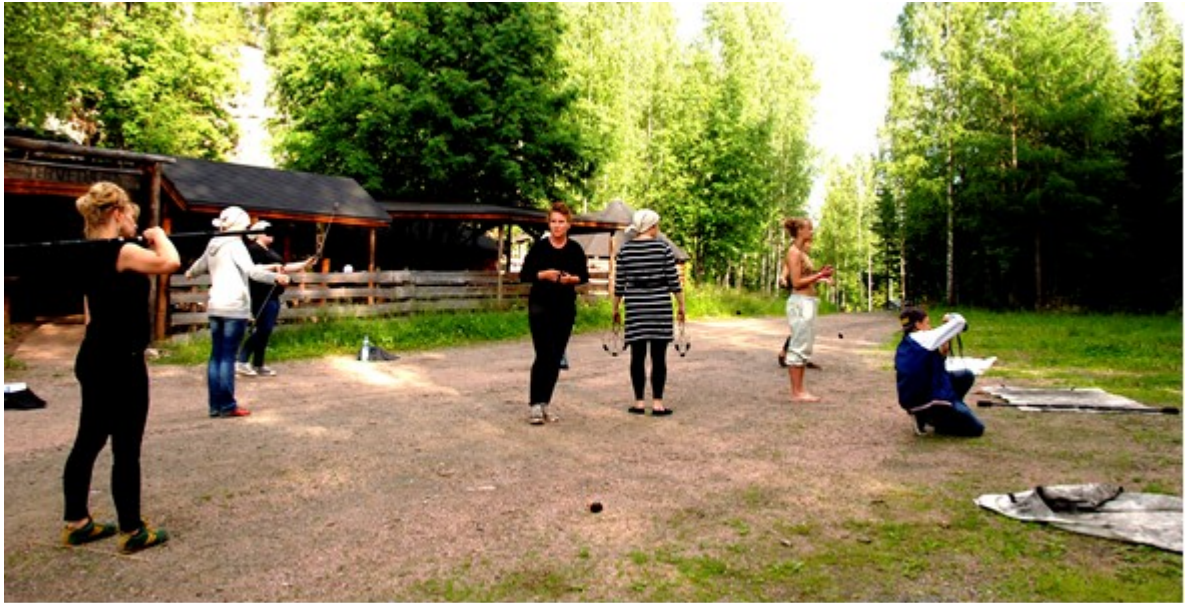
Kuva 5. Pauninmaan parkkipaikalla oli hyvin tilaa harjoitella.