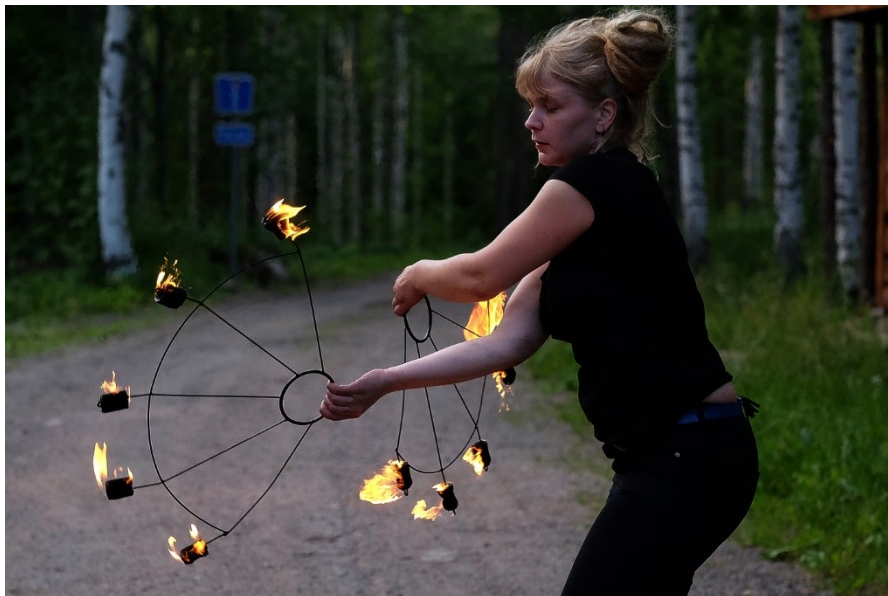
Kuva 11. Tulitaidevälineiden harjoittelua omaan tahtiin.