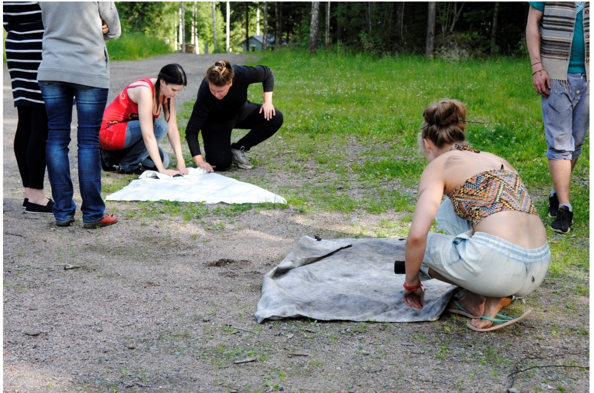
Kuva 4. Työpajassa harjoiteltiin tulensamuttamista sammutuspeitteiden avulla.