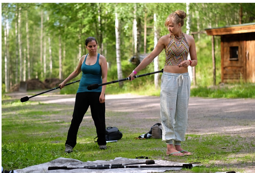
Kuva 10. Kontaktikepin harjoittelua ilman tulta.

Työpajan toiminnallinen osuus alkoi tulitaiteessa käytettävän kontaktikepin pyörysharjoituksilla ilman tulta (Kuva 10). Kontaktikepin pyöryksestä opetettiin kokonaisuudessaan vain yksi liike neljään osaan jaettuna. Liike oli haastava, joten sen oppiminen vei aikaa ja oli aivan riittävä harjoite työpajaan, jossa oli mukana tulitaidetta ensikertaa harjoittelevia osallistujia.