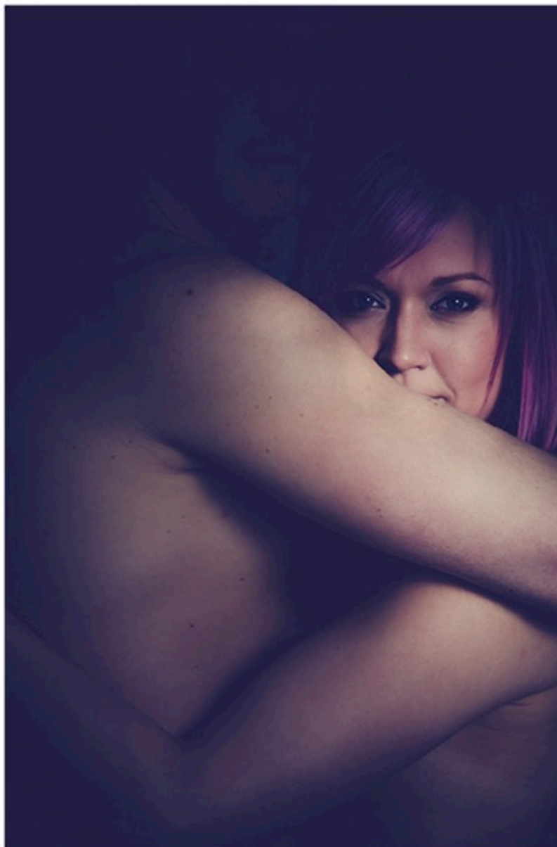
Kuva 5. Minä valitsin sinut

Syvähaastateltavien mielestä kuvasta löytyy paljon eri ulottuvuuksia. Kuvaa pidettiin onnistuneena. Oikeat kohdat pääroolissa, naisessa kiehtovaa voimaa, kuva ei menetä mielenkiintoa, vaikka lähtee pois siitä ajatuksesta mikä ensimmäisenä kosketti. Kuvan nimi aiheutti keskustelua. Kumman repliikki tuo on? Voiko ketään valita? En silti näe, että nimeäminen olisi vaikuttanut tulkintaan kuvasta huomattavasti.