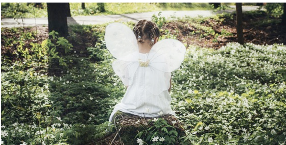
Kuva 4. Mielikuvitusmetsä

Mielikuvitus sanana, toi monelle mieleen värikkään maailman, jossa on sarjakuvahahmoja. Kuva ei sinänsä kohtaa mielikuvitusmaailmaa. Oma ajatukseni oli, että tytön pään sisällä on meneillään mielikuvitusleikki. Tämä nimi ja kuva koettiin osittain ristiriitaiseksi. Kuvassa oleva varjo mainittiin kerran. Tyttö on vielä valon puolella, mutta varjo luo kuvaan negatiivisen sävyn. Tässä kuvassa koettiin assosiaatioita omaan lapsuuteen, jossa pieni sisäinen tyttö heräsi.