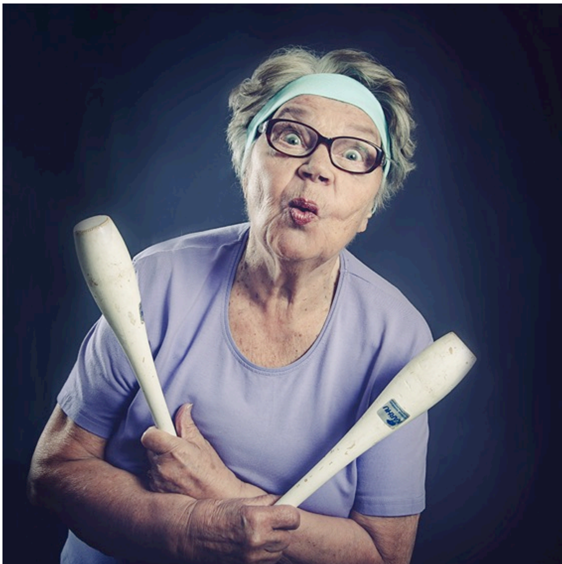
Kuva 6. Eheys

Kulttuurisia merkityksiä löytyi mm. voimistelukeilojen kautta. Naisvoimistelu ja rytmisen liikunta on osa suomalaisuutta. Yleisilme, vaatetus ja sinivalkoinen väritys miellettiin suomalaisiksi. Mieleen tulivat suomalaiset vanhainkodit, kirjoittelut vanhuksien huonovointisuudesta ja yksinäisyydestä. Niitä ei tässä kuvassa näy.