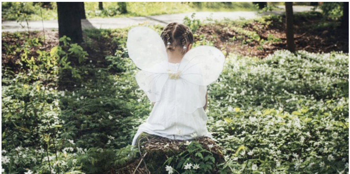
Kuva 2. Mielikuvitusmetsä.

Kuvateksti ankkuroi kuvan merkitykset paikalleen, kertoo Roland Barthes (1915-1980). Kuvallisuus siis loimittuu muihin koodeihin, niiden vuoksi tapahtuvaan kokemukseen maailmasta, aisteihin, mielikuviiin, tunteisiin ja psyykkiseen tilaan (Seppänen 2001, 40).