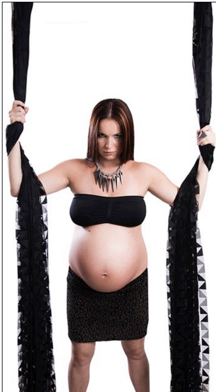
Kuva 3. Onni?

Kun ihmisiä kuvataan vuorovaikutteisesti, vaikuttavat kuvaajan ohjeet ja persoonallisuus kuvaustilanteeseen. Henkilökuvauksessa vaatii kuvaajalta hyviä vuorovaikutustaitoja ja kykyä hahmottaa toisen ihmisen persoonallisuuden ydin. Henkilökuvissa mallit viestivät jotain itsestään. Kun tuotetaan performatiivisia henkilökuvia mallilla voi olla enemmän valtaa kuvan syntyyn. (Pienimäki 2013, 114-115.) Suurimmassa osassa kuvista mallit saivatkin vaikuttaa kuvan syntyyn, mutta tässä Onni? -teoksessa määrittelin melko tarkkaan, kuinka halusin mallin toimivan.