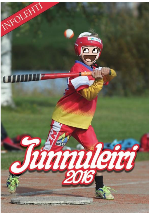
KUVA 8. Ensimmäinen vedos.

Alusta asti kannessa haluttiin nähdä pesäpalloilija, sekä kannesta haluttiin saada enemmän piirrosmainen kuin realistinen. Viime vuosina järjestetyiltä leireiltä otetuista valokuvista saatiin käyttöön materiaalia, joita hyödynnettiin kannessa. Pelaajan piirtäminen käsin vektorigrafiikalla olisi vaatinut useita työtunteja, joten päätettiin tehdä kuvan jäljennös vektoriksi, joka nopeutti työtä huomattavasti, mutta aiheutti lisää ongelmia. Ensinnäkin kasvot eivät olleet enää miellyttävät ja niitä ei saanut automatisoidun toiminnon avulla järkeviksi. Kuva päätettiin viedä Photoshop-ohjelman kautta kanteen siten, että kasvot hiottiin sileiksi ja siihen lisättiin internet meemeistä tuttu hymiö. Tämä ei toiminut, sillä kantta ei voitu ottaa vakavasti ja näin tämä vedos joutui roskakoriin. Kyseessä olevien vedosten yksinkertaisuus ja rumuus heijastivat amatöörimaisuutta, joten niistä luovuttiin (KUVA 8). Samaan vedokseen kuitenkin tehtiin erilaisia kokeiluja, esimerkiksi otsikointia ja miten eri kirjasimet toimisivat kannessa (KUVA 9).