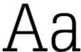
KUVA 5. Egyptienne kirjasintyyppi. Fontti Typo Slab Serif.

Egyptienne kirjasintyypeissä yhdistyy antiikvan ja groteskin kirjasintyyppien piirteet. Kirjaimissa on päätteet ja kirjaimet ovat yhtä paksuja (KUVA 5).