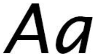
KUVA 4. Groteski kirjasintyyppi. Fontti Lucida Sans.

Groteskit kirjasintyytit ovat pääteettömiä ja eikä kirjaimissa ole paksuuseroja (KUVA 4). Groteskeissa fonteissa on eri vahvuuksia, siksi niillä voi hyvin korostaa tekstin eri osia. Otsikoissa käytetään yleensä pääteetöntä kirjasintyyppiä.