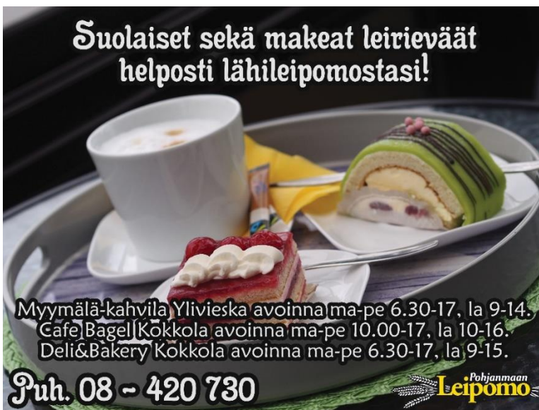
KUVA 17. Pohjanmaan Leipomon mainos.

Pohjanmaan Leipomo toivoi, että heille tehtäisiin uusi mainos lehteen. He antoivat valmiin taustakuvan, liikemerkin sekä tekstit. He halusivat mainokseen aukioloajat, puhelinnumeron, mainoslauseen sekä liikemerkin (KUVA 17).