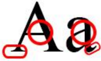
KUVA 3. Antiikva kirjasintyyppi, kirjainten eri osien paksuuserot. Fontti Times New Roman.

Groteskit kirjasintyytit ovat pääteettömiä ja eikä kirjaimissa ole paksuuseroja (KUVA 4). Groteskeissa fonteissa on eri vahvuuksia, siksi niillä voi hyvin korostaa tekstin eri osia. Otsikoissa käytetään yleensä pääteetöntä kirjasintyyppiä.