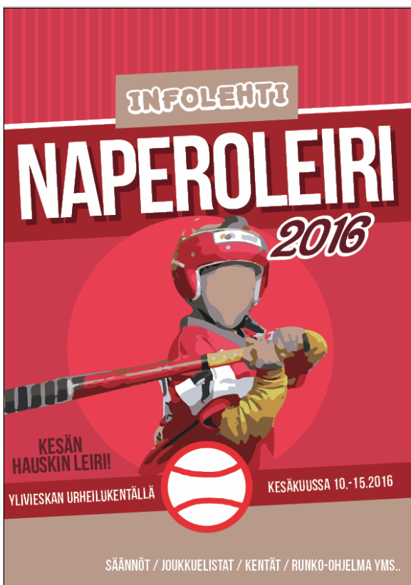
KUVA 10. Piirrosmainen pelaaja, uusi tausta.

Uudenlaista kantta lähdettiin hakemaan uudesta kuvasta. Arkistoista löytyi sopiva kuva, jossa lähikuvassa oli nuori poika lyömässä pesäpalloa. Kuvaa päätettiin käyttää kannessa, ja ensimmäiseksi tausta leikattiin pojasta irti kokonaan, jättäen kuvaan pelkän pelaajan. Tämän jälkeen kokeiltiin, miltä kuva näyttää piirrosmaisena. Lopputulos oli lähes sama kuin edeltävässä vedoksessa kasvojen suhteen (KUVA 10), joten päätettiin jättää kasvat ennalleen muun kuvan ollessa piirrosmaisempi. Kuva aseteltiin kanteen ja sen ympärille alettiin rakentaa otsikoita ja elementtejä. Kannen väreinä käytettiin pelaajan vaatetuksesta löytyneitä värejä siten, ettei kyseisen pelaajan joukkue kuitenkaan kävisi ilmi. Lehden nimi asetettiin hieman kallelleen tuomaan vauhdikkuutta (KUVA 11). Sen lisäksi muutamia kirjjasimia vaihdettiin ja viralliset päivämäärät päivitettiin kanteen.