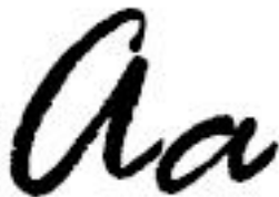
KUVA 7. Kalligrafinen kirjasintyyppi. Fontti Rage Italic.

Kalligrafiset kirjasintyypit ovat niin sanotusti käsi tehtyä kaunokirjoitusta (KUVA 7).