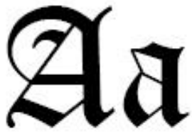
KUVA 6. Fraktuura kirjasin tyyppi. Fontti Old English Text.

Kalligrafiset kirjasintyypit ovat niin sanotusti käsi tehtyä kaunokirjoitusta (KUVA 7).