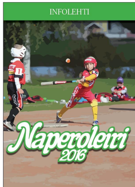
KUVA 9. Toinen vedos.