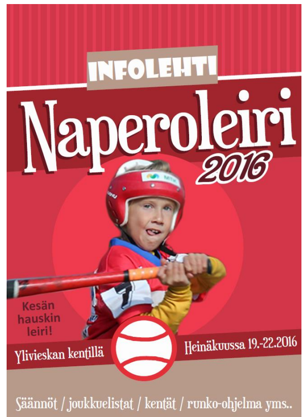
KUVA 11. Lopullinen versio.

Aukeamasuunnittelussa haluttiin säilyttää yksinkertaisuus siten, että teksti olisi mustalla valkoisella taustalla. Tekstiä oli paljon, ja sisällön tärkeyden takia tekstiä ei voitu korvata kuvilla joista olisi välitynyt sanoma. Leipätekstin kappaleet olivat lyhyitä, joten niissä käytettiin päätteetöntä fonttia, jotta luettavuus olisi helppoa. Sivulla neljä palstoitusta käytettiin siten, että teksti jaettiin kahdelle palstalle. Näin tekstit saatiin sovitettua kuvan kanssa yhdelle sivulle. Muutoin palstoitusta ei käytetty muilla sivuilla tai aukeamilla. Kokeilun kautta selvisi, että sivumäärä tuplaantui ja tekstin lukeminen vaikeutui