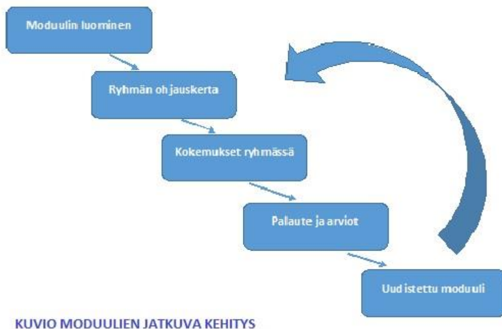
KUVIO 3. Moduulien jatkuva kehitys

Ryhmän ohjauskerran jälkeen on aina kerättävä palaute ja arvioitava myös itse omaa toimintaa. Näiden saatujen tietojen pohjalta on kehitettävä toimintaa ja luotava uusia osuuksia. Vain jatkuvan kehittämisen syklillä moduulit voivat palvella mahdollisimman hyvin tulevaisuudessa kotouttamisen tukena maahanmuuttajia.