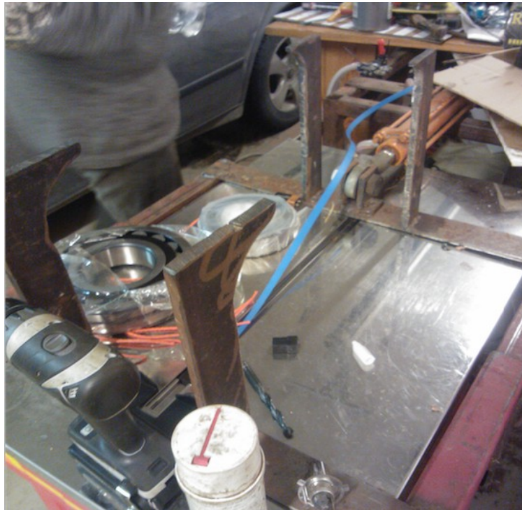
Kuva 4: Tasomainen vannepakkauslaite

Vanneratkaisuksi voidaan kutsua menetelmää, jossa klapit kootaan pakettiin niiden ympäri asetettavan vanteen avulla. Vanne voi olla muovia tai metallia. Klapit kulkisivat kuljettimelta kouruun (kehtoon), tai tasolle jossa klapit sidotaan vanteella yhteen. Kourumaisessa ratkaisussa klapit sijoittuisivat luontaisesti painovoiman ansiosta melko tiiviisiin paketteihin. Tasomaisessa ratkaisussa klapeja pitää puristaa yhteen esimerkiksi pneumaattisella laitteella. Vanne syötetään klapien ympäri syöttölaitteesta ja sen avulla pakkausta voidaan kiristää jonkin verran.