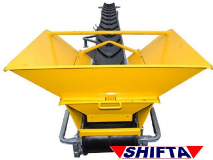
Kuva 7: Pienkuljetin keräyskaukalolla