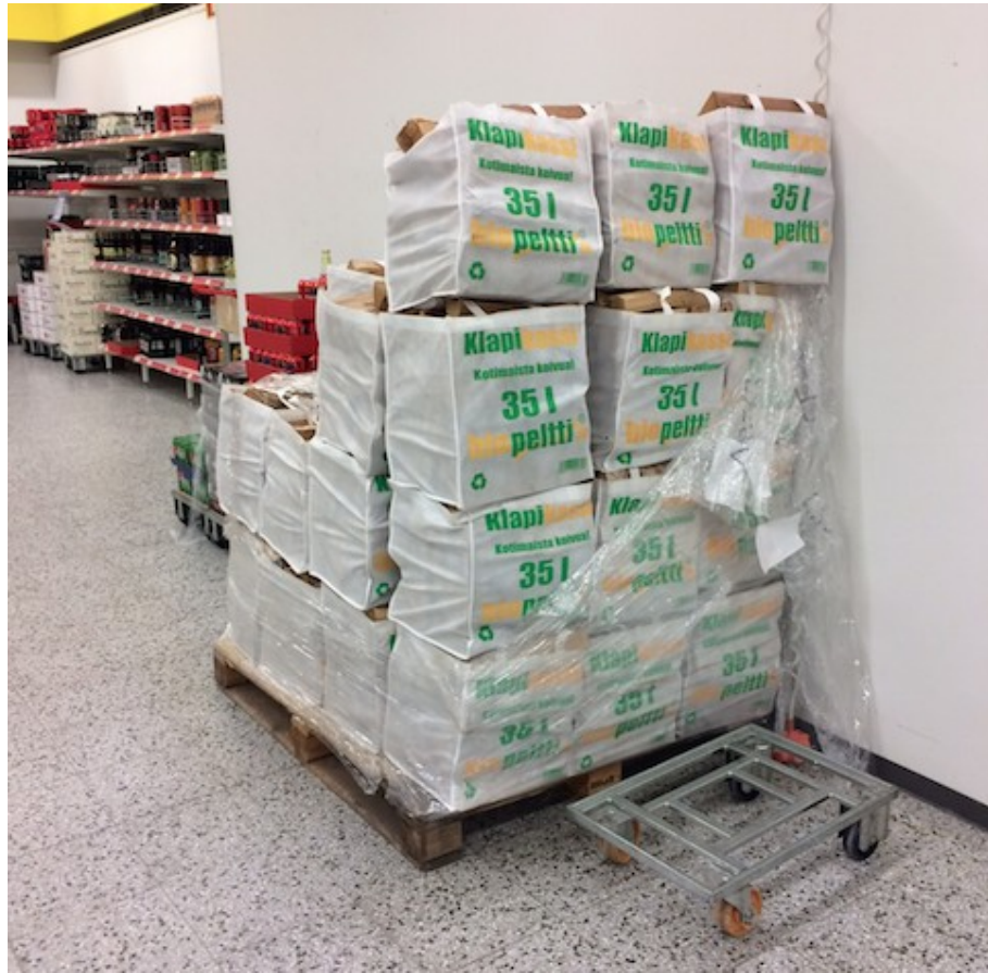
Kuva 9: Pusseihin pakattuja klapeja myynnissä ABC-myyvälässä