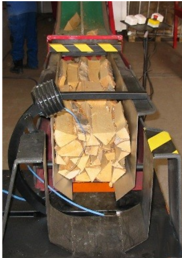
Kuva 8: Vannemenetelmällä toimiva pakkausaukalo (Finnomec)