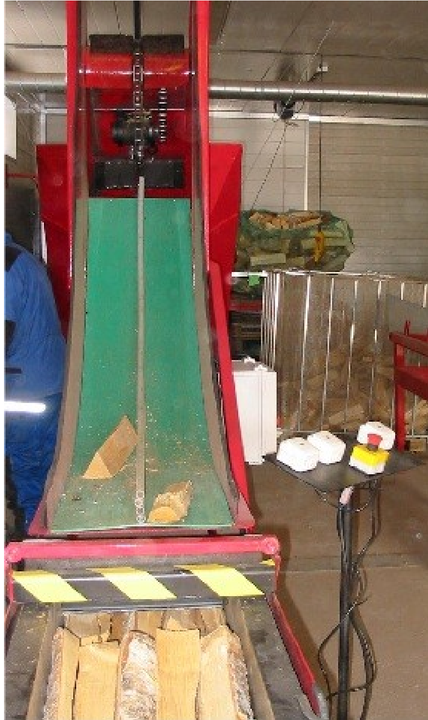
Kuva 6: Kuljetinta seuraava ramppi (Finnomec)