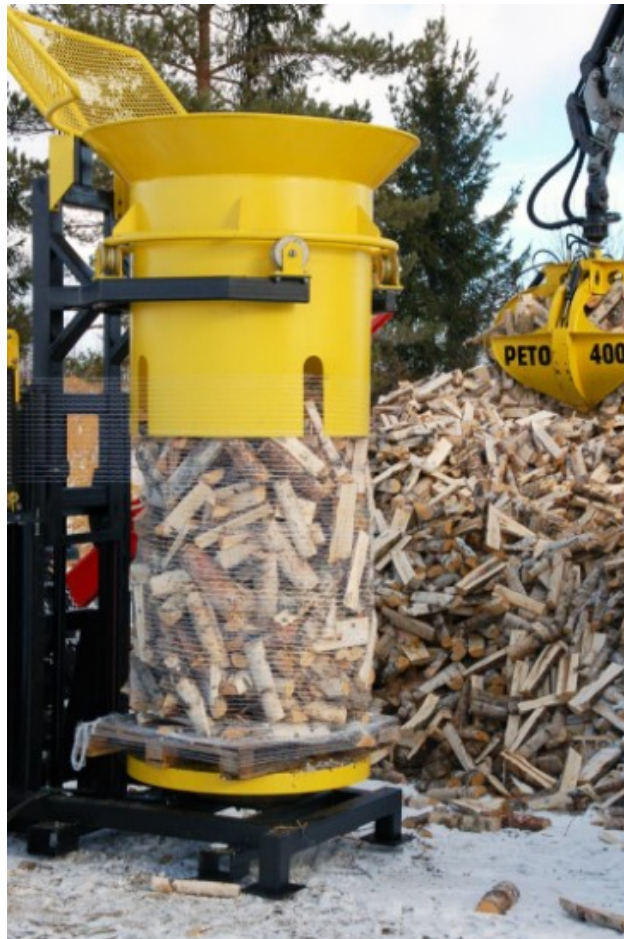
Kuva 5: Pakkauslaite nostettavalla rummulla (JIT-konepaja)

Pyörivään alustaan kiinnittämisen ansiosta esimerkiksi pakkausmuovi kiertyy klapien ympärille pakaten ne kasaan - kunhan rumpua nostetaan sopivalla nopeudella niin että muovi ei takerru siihen. Tämä laite tarvitsisi traktorin tai jonkun muun nostimen apua nostamaan rumpua ylöspäin. Hyvillä laakereilla varustettu alusta pyörii käden avustuksellakin, mutta tiiviin paketin aikaansaamiseksi siinäkin olisi hyvä käyttää moottoria apuna pyörittämiseen. Toisaalta alustan ei tarvitse pyöriä lainkaan mikäli pakkaaja itse kiertää pakkausmateriaalin kanssa pakkauksen ympäri. Tässä tapauksessa pakkaajan tulee käyttää jonkin verran voimaa saadakseen pakkauksesta tiivis.