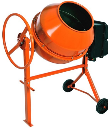
Kuva 3: Betonimylly

Kuvassa (3) FXA-merkkinen betonimylly. Kyseisen laitteen ideaa voisi hyödyntää tässä roskanpoistomenetelmässä. Myllyn rummun reunojen tulisi olla säleikköiset tai reikäiset jotta roskat poistuvat kunnolla. Klapit voidaan kipata kuljettimelle rummun pyöritettyä klapeja tarpeeksi kauan.