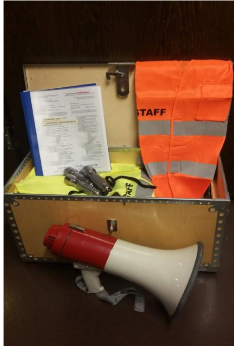
Kuva 1. Evakuointilaatikko

Evakuointiohjeet löytyvät lukitsemattomasta evakuointilaatikosta ja vastaanoton laatikosta. Pelastussuunnitelma evakuointiohjeineen löytyy myös sähköisenä RES Turvajärjestelmästä. Evakuointilaatikko (kuva 1) sisältää kaikki tärkeimmät evakuoinnissa tarvittavat välineet: sireeni, taskulamppuja sekä keltaisia ja oransseja heijastinliivejä.