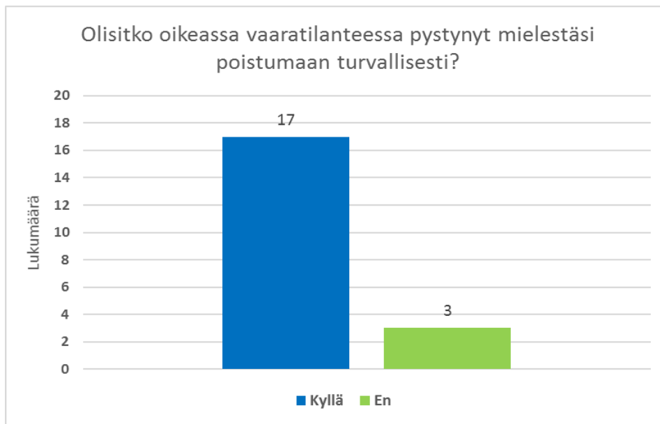
Taulukko 1. Turvallinen poistuminen oikeassa vaaratilanteessa

Kolme henkilöä, jotka vastasivat kysymykseen kieltävästi, kommentoivat poistumisturvallisuutta erilaisilla tavoilla. Kaksi heistä kokivat yhden poistumistien epäselväksi. Kyse on erään hätäpoistumistien kierreportaista, jotka päättyvät ylhäältä tullessa Amarillon Lounge baarin katolle, josta on jatkettava matkaa toisia portaita pitkin. Kolmas henkilö koki epävarmuutta yleisesti poistumisteitä kohtaan ja kertoi, että pelkäsi jäävänsä poistuessa juumiin. Lisäksi hän oli sitä mieltä, että varsinkin Amarillon työntekijöillä olisi hyvä olla omat yleisavaimet sekä taskulamppuja olisi sijoitettava enemmän Amarillon tiskeille.