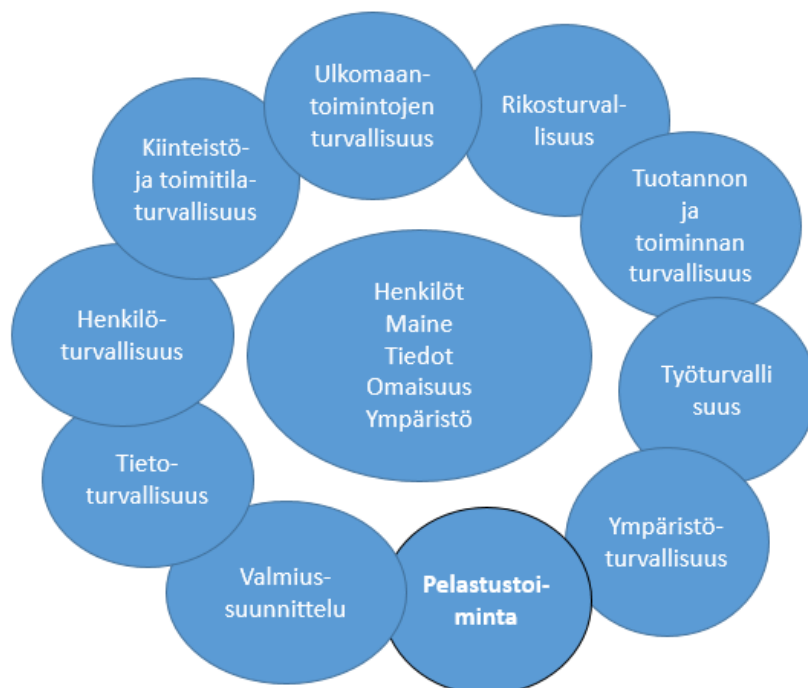
Kuvio 1. Yritysturvallisuuden osa-alueet (mukaillen Heljaste ym. 2008, 28)

Pelastustoiminta on yksi kymmenestä yritysturvallisuuden osa-alueesta (kuvio 1). Turvallisuusasioiden arvostus, riittävä tietotaito sekä turvallisuusteot- ja toimet määrittelevät turvallisuuskulttuurin tason. (Linjala & Waitinen 2016, 6). Yritysturvallisuus on merkittävä osa yrityksen päivittäistä toimintaa, koska sen avulla varmistetaan liiketoiminnan jatkuva häiriötön toiminta. (Miettinen 2002, 200). Turvallisuuskulttuurin kolme osatekijää tulisi toteutua jokaisessa yritysturvallisuuden osa-alueessa.