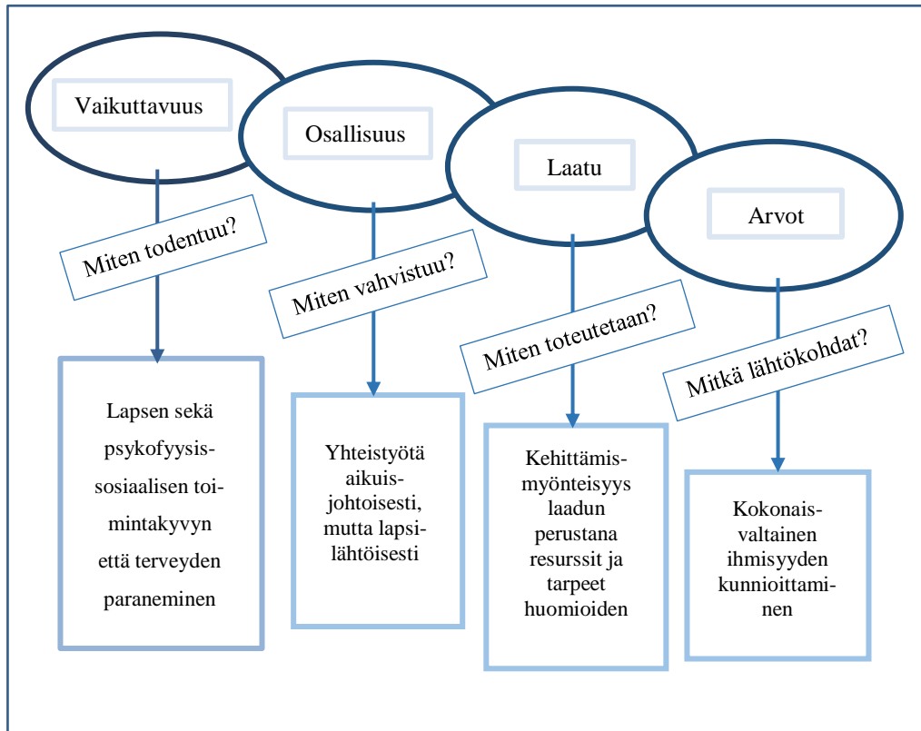
KUVIO 2: Tutkimustulokset teemoittain

Tutkimustuloksista oli selkeästi löydettävissä millä tavoin tutkimusteemat näyttäytyvät lastensuojelun sijaishuollon arjessa. Analyysin kautta muodostui neljä teoreettista käsitettä, jotka esitellään seuraavassa tulososiossa. Oheinen kuvio 2 myös kokoaa tutkimustulokset.