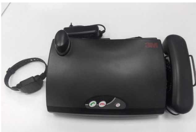
Kuvio 3: Kotipääte