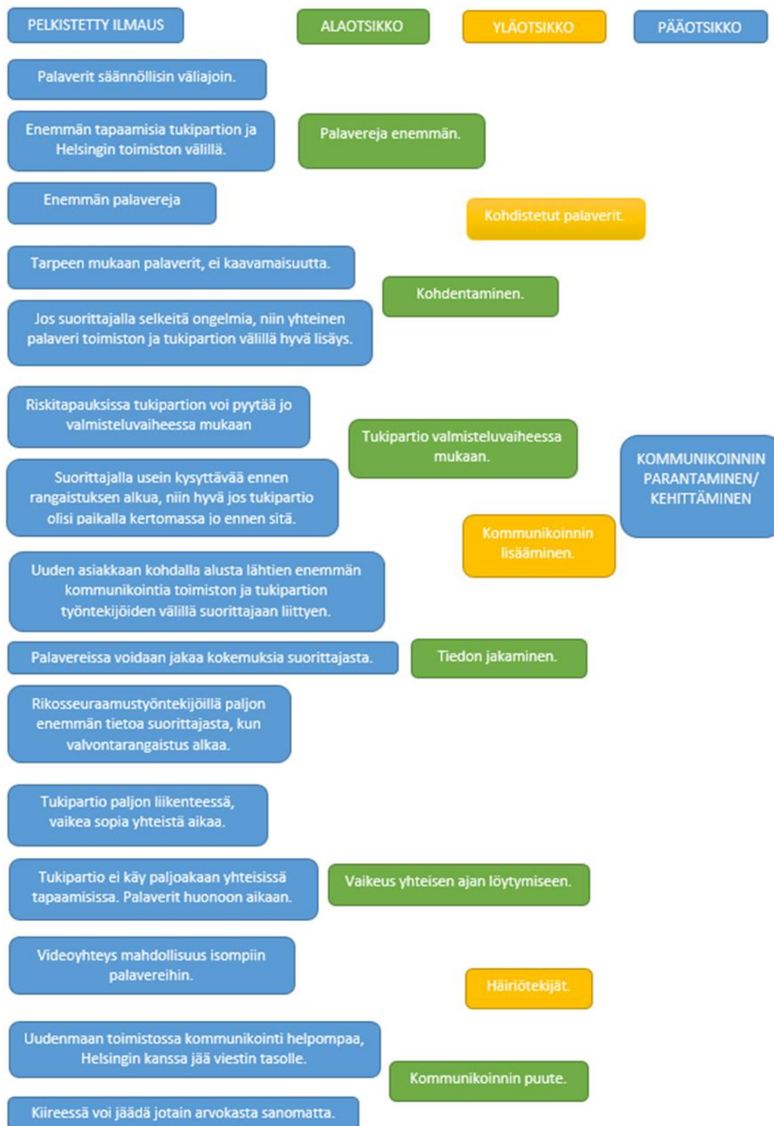
Kuvio 4: Sisällönanalyysi taulukko