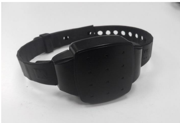
Kuvio 2: Nilkkapanta

Hallituksen esitys Eduskunnalle valvontarangaistusta ja sähköistä valvontaa avolaitoksissa koskevassa lainsäädännössä tuodaan esille, että sähköiseen valvontaan liittyvät teknilliset ratkaisut ovat kehittyneet merkittävästi viime vuosien aikana. Tällä pystytään varmistamaan, että suorittaja pysyy poissa esimerkiksi toimintavelvoitteen aikana määrätyn alueen (koti) ulkopuolella. (Hallituksen esitys Eduskunnalle valvontarangaistusta ja sähköistä valvontaa avolaitoksissa koskevaksi lainsäädännöksi HE 17/2010.)