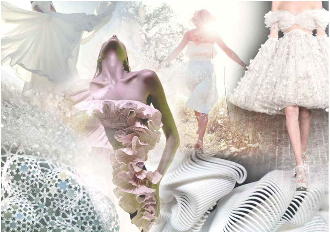
Kuva 5. Muotielokuvan vaalean puvun mood board.

Viimeisenä esittelen vaalean puvun mood boardin (kuva 5).