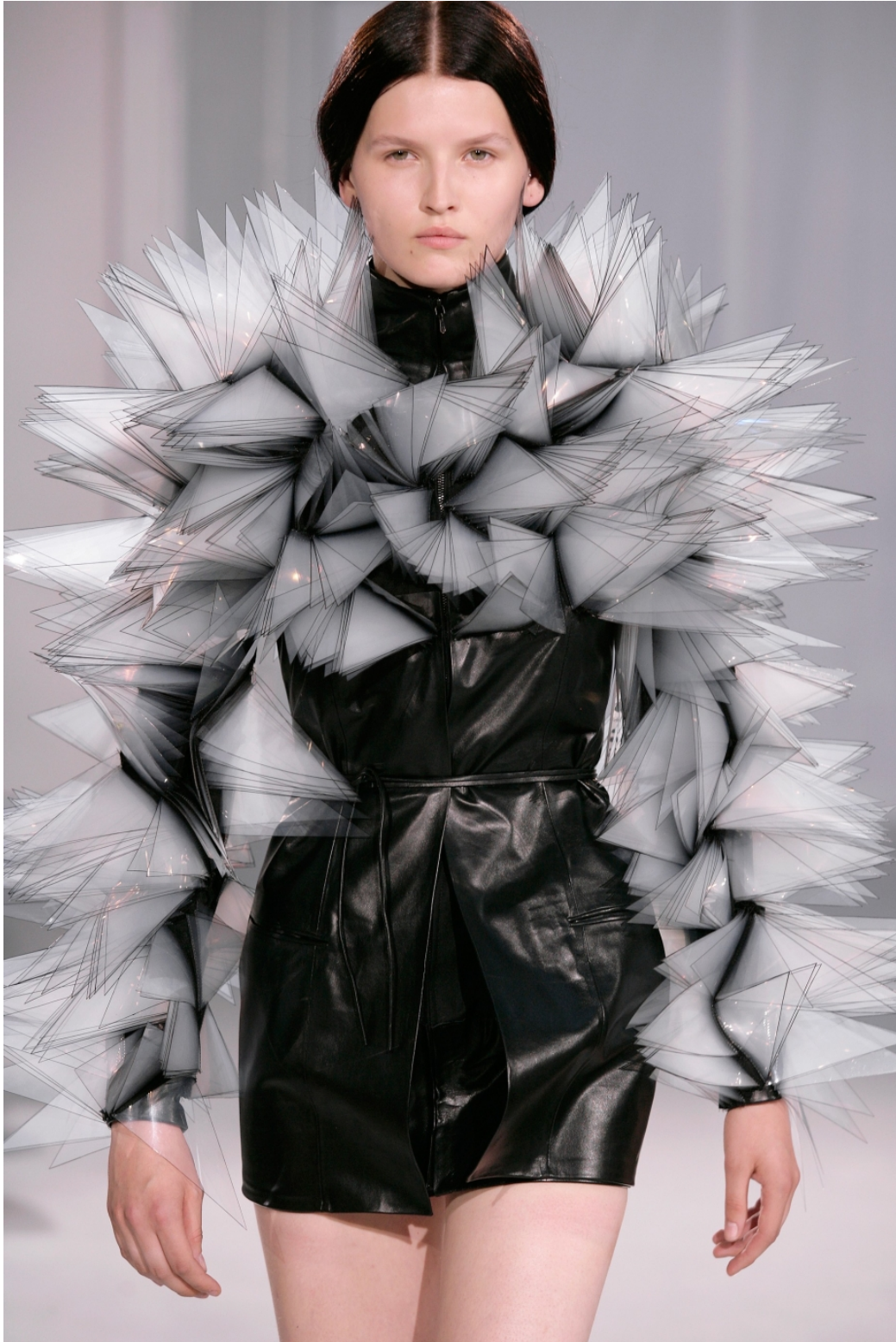
Kuva 2. Iris van Herpenin vuonna 2011 suunnitteleman Capriole Couture -malliston puku (Van Herpen 2016).

Toinen Capriole Couture -mallistoon kuuluva puku (kuva 2) vuorostaan kuvastaa hypyn ilmalennon aikana koettavaa tunnetilaa.