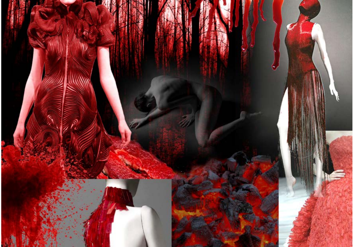
Kuva 3. Muotielokuvan punaisen puvun mood board.

Kuvassa (kuva 3) on esitettyä punaisen tuskaa ilmentävän puvun mood board. Puku edustaa kaikkea sosiaalisten kanssakäymisten aiheuttamaa tuskaa kuten esimerkiksi petetyksi tulemistä, hylkäämisen tunnetta tai tunnetta, ettei sovi yhteiskunnan ennalta määritettyihin normeihin. Tuska on sitä, kun ihminen kokee itsensä väärinymmärretyksi, kun hän ahdistuu, tai kokee olevansa täysin hukassa ja vailla suuntaa tai toivoa. Oma visuaalinen tulkintani tästä tunnetilasta on punainen veri, polttava hiili ja veresliha.