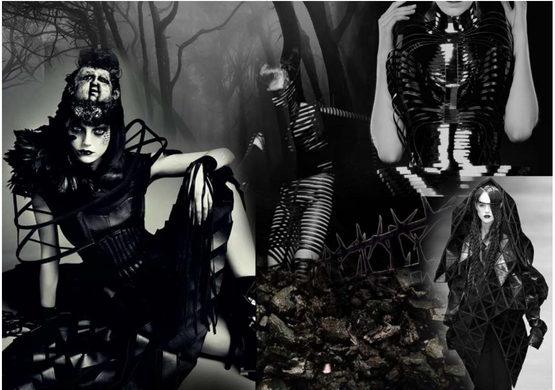
Kuva 4. Muotielokuvan mustan puvun mood board.

Seuraava mood board (kuva 4) esittää mustan puvun tyyliä. Puku on panssarinomainen, kuten suojaava kuori tai kulissi. Puku saa kantajansa vaikuttamaan vahvalta soturilta, mutta todellisuudessa sen sisällä on haavoittunut, jatkuvasti puolustuskanalla oleva ihminen. Tästä tunnetilasta minulle tulee mieleen synkkä musta väri, nahka, metalli, suojakehikko, piikkilanka sekä rankoja tai luita.