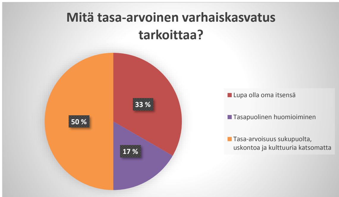
Kaavio 1. Mitä tasa-arvoinen varhaiskasvatus tarkoittaa?

Kokosin vastaukset kaavioon (Kaavio 1) ja yhteenvedona voin todeta, että kasvattajien määritelmät tasa-arvoisesta varhaiskasvatuksesta olivat jaettavissa kolmeen osaan. Kolme vastaajista yhdisti tasa-arvoisuuden sukupuolesta, kulttuurista ja uskonnosta riippumatta tasa-arvoiseen varhaiskasvatukseen, kaksi vastaajista yhdisti tasa-arvoiseen varhaiskasvatukseen luvan olla oma itsensä ja yksi vastaajista ajatteli tasa-arvoisen varhaiskasvatuksen olevan lasten tasapuolista huomioimista.