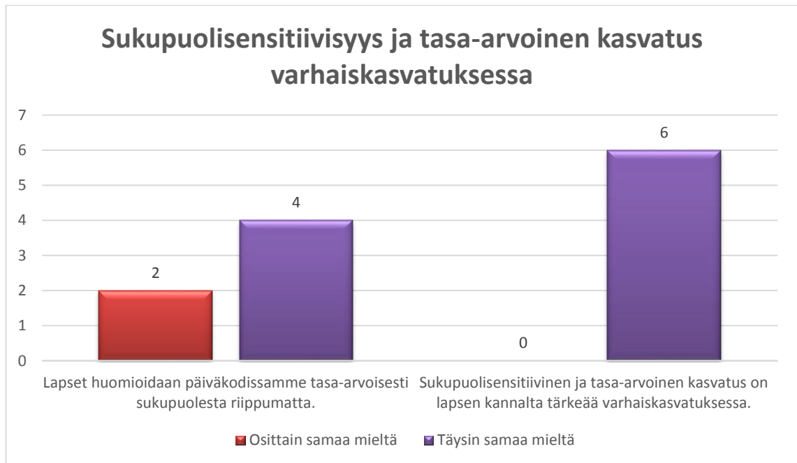
Kaavio 3. Sukupuolisensitiivisyys ja tasa-arvoinen kasvatus varhaiskasvatuksessa.

Kokosin yhteenvedona kaavioon (Kaavio 3) mielestäni tärkeimmät kysymykset opinnäytetyöni tarkoitusta ajatellen. Kummassakin kysymyksessä vastaukset olivat vaihtoehdoissa ”osittain samaa mieltä” tai ”täysin samaa mieltä”. Näiden vastausten perusteella kasvattajat kokevat päiväkotinsa toiminnan olevan tasa-arvoista tai suurimmaksi osin tasa-arvoista. Kaikki kasvattajat näkevät myös sukupuolisensitiivisyyden ja tasa-arvoisen kasvatuksen olevan tärkeää ja merkityksellistä lapsen kannalta.