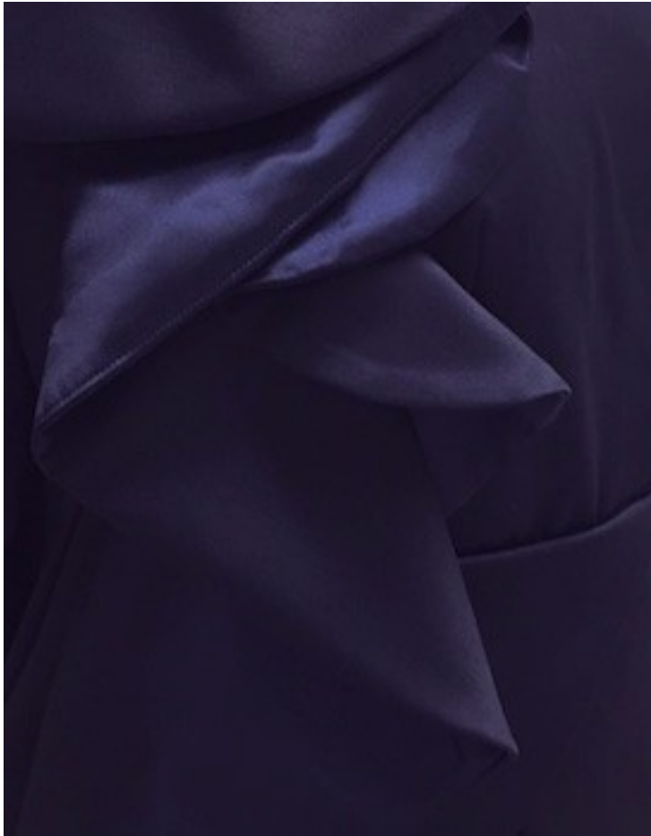
KUVA 23 Villasatiinin ja silkin erilaiset kiillot.

Juhlapuvun materiaalien etsimisen aloitin kartoittamalla valikoimaa internetin avulla. Huomasin kuitenkin, että villasatiini ja silkki on mahdotonta valita pelkän internetin perusteella, koska kankaita ei pääse tunnustelemaan ja testaamaan niiden ominaisuuksia. Minua huoletti myös se, ettei tietokoneen ruudulta valittu väri vastaisi todellisuutta. Päätinkin hakea juhlapuvun kankaat Helsingistä, jossa on eniten alan erikoisliikkeitä.