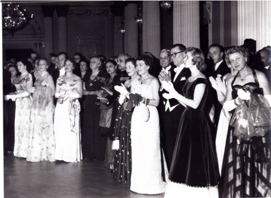
KUVA 8 Linnan muotia vuodelta 1955.

Pukeutuminen on aina ollut tärkeä osa Linnan juhlia. Jo K. J. Ståhlbergin puoliso Ester Ståhlberg pohti päiväkirjamerkinnöissään itsenäisyyspäivänä vuonna 1921 omaa ja vieraiden pukeutumista juhliin. Myös media on ollut kiinnostunut juhlien pukeutumisesta alusta lähtien. Vuoden 1922 itsenäisyyspäivän vastaanotosta Suomen Sosiaalidemokraatti kirjoitti : ”Erikoista huomiota herättivät naisten monivivahteiset leningit ja diplomaattien loistavanväriset puvut.” (Hirvikorpi 2006: 21–22.)