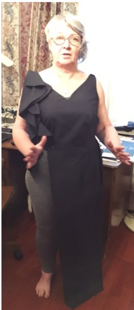
KUVA 20 Kuva sovitustilanteesta.

Sovituksen jälkeen tein asusta vielä yhden luonnoksen, jossa vähensin helman epäsymmetrisyyttä (KUVA 21). Muutosten jälkeen päällimmäinen helma muistuttaa muodoltaan tulppaanihelmaa. Kokeilin helman muotoa muotoilemalla luonnoksen pohjalta sovitusnuken päälle (KUVA 22). Olin tyytyväinen helman muotoon, sillä se näytti toimivalta ja tyylikkäältä. Olin valmis tekemään vaatteelle kaavat.