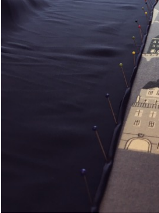
KUVA 30 Helmakäänte silkkiin.

Valmistelin helman silkkikankaan pliseerausta varten (KUVA 30). Ennen pliseerausta kangas piti leikata kahteen 95 senttiä pitkään palaan, joihin ompelin helmakäänteen. Lähetin kankaan pliseerattavaksi turkulaiseen yritykseen.