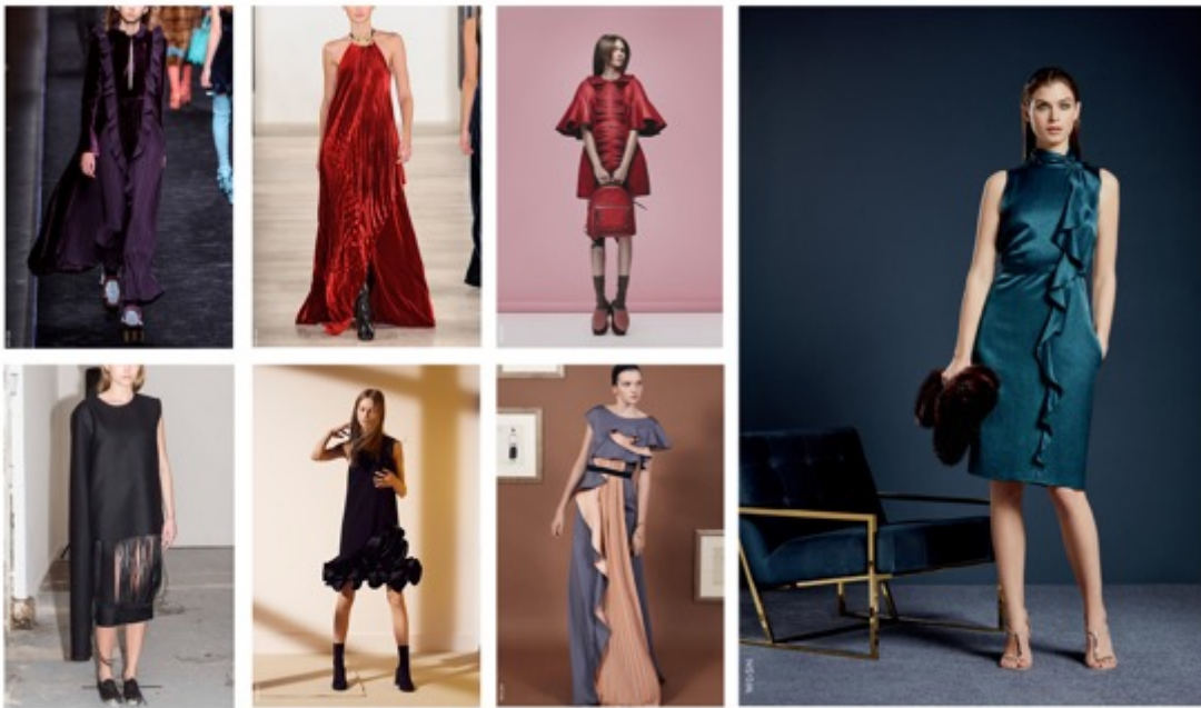
KUVA 14 Trendiennuste kollaasi.

Opinnäytetyöni kannalta oleellisinta oli selvittää, millaisia vaatetuksen trendit ovat kaudella syksy–talvi 16–17. Tarkastelin trendiennusteita erityisesti naisten juhlapukeutumisen kannalta. Ennusteiden pohjalta kartoitin värivaihtoehtoja ja ideoin yksityiskohtia pukuun. Pidin trendiennusteisiin perehtymistä tärkeänä, vaikka havaintojeni mukaan juhlapukeutuminen ei seuraakaan trendejä niin nopealla syklillä kuin arkipukeutuminen. Juhlapuvuissa suositaan usein klassisia malleja, materiaaleja ja värejä, jotka ovat osittain myös pukeutumisetiketin sanelemia. Trendiennusteisiin syventyminen oli opinnäytetyöni kannalta tärkeintä inspiroitumisen näkökulmasta.