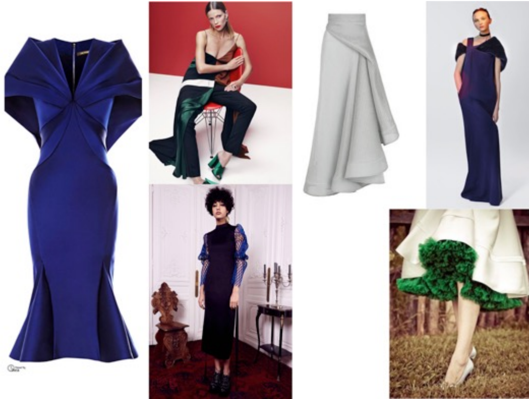
KUVA 28 Ideataulu.

tapaamisessa mukanani jotakin, joka havainnollisti asiakkaalle alustavia suunnitelmiani. Ensimmäisessä tapaamisessa esittelinkin hänelle tekemäni ideataulun (KUVA 28).