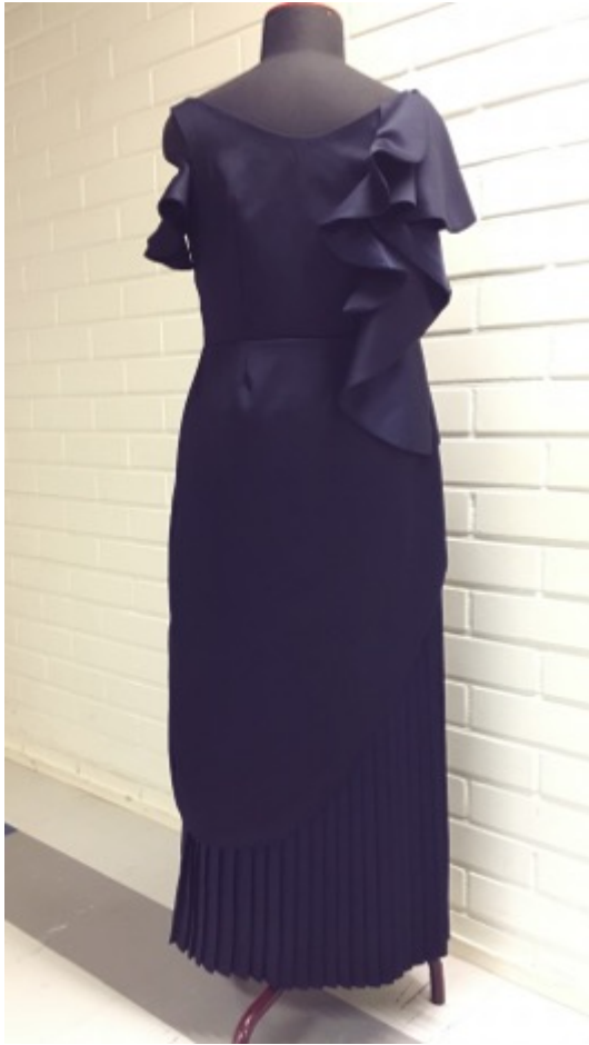
KUVA 33 Valmis juhlapuku takaa.