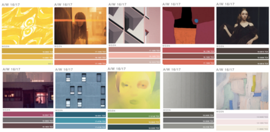
KUVA 15 WGSN:n väriennuste kaudelle syksy–talvi 16–17.

Väriennusteissa värejä verrataan usein edellisen kauden väreihin. Koska kiinnostukseni kohteena on syksy–talvi 16–17 -kausi, luodaan väriennuste kevät–kesä 2016 -kauden pohjalta (KUVA 15). WGSN:n väriennusteissa keltaiset muuttuivat kesän jälkeen murretummiksi, kuten okrankeltaiseksi, sinapinkeltaiseksi sekä huurteisen kirpeäksi keltaiseksi. Oranssit taittuivat kesän väreihin verrattuna hieman enemmän tiilenpunaiseen. Pinkit eivät olleet enää yhtä voimakkaita kuin kesän värikartoissa, vaan ne muuttuivat puuterisiksi ja marjapuuronsävyisiksi. Punaiset voimistuivat ja muuttuivat dramaattisen tummiksi. Ruskean sävy muuttui kesän jälkeen melkein mustanruskeaksi tai hyvin tummaan vihreään taittavaksi. Violettien kirkkaus hävisi ja ne muuttuvat lähes ruskeiksi tai oikein syviksi luumunpunaisiksi. Sinisiin tuli tummia turkoosin sävyjä, ja puhdas sininen jäi värikartoista kokonaan pois. Vihreissä näkyi tummaa omenanvihreää, keltaisella taitettua vihertävää okrankeltaista ja erittäin tummaa smaragdinvihreää. Harmaat olivat tummia: hiilenharmaita, siniharmaita ja keskiharmaita. Pastelliväreissä hallitsivat hyvin vaalea huurrettu violetti, vaaleanpunainen ja luonnonvalkoinen. (WGSN 2, WGSN 3.)