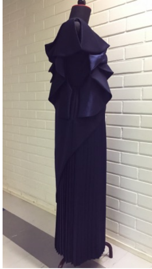
KUVA 32 Valmis juhlapuku oikealta sivulta.