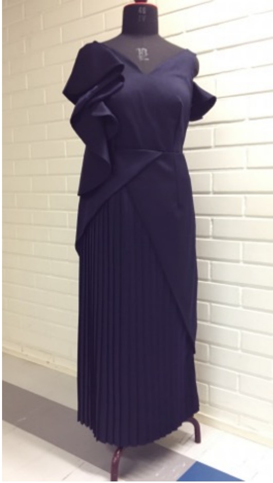
KUVA 31 Valmis juhlapuku edestä.