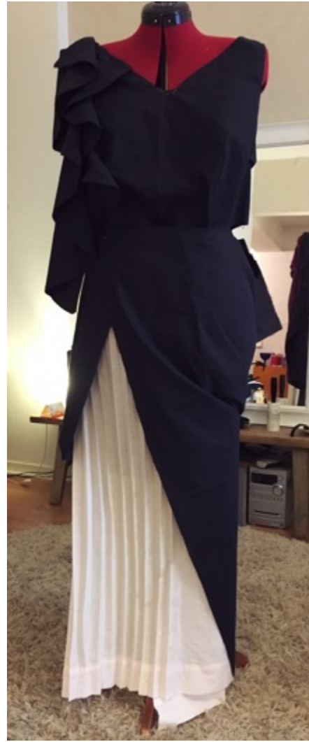
KUVA 22 Helman muotoilua.