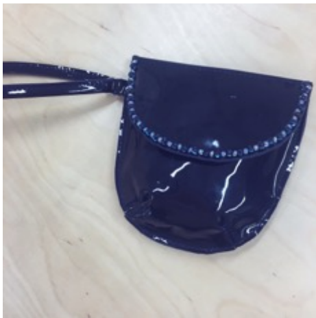
KUVA 35 Valmis juhlalaukku.

Juhlapukuun valmistamani asusteet ovat kiiltoonahkainen laukku ja hiuskoriste, jotka molemmat ovat tummansinisiä ja koristeltu helmillä (KUVAT 33 ja 34).