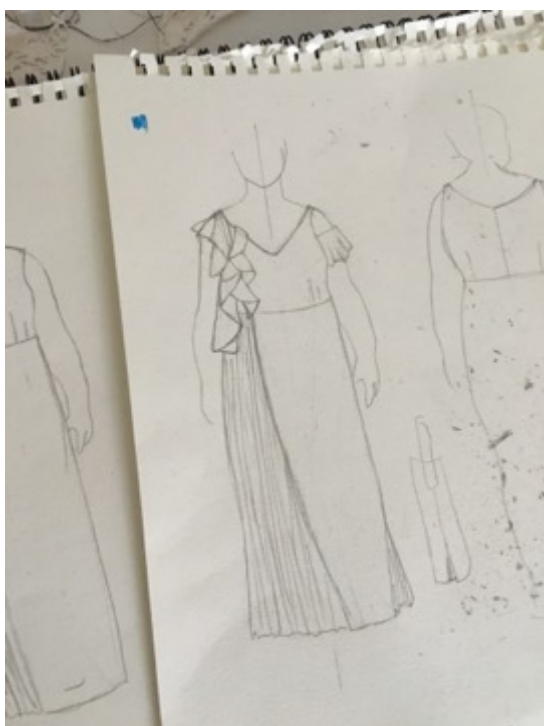
KUVA 19 Luonnos.