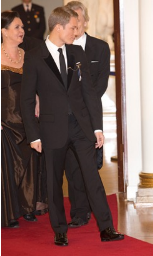
KUVA 11 Jare Tiihonen eli Cheek Linnan juhlissa vuonna 2015.