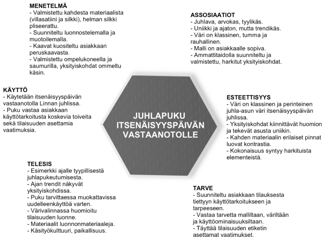
KUVA 40 Puvun arviointi Victor Papanekin funktioanalyysin mukaan.

Arvioin valmistamaani tuotetta hyödyntämällä Victor Papanekin funktioanalyysia. Funktioanalyysi soveltuu erityisesti muotoilun tuotteiden ominaisuuksien tarkasteluun. Analyysissa on keskeistä, ettei tuotetta arvioida vain sen toimivuuden kannalta. Papanek jakaa tuotteet kuuteen ominaisuuden funktioon: menetelmä, käyttö, telesis, tarve, esteettisyys ja assosiaatio. Menetelmällä tarkoitetaan niitä jälkiä, joita valmistusmenetelmä tuotteeseen jättää. Käyttöosiossa arvioidaan tuotteen soveltuvuutta sille osoitettuun tarkoitukseen. Telesiksellä tarkoitetaan tuotteen kulttuurista ja ajallista, mutta myös taloudellista ja ekologista kontekstuaalisuutta. Tarpeella Papanek tarkoittaa sitä, miten tuote tyydyttää käyttäjänsä tarpeen. Esteettisyyden osalta tuotteesta arvioidaan esimerkiksi värejä ja muotoja. Assosiaatiot ovat niitä ajatuksia, joita tuote herättää. (Anttila 2006: 212, Koskennurmi-Sivonen.)