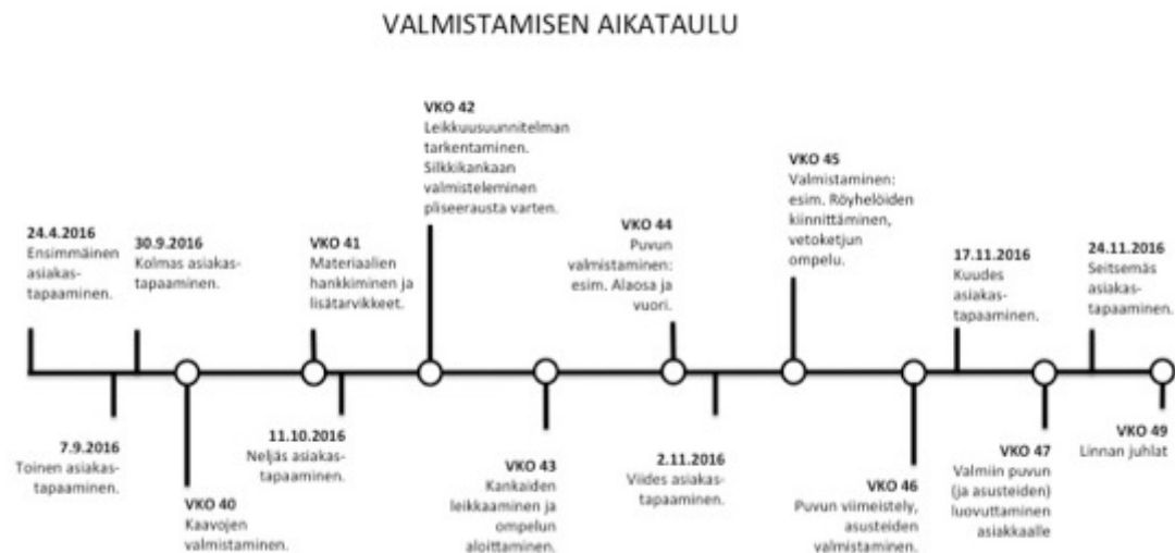
KUVA 29 Puvun valmistamisen aikataulu.

Aloitin työni valmistamalla kaavat. Asiakkaasta ottamani tarkkojen mittojen pohjalta tein peruskaavat, jotka kuositelin luonnostelemani mallin mukaisiksi. Ompelin teollisuusompelukoneella ja -saumurilla. Viimeistelyn tein käsin. Ompeluun käytin polyesteri- ja puuvillalankoja. Silkkiset osat ompelin silkkilangalla. Tein valmistusvaiheesta viikkokohtaisen aikataulun (KUVA 29), jota käytin suuntaa-antavana työjärjestyksenä. Aikataulustani kävi ilmi, mikä työvaihe on tehtävä minäkin päivänä, jotta puku valmistuu ajoissa. Aikataulu selkeytti ja nopeutti työn tekemistä.