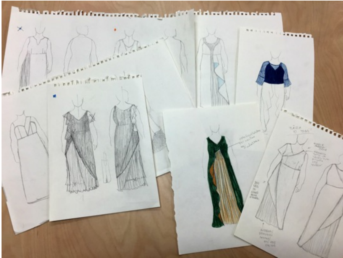
KUVA 18 Erilaisia luonnoksia puvusta.

Tein useita luonnoksia myös koko puvusta (KUVA 18). Luonnoksissa visualisoin eriytyisiä vaihtoehtoja. Halusin suunnitella useita vaihtoehtoja, vaikka pidinkin ensimmäisen luonnokseni alaosan ratkaisua melko hyvänä. Mielestäni oli kuitenkin tärkeää kehittää ideaa epätodennäköisiinkin suuntiin, jotta lukittuisi heti alussa yhteen näkemykseen. Kokeilujen avulla saattaa myös löytää uusia näkökulmia kokonaisuuteen.