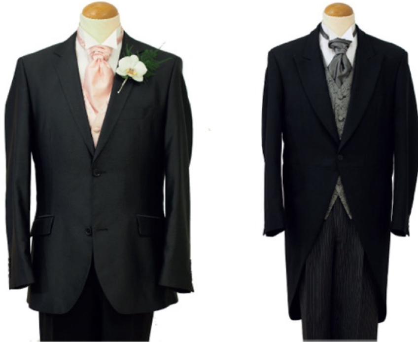
KUVA 1 Tumma puku.