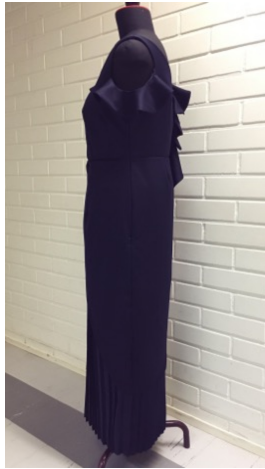
KUVA 34 Valmis juhlapuku vasemmalta sivulta.

Juhlapukuun valmistamani asusteet ovat kiiltoonahkainen laukku ja hiuskoriste, jotka molemmat ovat tummansinisiä ja koristeltu helmillä (KUVAT 33 ja 34).