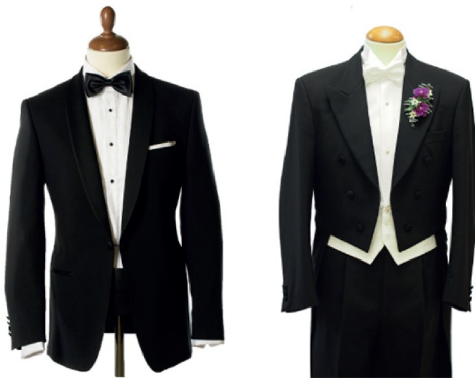
KUVA 6 Smokki.

plastronin mukaan. Saketin kanssa käytetään ohutpohjaisia nauhakenkiä. Vyön sijaan saketin kanssa kuuluu käyttää olkaimia. Saketin kanssa voi käyttää hattuna harmaata tai mustaa silinteriä, edeniä tai chapeau claqueta (KUVAT 3, 4 ja 5). Nainen pukeutuu juhlaan päiväjuhlapukuun, kun miehellä on yllään saketti. Sakettitilaisuuksiin sopivat esimerkiksi juhlat jakkupuvut ja leningit. Naisen pukeutumisen värisävyjä ei ole rajoitettu, muttei naisen asu saa olla päiväjuhlissa liian avonainen. Kengät ovat yleensä avokkaat, laukku on siro. Hattu ja käsiineet täydentävät naisen asua. Kokonaisvaikutelman tulisi olla hillitty, huoliteltu ja tasapainoinen. (Hakala 2010: 44; Isotalo 2000: 38–42.)