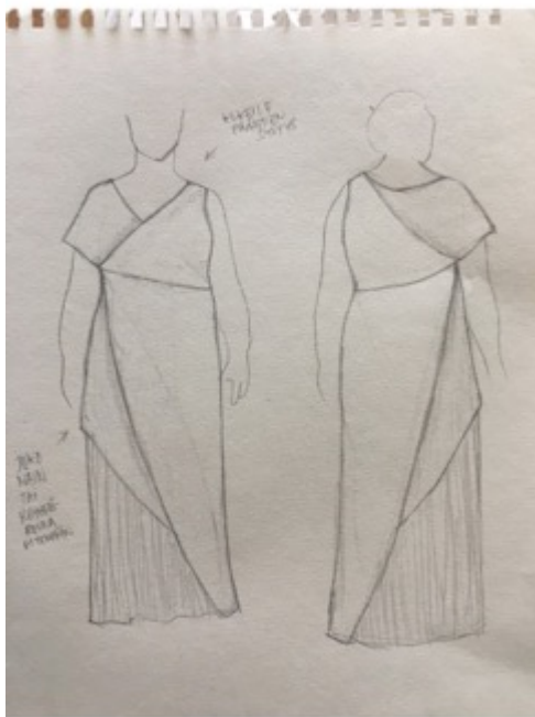
KUVA 16 Ensimmäinen lyijykynäluonnos.

Aloitin suunnittelun ensimmäisen asiakastapaamisen jälkeen, kun sain tarkempaa tietoa asiakkaan toiveista. Ensimmäisessä asiakastapaamisessa myös valokuvasin asiakkaan edestä, sivulta ja takaa. Aloitinkin suunnittelun kopioimalla asiakkaan etukuvan siluetin luonnostelupaperille. Luonnostelin etukuvan päälle nähdäkseni suunnitelmani oikeissa mittasuhteissa, ja jotta hahmottaisin paremmin, mikä sopii asiakkaan vartalotyypille. Hahmottaakseni luonnoksia muotoilin ja ompelin prototyyppejä kankaasta muotoilunuken päälle. Työtavan avulla minun oli helpompi arvioida oikeassa koossa sitä, mitkä muodot sopivat asiakkaan mittasuhteille ja vartalolle. Lisäksi prototyyppejä valmistaessa huomaa, jos kaava ei ole toteutuskelpoinen. Muotoilun avulla pystyy hahmottamaan myös sitä, mitä kyseinen malli vaatii kankaalta (esimerkiksi täytyykö kankaan olla ohuempi tai paksumpi tai laskeutuvampi kuin muotoilussa käytetty kangas).