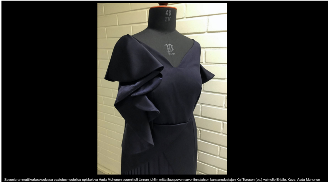
Savonia-ammattikorkeakoulussa vaatetusmuotoilua opiskeleva Aada Muhonen suunnitteli Linnan juhlien mittatilauspuvun savonlinnalaisen kansanedustajan Kaj Turusen (ps.) vaimolle Erjalle.

LIITE 5: Kuva suunnittelemastani juhlapuvusta Savon Sanomien verkkosivuilla 6.12.2016.