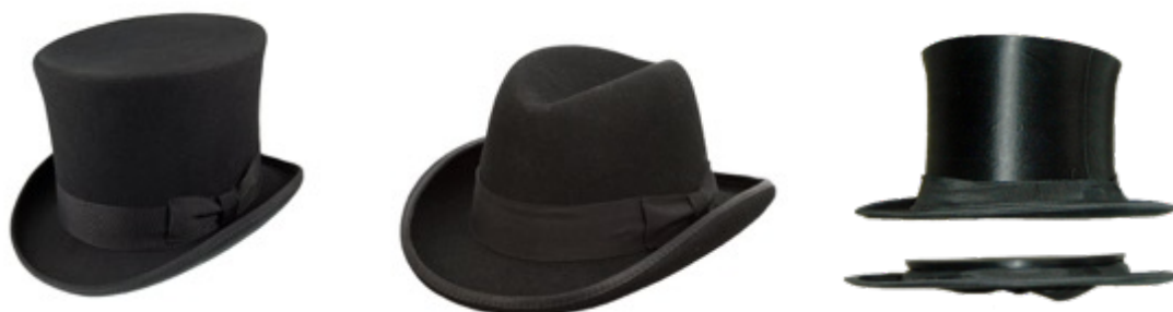
KUVA 3 Musta silinteri.

joiden joukosta tulisi valita kunkin tilaisuuden luonnetta parhaiten vastaava asu. Jos tummalla puvulla korvataan frakki, saketti tai smokki, on naisen pukeuduttava sen mukaan. Naisen tulee huomioida asuvalinnassaan juhlien kellonaika. Päivätilaisuuteen nainen voi pukeutua kevyemmin ja epämuodollisemmin, iltatilaisuuksiin pukeudutaan iltapukuun, leninkiin tai pikkumustaan. Useimmiten tummaa pukua käytetään pieni- muotoisissa juhlissa (kuten sukujuhlat), joihin nainen voi pukeutua esimerkiksi juhla- vaan mekkoon, hame-puseroyhdistelmään tai jakku- tai housupukuun. (Hakala 2010: 43–44; Isotalo 2000: 18–22.)