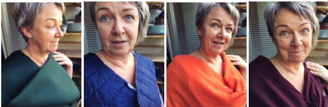
KUVAT 24–27 Värikokeiluja asiakkaan ihoa vasten luonnonvalossa.

Juhlapuvun materiaalien etsimisen aloitin kartoittamalla valikoimaa internetin avulla. Huomasin kuitenkin, että villasatiini ja silkki on mahdotonta valita pelkän internetin perusteella, koska kankaita ei pääse tunnustelemaan ja testaamaan niiden ominaisuuksia. Minua huoletti myös se, ettei tietokoneen ruudulta valittu väri vastaisi todellisuutta. Päätinkin hakea juhlapuvun kankaat Helsingistä, jossa on eniten alan erikoisliikkeitä.