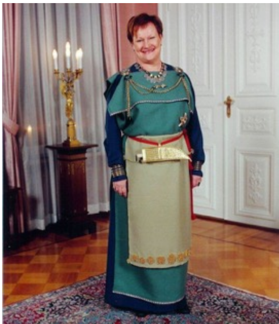
KUVA 10 Presidentti Tarja Halonen Euran muinaispuvussa.

Linnan juhlissa myös kansallispuku on mahdollinen asu sekä miehille että naisille. Kansallispuku on asukokonaisuus, jota on käytettävä täydellisenä. Kansallispuvun käytöstä tarkkoja ohjeita antavat kansallispukuneuvosto ja kansallispukukeskus. Kansallispuku on perinteikäs arvopuku, jolla voidaan kunnioittaa myös isänmaallisia juhlia, kuten itsenäisyyspäivän vastaanottoa. Nykyään kansallispukuja nähdään kuitenkin varsin vähän Linnan juhlissa. Toistaiseksi ainoa kansallispuvun itsenäisyyspäivän vastaanotolle pukenut presidentti on Tarja Halonen, joka käytti Euran muinaispukua vuonna 2001 (KUVA 10). Halosen asuvalinta herätti tuolloin runsaasti huomiota. (Isotalo 2000: 44; Hirvikorpi 2006: 107.)