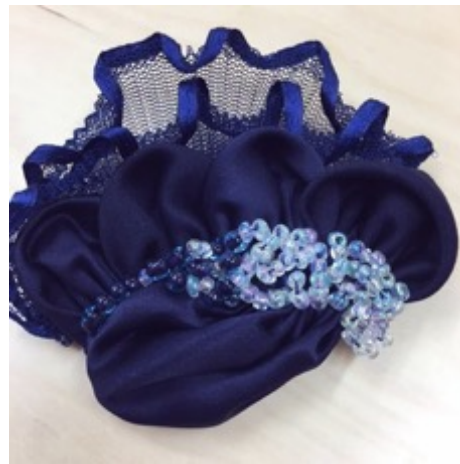
KUVA 36 Valmis hiuskoriste.