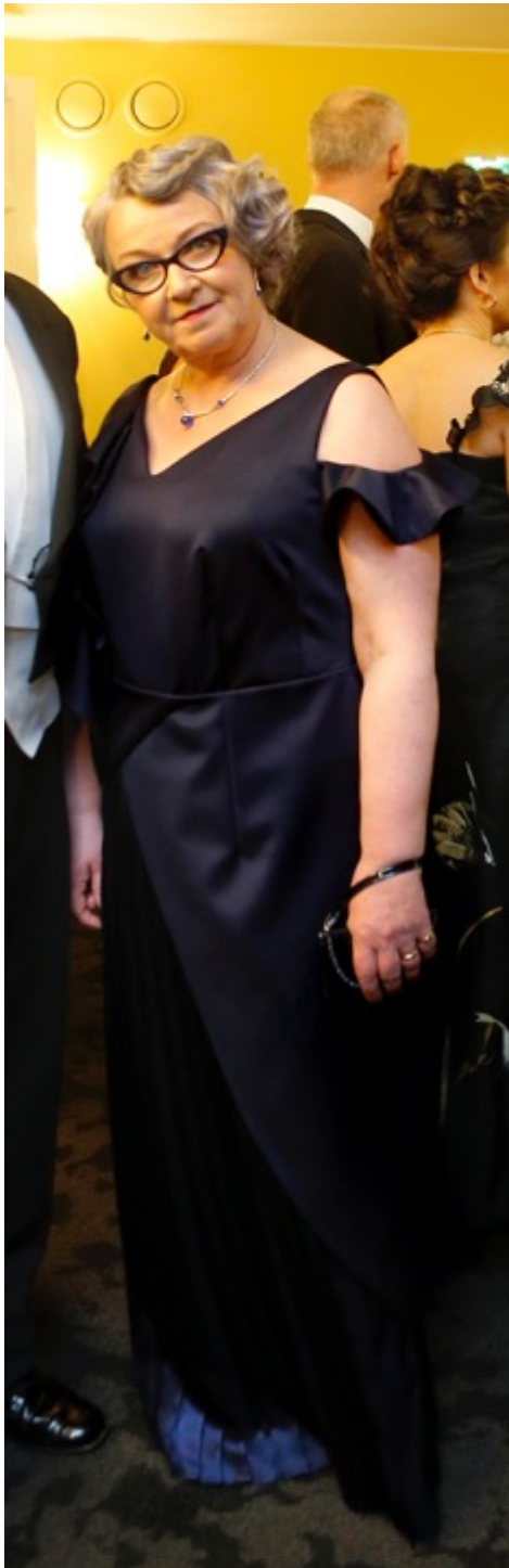
KUVA 38 Valmistamani puku asiakkaan päällä Linnan juhlissa.