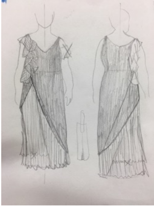
KUVA 21 Lopullinen luonnos.