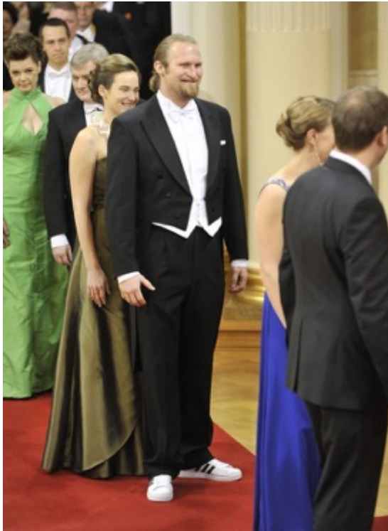
KUVA 13 Karri Miettinen eli Paleface Linnan juhlissa 2010.