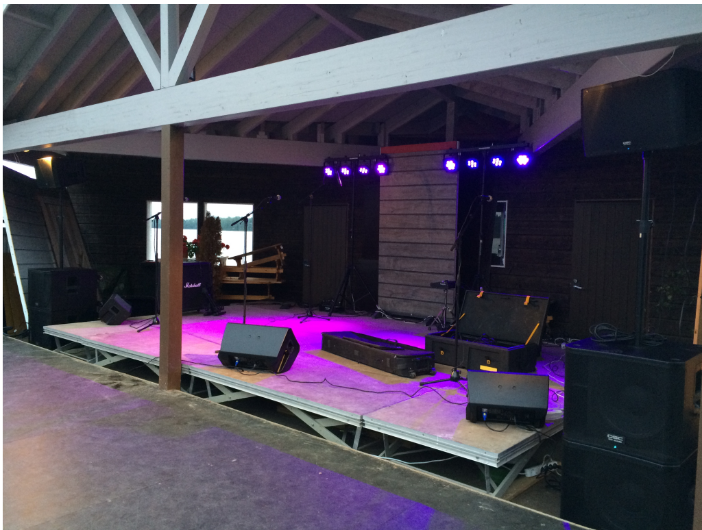
KUVA 1. PA-kalustoa äänentoistokeikalta 2015

tivat meidät käytännössä laadukkuudellaan ja käyttömukavuudellaan. Tällöin päätimme myös hankkia yrityksellemme pakettiauton, joka toimisi myös mahdollisena keikkabussina ja äänentoistolaitteiden kuljetusvälineenä. Keväällä aloimme myös siivota ja remontoida mökkiä, jotta saisimme sen mahdollisimman pian vuokrauskuntoon. Teimme yhteistyösopimuksen valtakunnallisen loma-asuntoja ja vuokramökkejä välittävän Lomarengas Oy:n kanssa. Välitysfirman työntekijä kävi arvioimassa mökin kuntoluokituksen sekä varustustason. Loppukesästä 2013 mökkimme oli vuokrattavissa Lomarenkaan toimesta. Itse yritystoiminta lähti etenemään pikkuhiljaa eteenpäin. (KUVA 3).