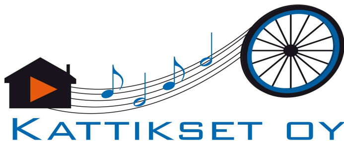
KUVA 4. Osakeyhtiön logo

Alkukevästä 2014 aloimme keskustella isämme kanssa hänen mahdollisesta eläköitymisestään ja ideasta siirtää taksitoiminta yrityksemme alaisuuteen. Ensimmäiseksi haasteeksi asiassa nousi se, että hänellä jo aiemmin hallinnassa ollut taksiliikenteen liikennelupa oli henkilökohtainen eikä lupaa pystynyt lahjoittamaan eteenpäin. Ainut keino oli, jolla luvan sai siirrettyä yrityksen nimiin, että yritysmuoto täytyi muuttaa osakeyhtiöksi ja isästäni tuli enemmistöomistaja yritykseen. (KUVA 4). Lupa siirtyi lopulta kesällä 2015 yritykselle ja isäni toimii lupavastaavana yrityksessämme. Isäni läsnäolo yrityksessä on välttämätöntä siihen asti, kunnes jompikumpi meistä veljeksistä suorittaa Trafín määrittämän yrittäjätutkinnon. Tällöin lupavastaavana toimiminen yrityksessä on mahdollista meillekin, eikä isän läsnäolo enää ole sen vuoksi välttämätöntä.