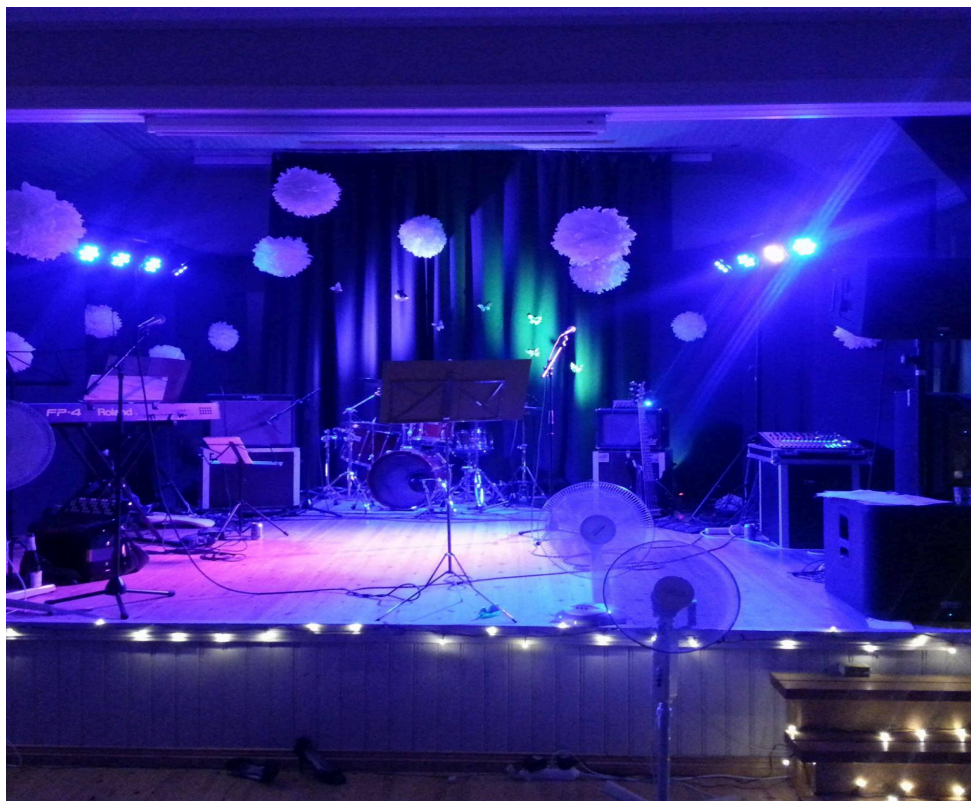
KUVA 2. Hääkeikalta 2013