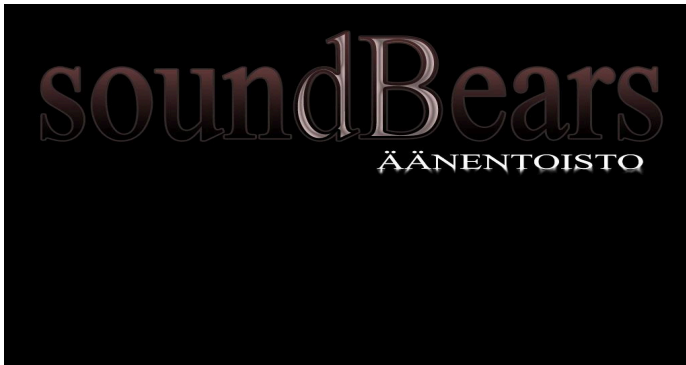
KUVA 8. Aputoiminimen logo

Nämä ilmoitukset olivat maksullisia. Lisäksi yrityksestä piti tehdä ilmoitus myös kaupparekisteriin. Myöhemmin toimialan laajentuessa yritysmuoto muuttui osakeyhtiöksi ja samoin nimi Kattikset Oy:ksi. Tällöin otimme käyttöön myös aputoiminimet, SoundBears (äänentoisto) ja E & H – Logistiikka (kuljetuspalvelut). (KUVA 8). Silloin teimme uudestaan ilmoitukset patentti ja rekisterihallitukselle sekä kaupparekisteriin.