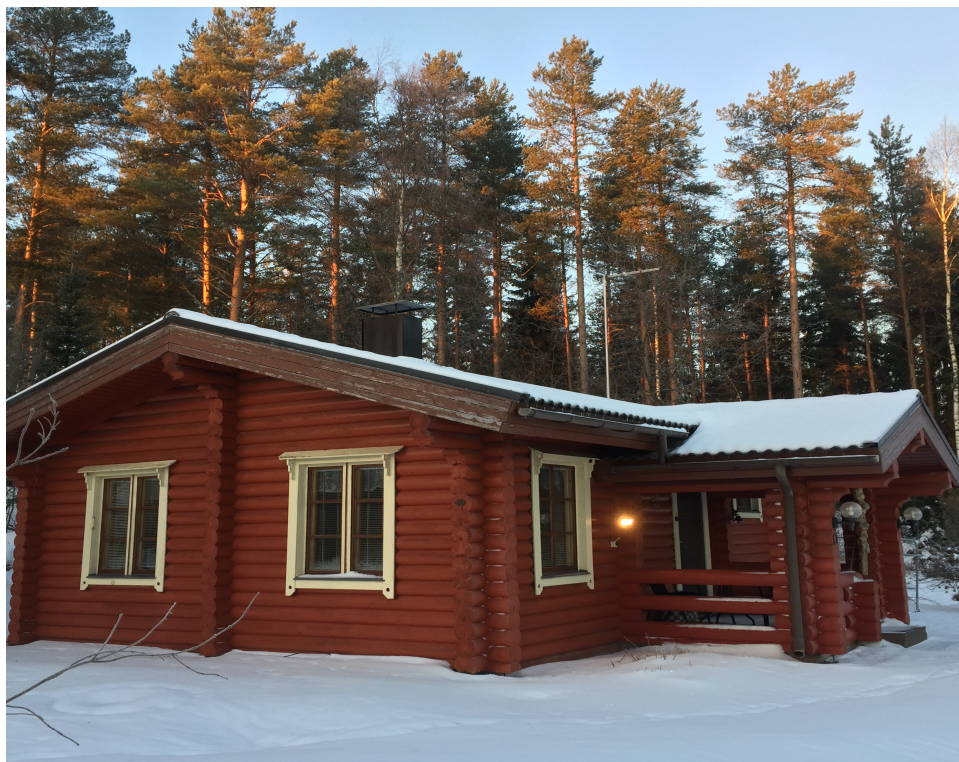
KUVA 3. Vuokramökki 2016