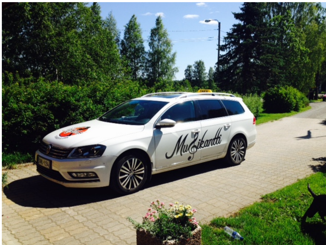
KUVA 5. Taksi 2015