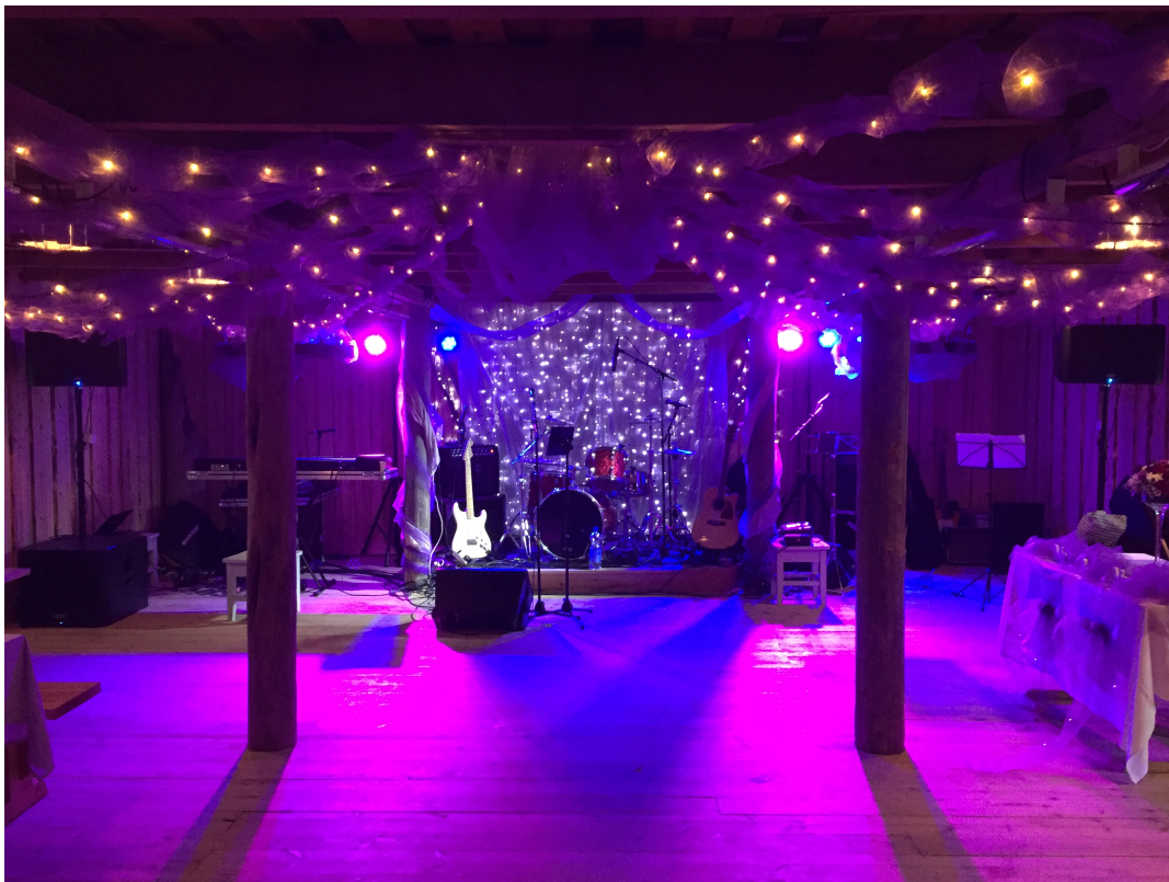
KUVA 7. Hääkeikalta 2016

Tällä hetkellä yrityksemme työllistää yhden henkilön täyspäiväisesti ja mökkikauden ollessa hektisimmillään työtä riittää myös muillekin osakkaille. Äänentoistokalustolle ei ole ollut säännöllistä vuokratuloa siitä lähtien, kun irtisanouduin edellä mainitusta bändistä syksyllä 2015. Yksittäisiä keikkoja on ollut silloin tällöin. Tällä hetkellä viimeistelen musiikkipedagogiopintojani ja olen perustanut itselleni uuden iskelmäbändin, jonka tavoitteena on päästä kiinni ammattikeikkailuun ja säännölliseen tulonlähteeseen musiikista. (KUVA 7). Tämän myötä olemme suunnitelleet bändini kanssa ostavamme äänentoistopalvelut yritykseltäni. Tarkoitus olisi kehittää ja markkinoida yritystä joka saralla. Ainoa huolenaihe on taksialan epäselvä tulevaisuus yhteiskunnassa.