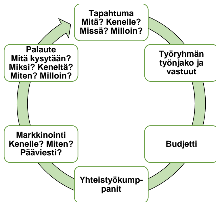
Kuvio 3. Uudistetun suunnittelurungon pääkohdat

Suunnittelurunko on MHAW-toiminnan suunnittelun keskeisin työkalu, mistä syystä sen uudistaminen tässä kehittämissuunnitelmassa oli ensiarvoisen tärkeää. Teemahaastattelun tulosten mukaan vanha suunnittelurunko ei kaikissa kohdissa palvellut tarkoitustaan ja oli monimutkainen ja raskas täyttää. Suunnittelurunkoa selkeytettiin ja yksinkertaistettiin. Uudistetun suunnittelurungon (Liite 6.) toivotaan tukevan tapahtuman suunnitteluprosessin etenemistä aikaisempaa versiota paremmin. Myös itse suunnitteluprosessin etenemistä yksinkertaistettiin ja tehostettiin Suomen Mielenterveysseuran toimesta poistamalla päällekkäisyyksiä ja turhaksi koettuja työvaiheita. Uudistettu suunnittelurunko on taulukkomuotoinen. Kuviosta kolme selviää suunnittelurungon pääkohdat.