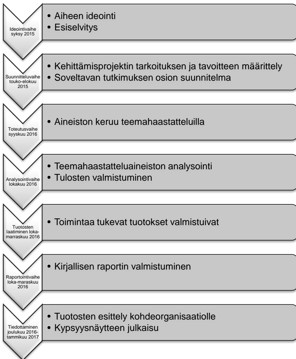
Kuvio 1. MHAW-toiminnan kehittäminen – kehittämisprojektin kulku

Tulokset olivat pohjana kehittämisprojektin tuotoksille. Kehittämisprojektin tuotoksena syntyi kaksi MHAW-toiminnan prosessia tukevaa työkalua. Projektin raportointivaihe oli loka-marraskuussa 2016 ja tiedottaminen joulukuussa 2016 sekä tammikuussa 2017. Kehittämisprojektin kaikki vaiheet on esitetty kuviossa 1.