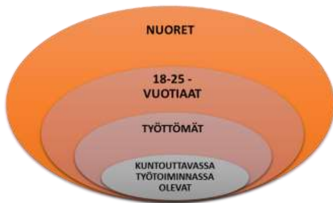
Kuvio 2. Kohdejoukon rajaus.

Tässä opinnäytetyössä tarkastelun kohteena ovat työn ja opiskelun ulkopuolella olevat, työttömät 18–25-vuotiaat nuoret (Kuvio 2). Työttömyyden lisäksi nuoria yhdistää asiakkuus vähintään sosiaali- ja työllisyyspalveluissa. Alle 25-vuotiaat työttömät nuoret ovat usein heikon työmarkkina-aseman vuoksi heikossa taloudellisessa asemassa ja siten riippuvaisia yhteiskunnan tukijärjestelmistä, kuten toimeentulotuesta. Tästä riippuvuudesta seuraa myös velvollisuuksia, kuten osallistua aktivointisuunnitelman laatimiseen yhdessä sosiaali- ja työvoimaviranomaisten kanssa. Siksi valitsin kohdejoukoksi työttömät nuoret, jotka osallistuvat kuntouttavaan työtoimintaan. En määritä heitä esimerkiksi työpajanuorina kuten Hänninen (2014: 122; vrt. Kojo 2012). Aktivointipolitiikan kohteena olevat nuoret ovat identiteetin kannalta kiinnostava kohderyhmä. Kohdejoukkoa määrittävät voimakkaasti yhteiskunnan rakenteet, instituutioiden luokittelut ja erityisesti nuoria koskevat säädökset, joiden mukaan heille on tärkeää ”tehdä jotain”, kuten aktivoida, tukea ja ohjata. Kohdejoukon nuoret ovat tällä hetkellä työttömiä työllisyyspalveluiden asiakkaita, siis yhteiskunnan näkökulmasta työkykyisiä. Tämä huomiona ja erotuksena esimerkiksi työn ja opiskelun ulkopuolisista, sairaslomalla olevista nuorista. On toki mahdollista, että nuoren työkykyä ei ole tutkittu tai työkyvyttömyyttä todettu.