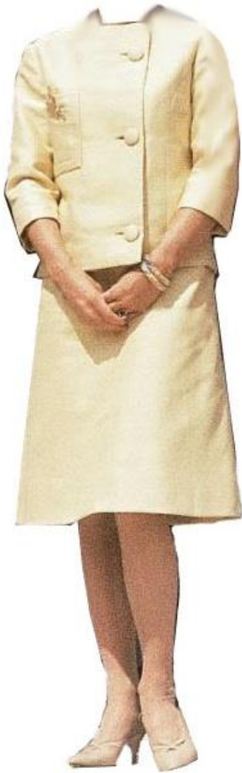
Figur 3 1960-talet 1