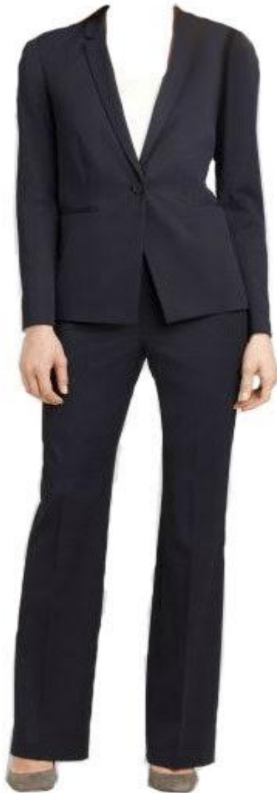
Figur 9 Byxdress

Kläder: Kläderna på denna bild består av en mörkblå byxdress, dvs. raka långbyxor och en sittande men ändå ganska lös kavaj. Kavajen eller byxorna framhäver inte kvinnans former. Kavajen har bara en knapp och axelvadderingar, fastän de inte är så dramatiska. Den har också fickor, vilket gör den ganska praktisk. Färgen är väldigt neutral eftersom den är mörkblå och smälter bra in i massan.