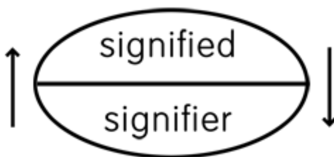
Figur 1 Saussures modell för semiotisk analys

Saussures modell består av två delar, en ” signifierare ” och en ” signifikant ” del. Signifieraren beskrivs som formen av symbolen och den signifikanta är vad symbolen egentligen handlar om. I dagens läge pratar man dock oftast om ”den materiella formen” av symbolen istället för signifieraren . Alla symboler, (t.ex. skyltar) skall ha den materiella formen och den signifikanta delen, annars är skylten meningslös. (Chandler, 2002, s. 17-19) När det gäller Saussures modell, är det viktigt att förstå att ”signifieraren” och den ”signifikanta delen” går hand i hand, som ett tvåsidigt papper. Båda triggas varandra och skapar en upplevelse. Detta koncept är viktigt i reklamer, de behöver dessa två sidor för att reklamen skall differentiera sig från andra reklamer för liknande produkter. (Chandler, 2002, s.21, 25)