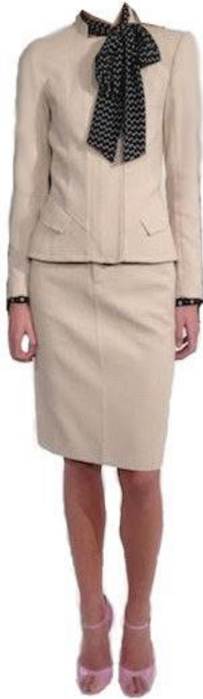
Figur 7 2010-talet 1