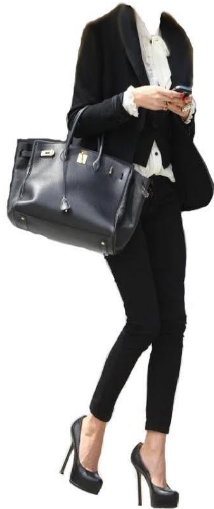
Figur 8 2010-talet 2

Kläder: På första bilden bär kvinnan en kostym som består av en beige, knälång kjol och kavaj. Formen på både kjolen och kavajen är ganska simpel, den framhäver inte direkt former men sitter ändå bra. Kavajen är knäppt enda till halsen. På bild nummer två har kvinnan en mer ledig utstyrsel, hon bär svarta jeans, en svart kavaj och en pryddlig vit skjortblus. Om man tittar väldigt noga på bilden kan man urskilja att hon också bär en svart under kavajen. Jeansen är spända men kavajen sitter lösare och är öppen, vilket gör hela utstyrseln mera intressant för att hennes skjorta och väst syns. Skjortan har volanger både på bröstet men också armarna.