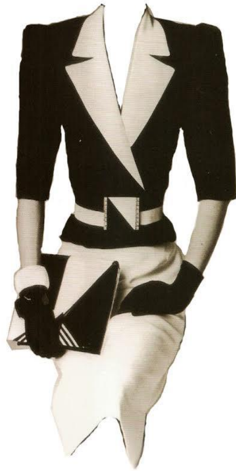
Figur 6 1980-talet 1

Kläder: På den första bilden har kvinnan på sig en jeansfärgad kavaj. Kjolen är av samma material och de tillhör ett och samma set. Kavajen har lite axelvadderingar men inte så dramatiska. Kavajen är ganska formlös och framhäver inte kroppen. Kjolen är också relativt formlös. På bild 2 har modellen en svartvit kavaj och en vit kjol som matchar den vita färgen och materialet på kavajen. Kavajen har väldigt dramatiska axelvaddar och är snäv i midjan, vilket framhäver kvinnans midja. Kjolen är knälång och den också snävare än på den första bilden.