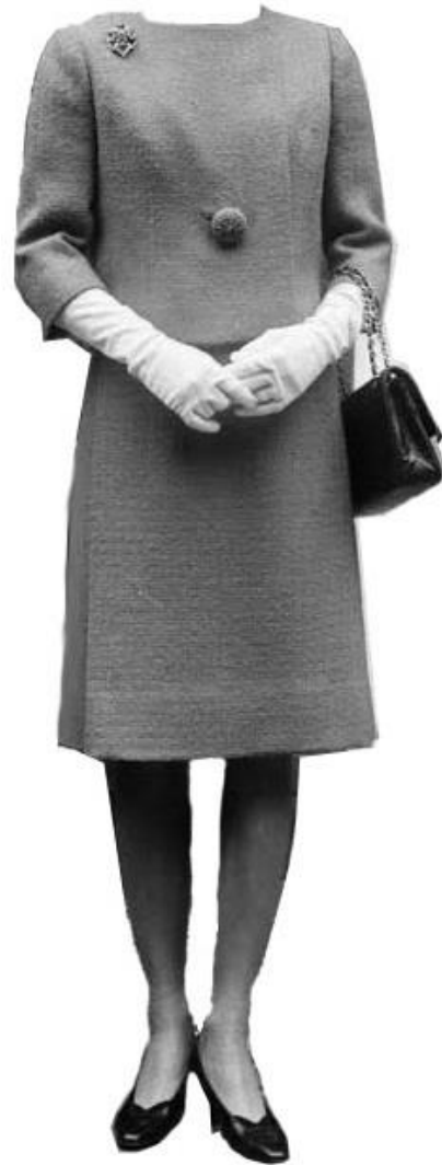
Figur 4 1960-talet 2

Kläder: Kläderna på både bild 1 och 2 är väldigt liknande. På båda bilderna bär kvinnorna en matchande kavaj och kjol. Kjollängden är knä lång och kavajens ärmar \frac{3}{4} av armen. Den första kavajen har tre knappar medan den andra bara en. Kavajerna på båda bilderna är helt klart utan några axelvaddar. Första kavajen är gul och den andra är svår att säga eftersom bilden är svartvit. Jag tolkar kavajen som antingen en väldigt flickig färg som ljusröd, eller en neutral grå. Formerna på kavajerna och kjolarna är enkla men en uppiggande färg på utstyrseln gör den