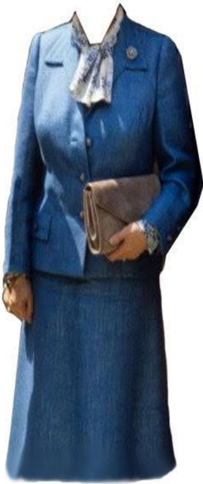
Figur 5 1980-talet 2