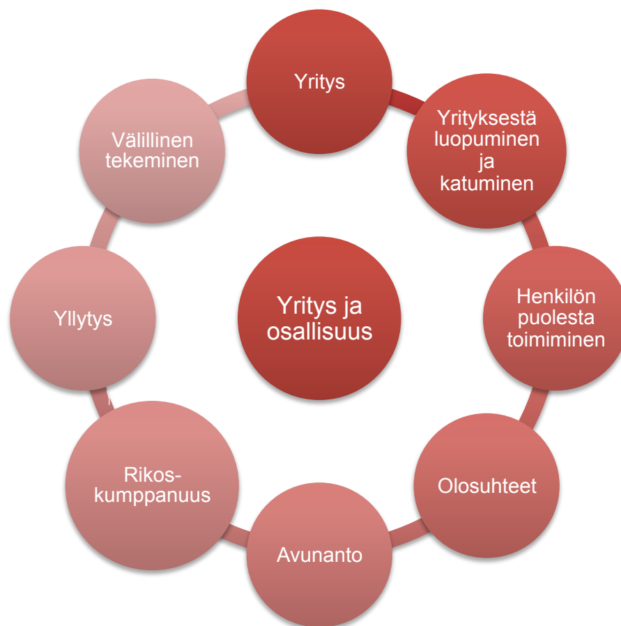
Kuvio 3. Yritys ja osallisuus. (L 19.12.1889/39.)

Kuvio 3 esittää rikoslain viidettä lukua, jossa säädetään yrityksestä ja osallisuudesta rikosvastuuseen. Rikoksen yrityksestä rangaistaan silloin, kun yritys on tahallista rikosta koskevassa säännöksessä säädetty rangaistavaksi. Yritykseksi lasketaan teko, jonka tekijä on aloittanut ja saanut aikaan vaaran rikoksen täyttymisestä. Rikoksen yritys saattaa tulla kysymykseen silloinkin, kun vaaraa ei aiheudu. Mikäli tekijä on vapaaehtoisesti luopunut rikoksen täyttämisestä tai estänyt tunnusmerkistössä tarkoitetun seurauksen syntymisen, ei tekijää rangaista rikoksen yrityksestä. Kaikkia rikokseen osallistuneita rangaistaan rikoksen tekijänä. Henkilöt, jotka taivuttavat toisen henkilön tekemään tahallisen rikoksen, rangaistaan rikokseen yllyttämisestä ja henkilöt, jotka ennen rikosta tai sen aikana auttavat neuvomalla tai muilla tavoin tekijää toteuttamaan rikoksen rangaistaan avunannosta. Välillinen tekeminen on myös rangaistava teko. Tällöin tekijä tuomitaan rikokses-