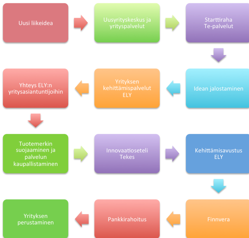
KUVIO 3. Aloittavan yrityksen kehittyminen ja mahdolliset tukitoimet (Marttila 2016)

Kuten edellisissä kappaleissa todettiin, uuden yrityksen perustaminen vaatii monenlaisia toimia ja suunnitelmia. Asioiden kanssa ei kuitenkaan tarvitse olla yksin ja moniin yrityksen perustamisessa kohdattaviin ongelmiin on saatavissa apua ja opastusta. Kuvion 3 mukainen aloittavan yrityksen kehitymis- ja tukitoimikaavio pohjautuu Sari Marttilan seminaariesitykseen Pk-yrittäjän ja start-up yritysten rahoitusmahdollisuudet (10.11.2016, 3) Savonia ammattikorkeakoulun järjestämässä Ideoi-Testaa-Tee Kauppaa seminaarissa Kuopiossa. Kuvio 3 esittää loogisen polun ja eri tukitoimimahdollisuudet joita aloittavalla yrityksellä on käytössään.