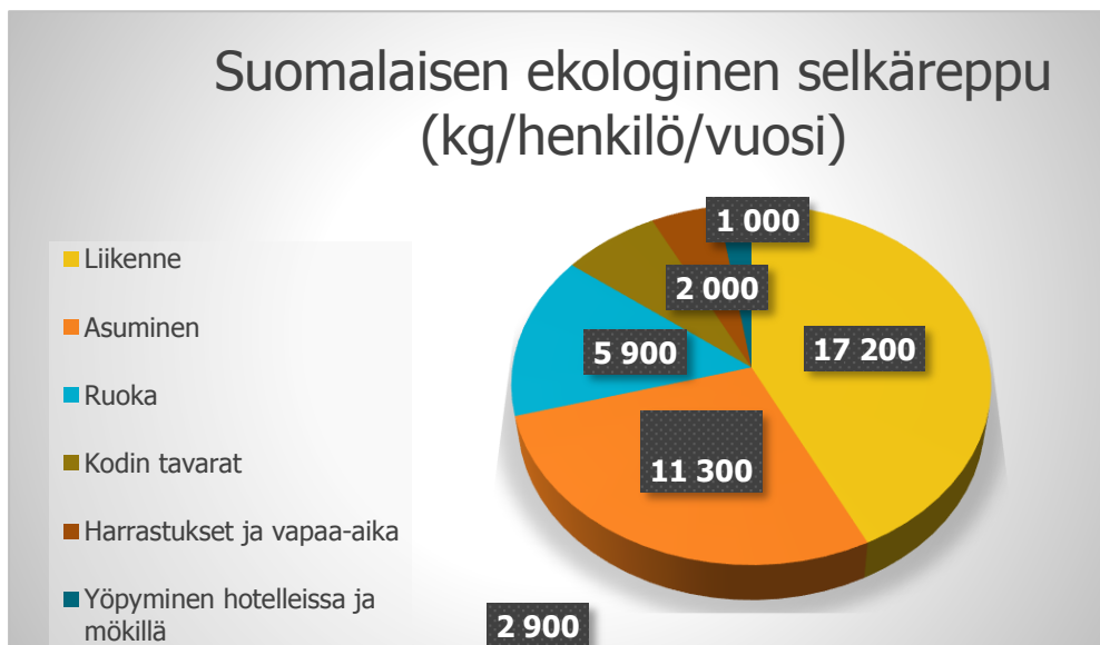
KUVIO 2. Keskivertosuomalaisen ekologinen selkäreppu vuodessa. (Portio ym. 2008, 119.)

Kuviossa 2 on esitetty keskivertosuomalaisen kiinteiden luonnonvarojen kulutus eli ekologinen selkäreppu vuodessa, mikä osoittaa kuinka monta kiloa yksi henkilö on kuluttanut vuoden aikana luonnonvaroja eri toiminnoissa (Koski 2008, 119). Ekologinen selkäreppu ottaa huomioon luonnonvarojen- ja energiankulutuksen tuotteen kaikissa vaiheissa kuljetuksesta loppukäsittelyyn (Tieteentermi-pankki.fi). Kuten kuviosta huomataan, liikenne aiheuttaa suuren osan kotitalouden ekologisesta selkäreppusta. Tässä kaikki liikenne on laskettu yhteen. Osa siitä kuuluu matkailuun, osa matkoihin kotoa töihin, harrastuksiin ja ostoksille. Yhdessä ruoka, asuminen ja liikenne ovat kolme suurinta ympäristövaikutusten aiheuttajaa kaikkien yleisestikin käytettyjen mittaustapojen perusteella. Yksi huomionarvoinen seikka on, että kodin tavarat yhdessä harrastusten ja vapaa-ajan kanssa muodostavat vain vajaan viidesosan keskivertosuomalaisen ekologisesta selkäreppusta.