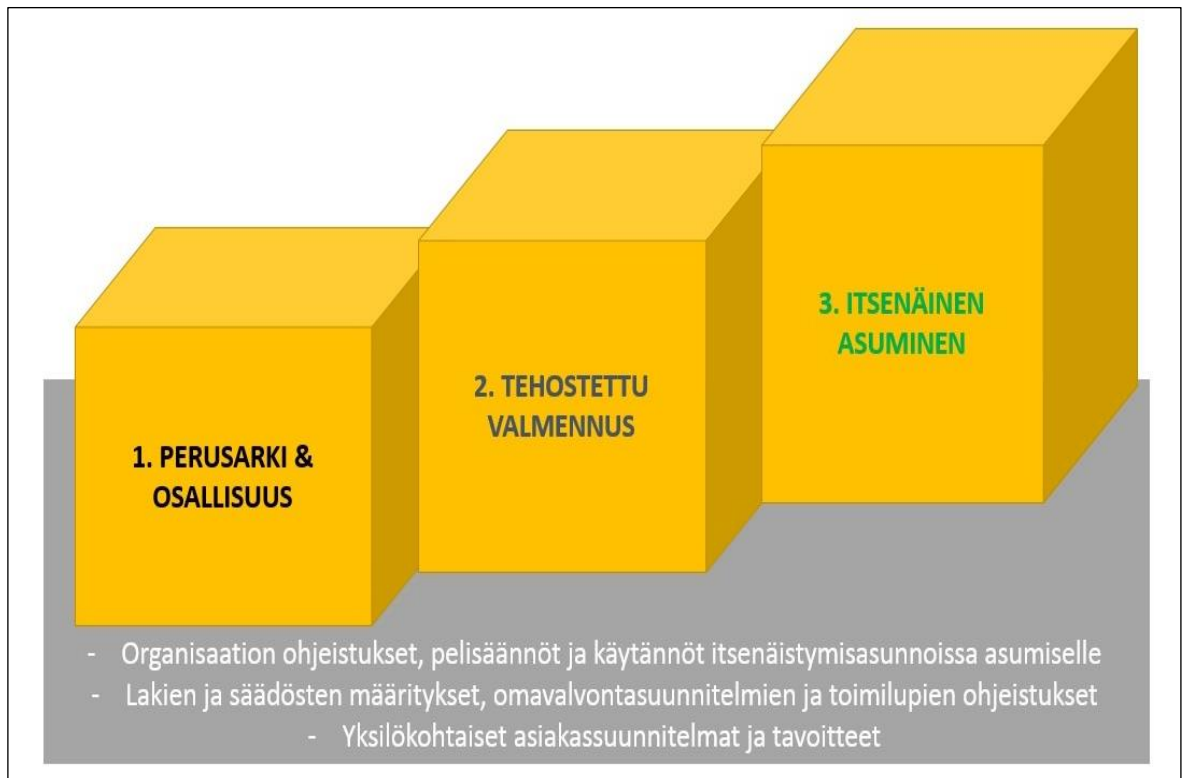
Kuvio 3. Itsenäistymisvaiheen 3-portainen malli.

Alkukartoituskyselyn vastausten pohjalta pohdin järkevää tapaa jaotella tulevat työkokoukset teemoittain eri kehittämiskohtiin. Vastauksista oli huomattavissa selkeästi kaksi kehitettävää osa-aluetta: organisaation yhteisten pelisääntöjen ja työnjaon epäselvyys sekä yksilöllisesti riittävän tuen varmistaminen itsenäistyville nuorelle.