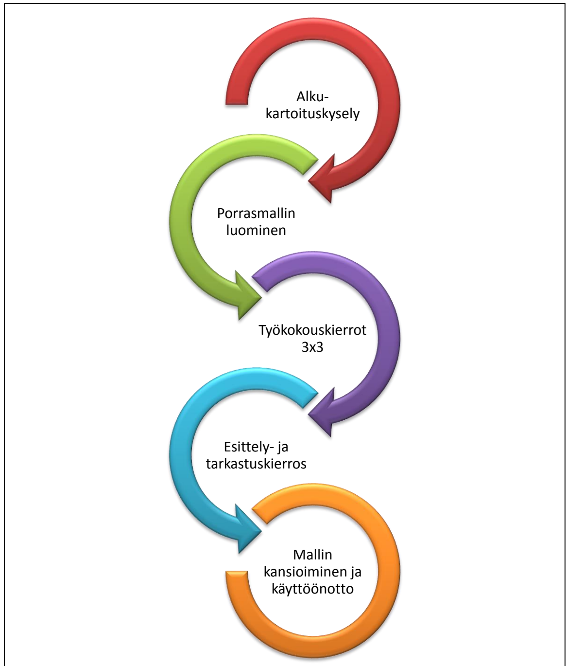
Kuvio 1. Kehittämisprosessin vaiheet.

Edellä olevassa kuviossa on esitetty varsinaisen kehittämistehtävän toiminnan vaiheet etenemisjärjestyksessä. Toimintaa on edeltänyt tietenkin suunnitteluvaihe ja kuvion viimeisen mallin käyttöönoton vaihetta tulee organisaatiossa seuraamaan mallin toimivuuden seurantavaihe. Läpi kuvatun kehittämisprosessin olennaista on