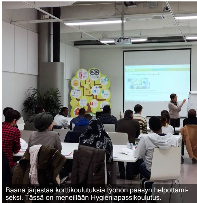
Baana järjestää korttikoulutuksia työhön pääsyn helpottamiseksi. Tässä on meneillään Hygieniapassikoulutus.

Baana-hankkeessa luomme uutta tietoa, osaamista ja asiantuntemusta kentälle. Jotta pysyt Baanalla mukana, tykkää meistä Facebookissa – Baanalla on jo lähes seitsemänsataa tykkääjää.