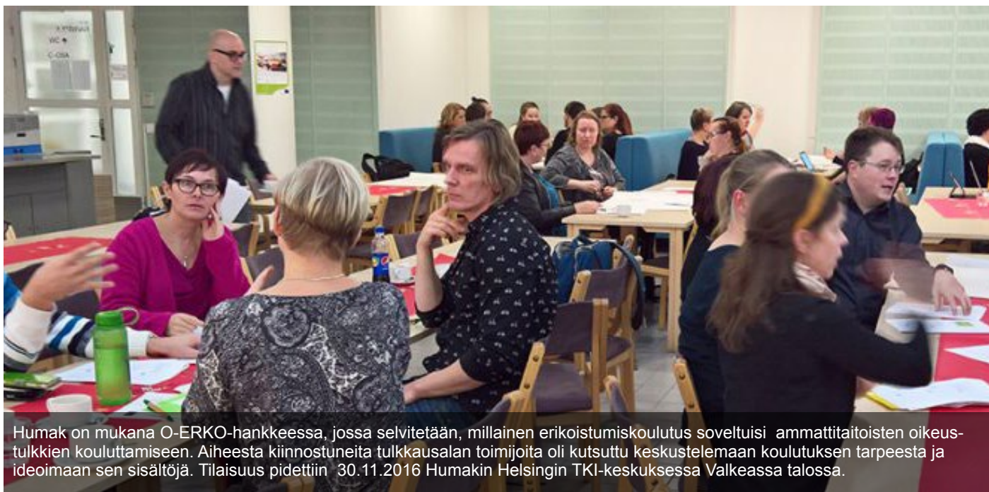
Humak on mukana O-ERKO-hankkeessa, jossa selvitetään, millainen erikoistumiskoulutus soveltuisi ammattitaitoisten oikeustulkki kouluttamiseen. Aiheesta kiinnostuneita tulkkausalan toimijoita oli kutsuttu keskustelemaan koulutuksen tarpeesta ja ideoimaan sen sisältöjä. Tilaisuus pidettiin 30.11.2016 Humakin Helsingin TKI-keskuksessa Valkeassa talossa.

Humakin yhtenä vahvuusalana on tulkkaus ja kielellinen saavutettavuus. Kommunikaatiotilanteessa tulkilta vaaditaan monia taitoja, esimerkiksi oikeustulkkaukseen liittyviä erityistaitoja. Erikoistumiskoulutukset ovat korkeakoulututkinnon jälkeen suoritettavaksi tarkoitettuja, jo työelämässä toimineille suunnattuja ammatillista kehittymistä ja erikoistumista edistäviä koulutuksia. Olemme tekemässä ilolla yhdessä työelämän asiantuntijoiden, tekijöiden ja kokijoiden kanssa oikeustulkkauksen erikoistumiskoulutusta.