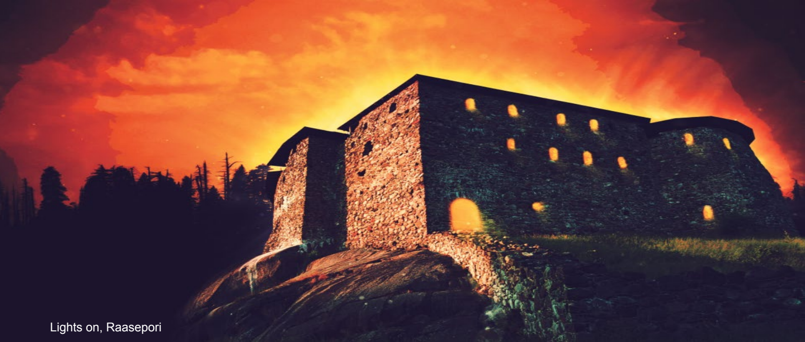
Lights on, Raasepori