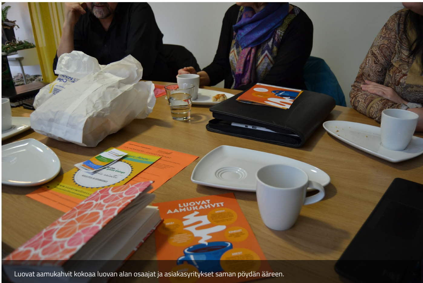
Luovat aamukahvit kokoaa luovan alan osaajat ja asiakasyritykset saman pöydän ääreen.

Humak toteuttaa Etelä-Karjalassa ja laajemminkin Kaakkois-Suomessa Humakin valtakunnallista tehtävää. Humakilla on kampusten ulkopuolisia vastavia TKI-toimistoja myös Tampereella, Joensuussa ja Kemissä. Vahvistuvien maakuntien Suomessa näillä humakilaisilla verkostoilla saattaa olla jatkossa entistäkin suurempi merkitys.