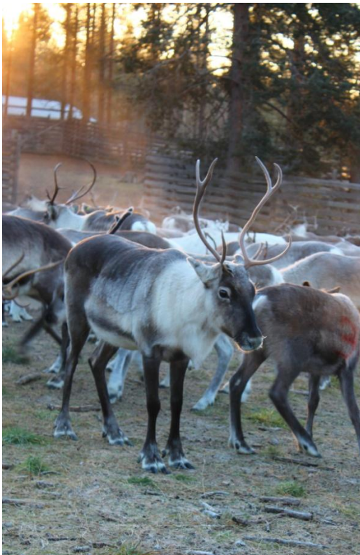
Kuvio 1. Poro

Suomalainen poro polveutuukin tunturipeurasta. Poro on pitkäraajainen ja nelivarvainen hirvieläin (kuvio 1). Pääsääntöisesti vaatimien elopaino on 60-90 kiloa. Hirvaiden, sekä kuohittujen härkien elopaino voi vaihdella 70 kilosta 160 kiloon. Poro on sopeutunut pohjoisen olosuhteisiin hyvin, sillä se kestää lämpötilojen vaihteluita. Poro on myös yksi Lapin tärkeimmistä tunnuselementeistä. (Poro esite 2015, 3-7.)