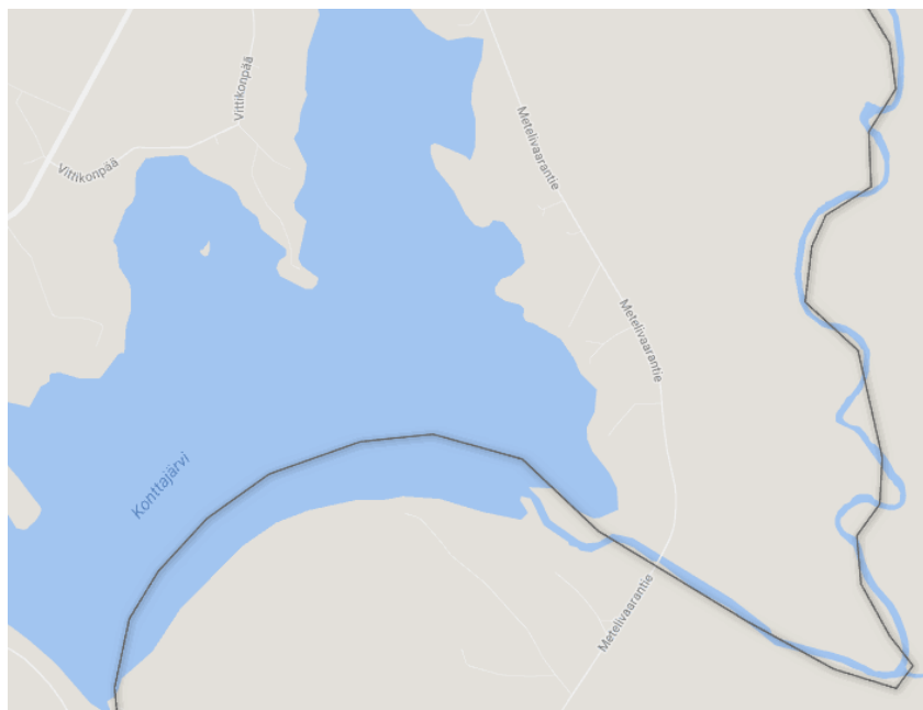
Kuvio 6. Palojärven ja Orajärven välinen raja (Paliskuntain yhdistys 2016i)

Kuitenkaan kaikkialla rajat eivät ole epäselviä. Esimerkiksi rajat voivat olla luonnonmukaisia ja kulkea jokea pitkin (kuvio 6). Näin ne ovat tarkasti tiedossa ja maastossa helppoja määrittää.