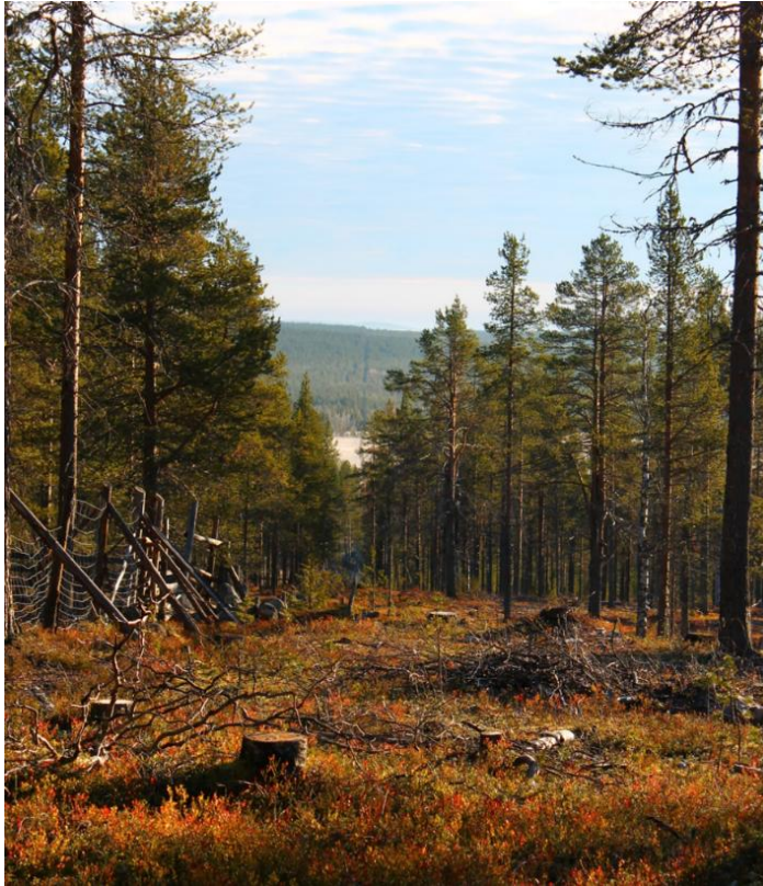
Kuvio 4. Poikajärven ja Syväjärven välinen raja-aita Liittovaarassa

Esteaitoja on myös valtakuntien välillä. Poroaidat on rakennettu Venäjän ja Norjan vastaisille rajoille. Niiden tarkoituksena on tukea porojen paimennusta, sekä estää porojen kulkeminen valtakunnan rajojen yli. Valtakunnan rajoilla olevien poroesteaitojen kunnossapidosta ja peruskorjauksesta vastaa paliskuntain yhdistys maa- ja metsätalousministeriön toimeksiannosta. Norjan kanssa aidan kunnossapito on jaettu kunnossapidon vastuualueiden mukaisesti. Venäjän vastaisella rajalla kunnossapidosta ja rakentamisesta vastaa Suomi. Aitaa Norjan vastaisella rajalla on 450 kilometriä ja Venäjän vastaisella 750 kilometriä. Aidat perustuvat maiden välisiin valtiosopimuksiin. Kustannukset maksetaan poronhoitolain (848/1990) 39.3 §:n mukaisesti valtion varoista. (Paliskuntain yhdistys 2016f.)