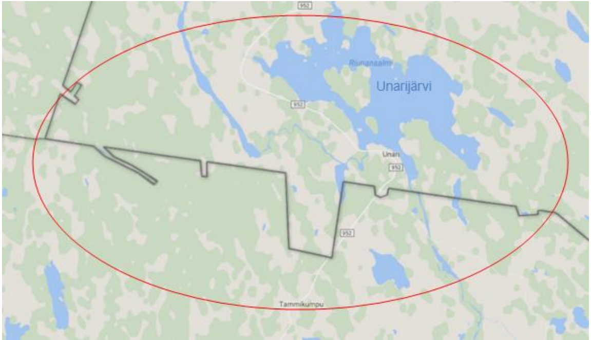
Kuvio 5. Poikajärven ja Syväjärven välinen raja (Mukaillen Paliskuntain yhdistys 2016i)

Rajakuvauksia lukiessa ja karttaa vertaillen huomasi erilaisia paikkoja, joissa rajan kulku on epäselvä tai kuvauksessa ja kartassa on poikkeama. Poikajärven ja Syväjärven välisessä rajakuvauksessa on poikkeama Paliskuntain yhdistyksen kartan suhteen (kuviot 5).