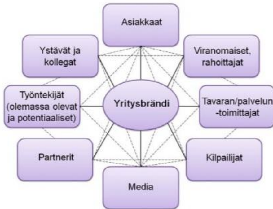
Kuvio 3 Yrityksen sidosryhmiä (Sandbacka 2010, 36.)

Usein ajatellaan, että mitä enemmän yritys verkostoituu, sana leviää ja logo näkyy, sen parempi se on markkinoinnillisesti. Periaatteessa asia onkin näin, mutta pelkän logon tai viestin levittäminen ei riitä, jos kukaan ei huomaa viestiä. Käytännössä asia saattaa siis olla toinen. Sen vuoksi myös verkostoitumisessa kannattaa miettiä omaa kohderyhmää, ja tätä kautta viesti saadaan helpommin kohdistettua omalle kohderyhmälle, jolle viesti on suunniteltu. (Rope 2011, 143-144.)