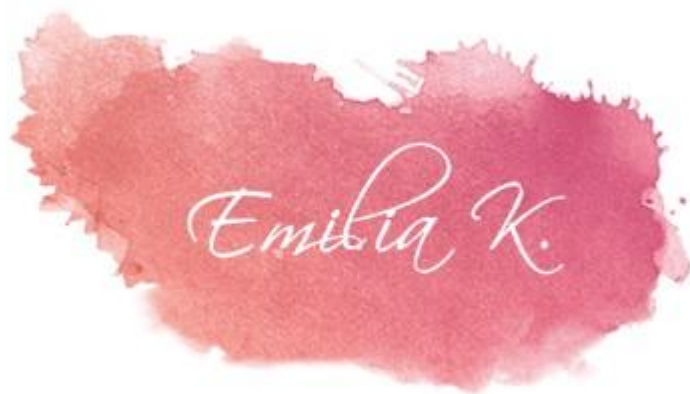
Kuvio 4 Yrityksen Emilia K. logo (Karjalainen 2017.)

Kokonaisvaltaisessa viestinnässä puhutaan myös visuaalisen ilmeen tärkeydestä. Toimeksiantaja on jo ottanut tämän huomioon kotisivuillaan (kuvio 5) ja logossaan (kuvio 4). Toimeksiantajalla oli tästä selkeä visio ja sitä kunnioitettiin, sillä silloin se tulee toimeksiantajasta itsestään ja näin ollen hänen on helppo jatkaa samalla visuaalisen ilmeen linjalla muissakin kanavissa. Suosittelen toimeksiantajaa käyttämään logoaan kotisivujen lisäksi yrityksen Facebook-sivuilla, muissa sosiaalisen median palveluissa, mahdollisissa käyntikorteissa sekä muissa yrityksen materiaaleissa. Logo on uniikki ja sen lisääntynyt tunnettavuus voi tuoda yritykselle lisäarvoa, jolloin toimeksiantajani voi veloittaa valmennuksistaan enemmän.