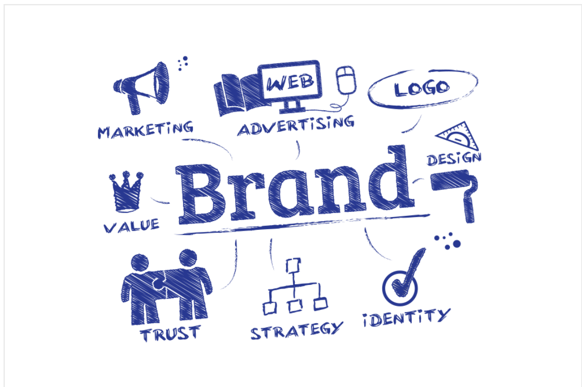
Kuvio 1 Brändi (Parker 2014.)

Puhuttaessa mikroyrityksistä ja brändäyksestä, koetaan asia erittäin hankalaksi ja vain isojen yritysten asiaksi. (Sandbacka 2010, 7.) Näin ei kuitenkaan ole. Yrityksen brändin luominen on yksi menestystekijä myös pk-yrityksissä: mitä vahvempi brändi, sitä varmemmin yritys tulee menestymään. Brändi ei ole ainoastaan tuote tai logo, vaan siihen liittyy myös paljon symboliikkaa (kuvio 1). Brändi on suhde asiakkaaseen ja lupaus jostakin, hyvällä brändillä voitetaan asiakkaiden uskollisuus. (Kotler & Armstrong 2004, 291.) Lisäksi hyvä yrityskuva toimii niin ikään suojakilpenä monia ulkoisia uhkia ja epäonnistumisia vastaan. (Icén 2015.)