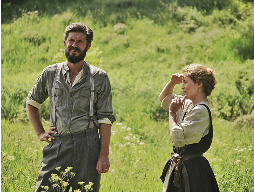
Figur 2. Ikitie, Matila Röhr Productions Oy, 2017 (Yle 19.7.2016)

Filmen Ikitie baserar sig på en bok av Antti Tuuri med samma namn. Inspelningarna skedde under sommaren 2016 och en del i januari 2017. Ikitie är en del av Finland 100-projektet, och har premiär hösten 2017. (MRP 2017) Filmens budget var ca 2,38 miljoner euro vid det skedet att understöd ansöktes från SES varav understöd från SES 800 000 euro (SES 2015).