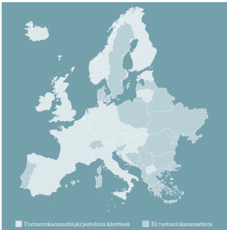
Figur 1. Produktionsincitament i Europa. (Audiovisual Finland 2017b)

Incitamentet är ett offentligt finansierat understöd med vilket man vill locka främst utländska produktioner eller internationella samproduktioner att göra sina produktioner, helt eller delvis, i landet som erbjuder produktionsincitamentet, och på så sätt öka landets omsättning och statens skatteinkomster. Olika versioner av produktionsincitament finns redan i flera länder världen över, i 19 länder i Europa år 2016, och nu även i Finland. (UKM 2016) Enligt rapporter har produktionsincitamentet i samtliga länder där det finns i bruk gett goda resultat (Audiovisual Finland 2017b). Figur 1 visar vilka länder inom Europa som har ett produktionsincitament i bruk. De ljusa områdena visar länder som har ett produktionsincitament, och de mörka områdena länder som inte har. (Audiovisual Finland 2017b)