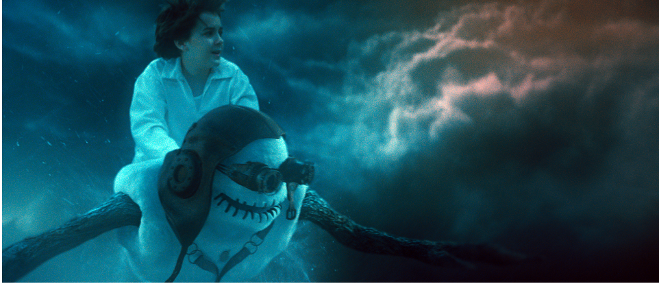
Figur 3. Imaginaerum by Nightwish, Solar Films 2012 (Solar Films 2017)

Solar Films produktion Imaginaerum by Nightwish (2012) är en fantasifilm där musiken och den digitala världens spelar en stor roll. Filmen gjordes som en samproduktion med Kanada, där Solar Films fungerade som minoritetsproducent (SES 2011). Filmen hade en helhetsbudget på ca 2,7 miljoner euro. Den finska andelen av budgeten var 897 000 € varav understöd från SES 430 000 €. Helle berättar i en intervju för Sini Jääskeläinens examensarbete att det slutligen blev endast några hundra tusen euro av budgeten kvar i Finland, och konstaterar att det är helt absurt att finansieringen från filmstiftelsen, kanalen och Nightwish spenderas utomlands, men de enda pengarna som stannar i Finland är i princip regissörens lön och rättigheterna till själva filmen. (Jääskeläinen 2013, s. 14-17)