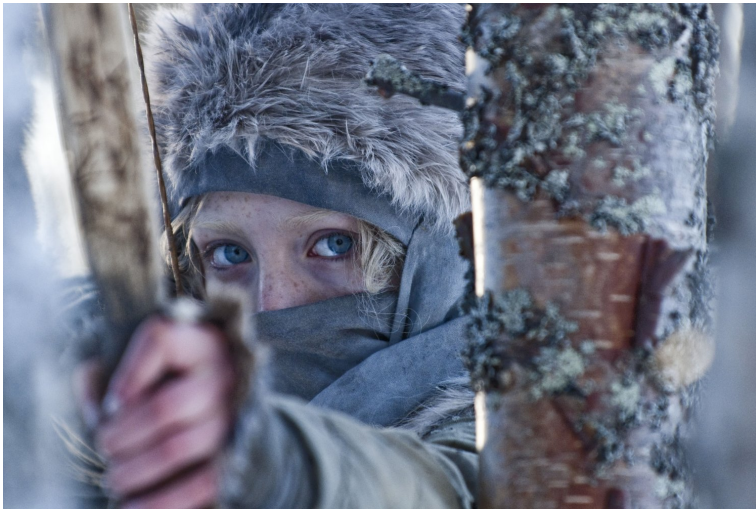
Figur 4. Hanna , Focus Features 2011 (IMDb 2017a)

He kuvasivat viisi päivää ja alueelle jäi hieman alle miljoona euroa. Eikä siinä ei ole laskettu edes kerrannaisvaikutuksia, eli se on ihan puhtaasti kaikki mitä tuotanto käytti rahaa alueella. Jos meilläkin olisi ollut tällainen kannustinjärjestelmä, niin tuotannolla olisi ollut kiinnostusta kuvata pidempäänkin. (Anne Laurila, citerat efter Yle 10.3.2011)