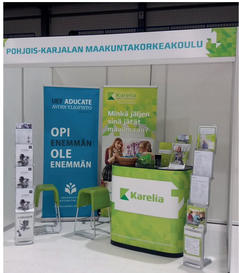
Pohjois-Karjalan maakuntakorkeakoululla oli oma osasto Pielisen Messuilla.

Mervi Leminen maakuntakorkeakoulukoordinaattori