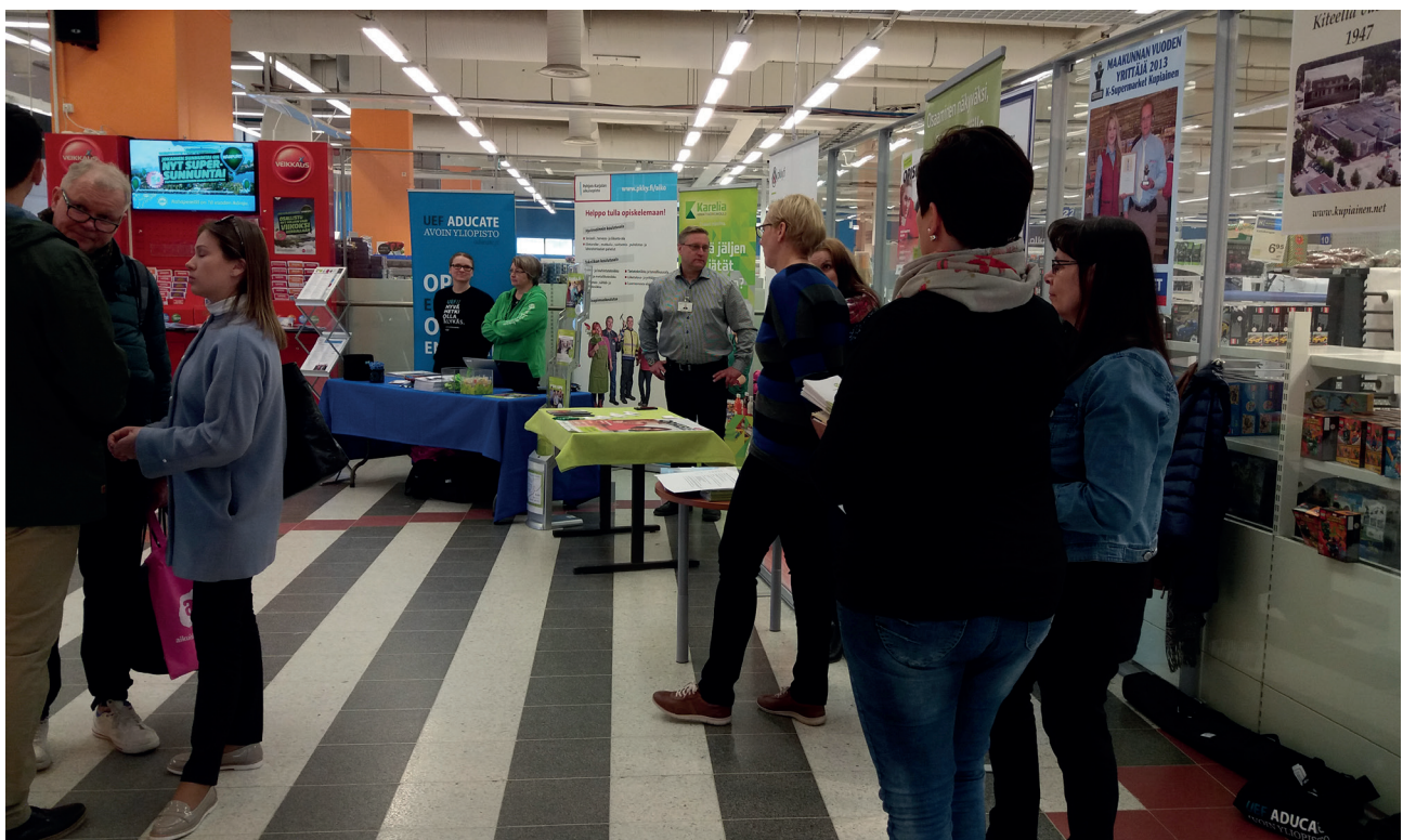
Koulutusohjaus jalkautui kauppakeskukseen Kiteellä.