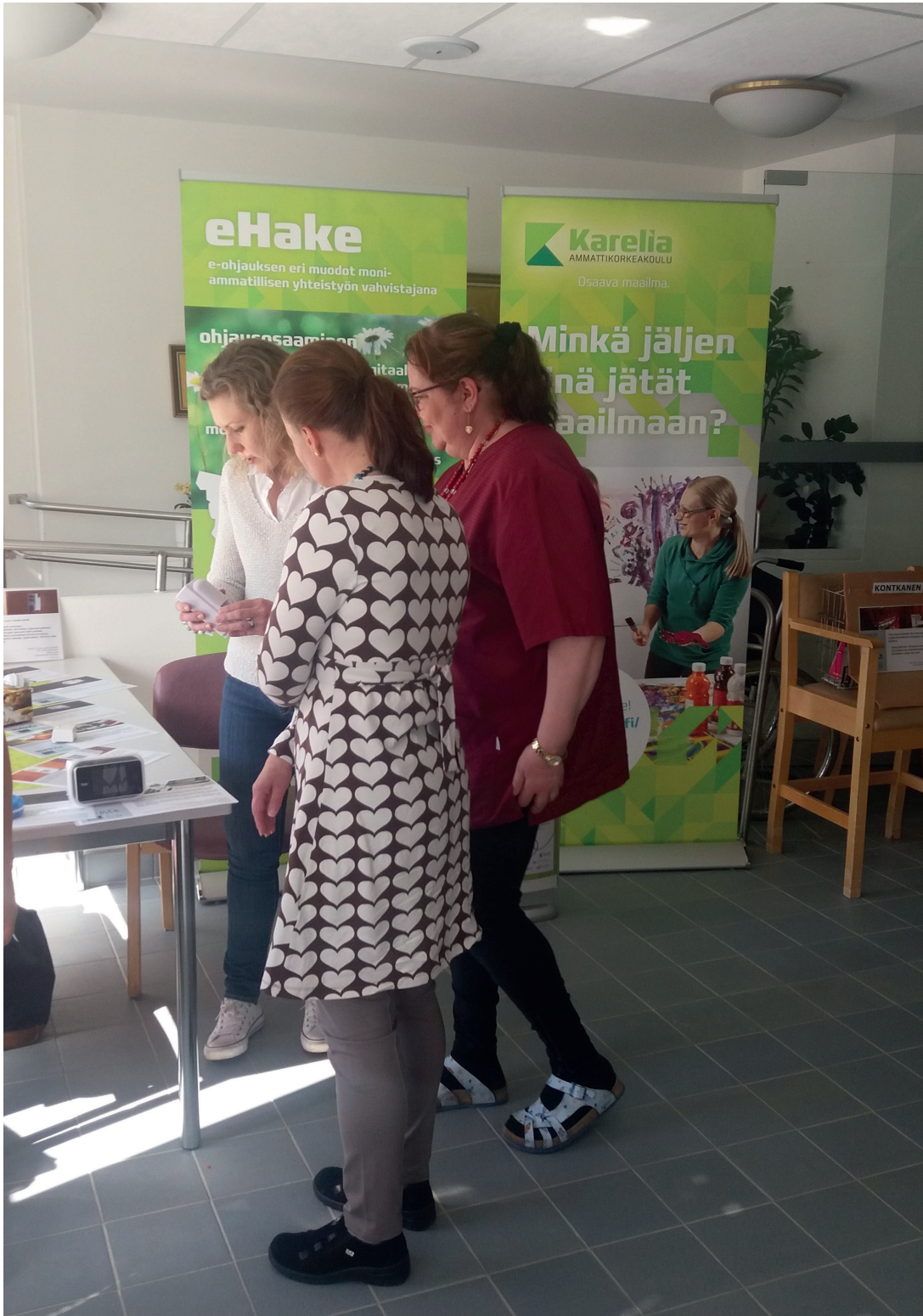
Karelia-amk:n terveystalon opettaja keskustelemassa Lieksan terveystalon henkilöstön kanssa ikäihmisille saatavilla olevista arjen apuvälineistä.