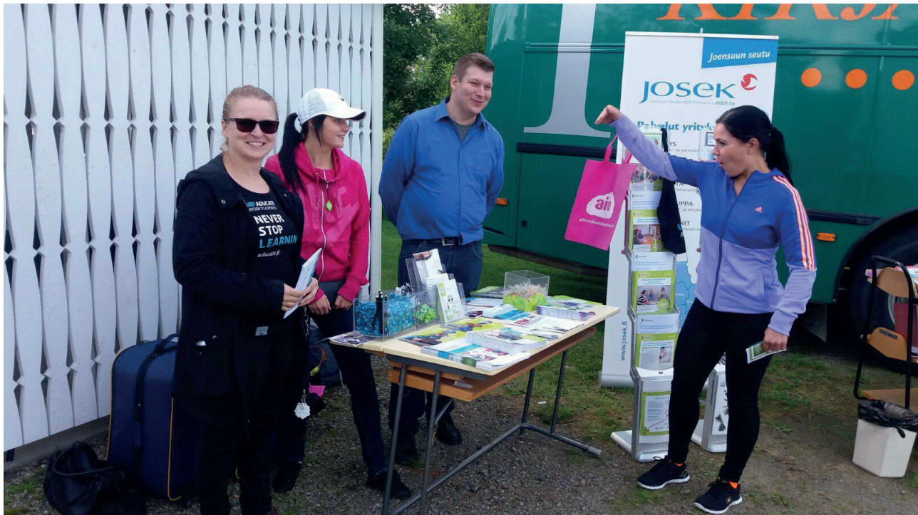
Avoimet korkeakouluopinnot tarjoavat mahdollisuuden joustavaan ja paikkariippumattomaan opiskeluun. Kuva on koulutustori-tapahtumassa Iloantsista.

Tällä hetkellä on käynnissä avoimen amk:n sosionomipolkuopinnot. Lisäksi maakunnassa toteutettiin sosiaalialan ja informaatiotutkimuksen avoimia yliopisto-opintoja. Sosiaalialan opinnot järjestettiin Itä-Suomen yliopiston tutkinnon mukaisesti. Järjestäjinä toimivat Pohjois-Karjalan kesäyliopisto ja Nurmeksien lukio. Lisäksi Pohjois-Karjalan Kesäyliopistolla toteutettiin Informaatiotutkimuksen perus- ja aineopintoja (Oulun yliopiston tutkinnon mukaisesti).