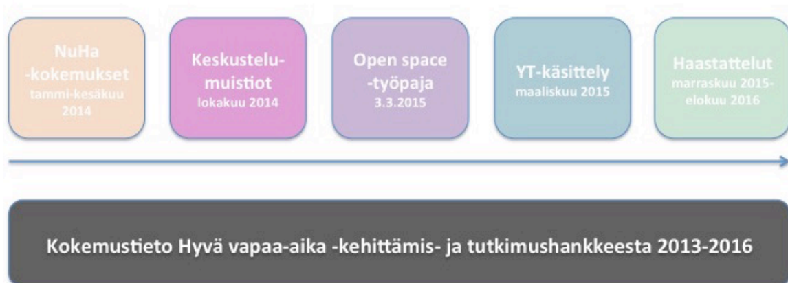
Kuva 1 Opinnäytetyön aineisto kuvana.