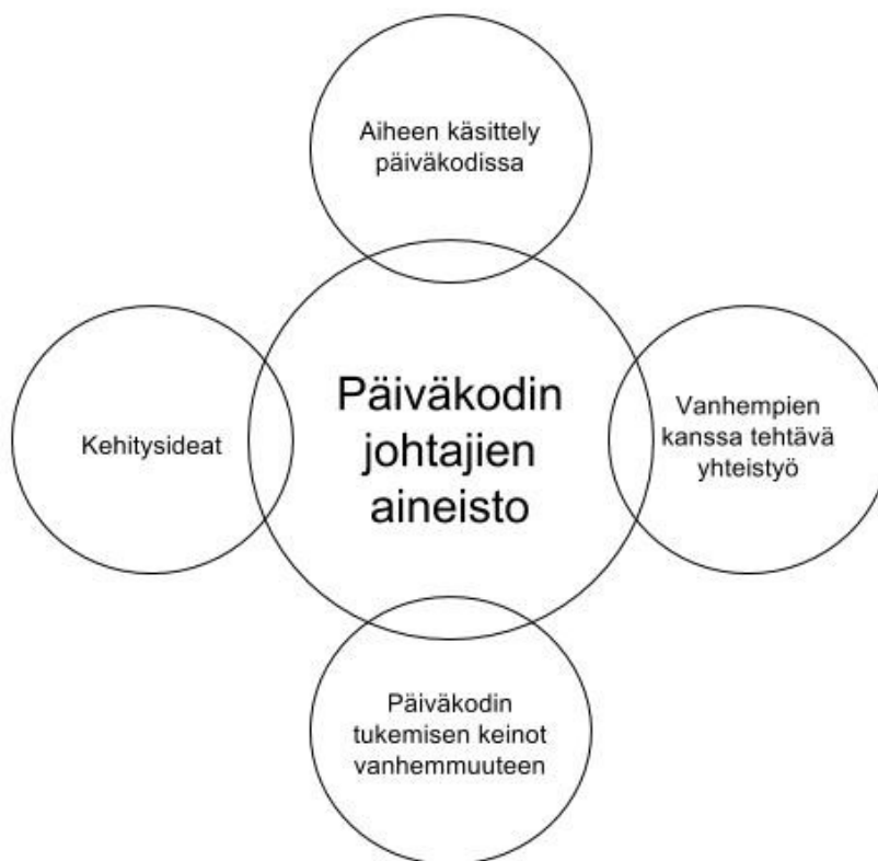
Kuvio 2. Päiväkodin johtajien aineistosta nousseet teemat

Päiväkodin johtajien aineistoon liittyviä teemoja muodostui neljä: aiheen käsittely päiväkodissa, vanhempien kanssa tehtävä yhteistyö, päiväkodin tukemisen keinot vanhemmuuteen sekä kehitysideat.