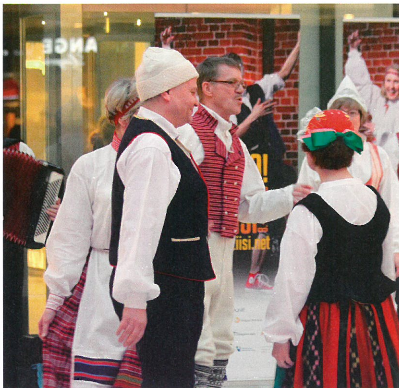
Kansantanssiväki ympäri Suomea järjesti flashmob-esityksiä helmikuun 5. päivä kansantanssin riemuvuoden kunniaksi. Kuvat Helsingistä ja Tampereelta.