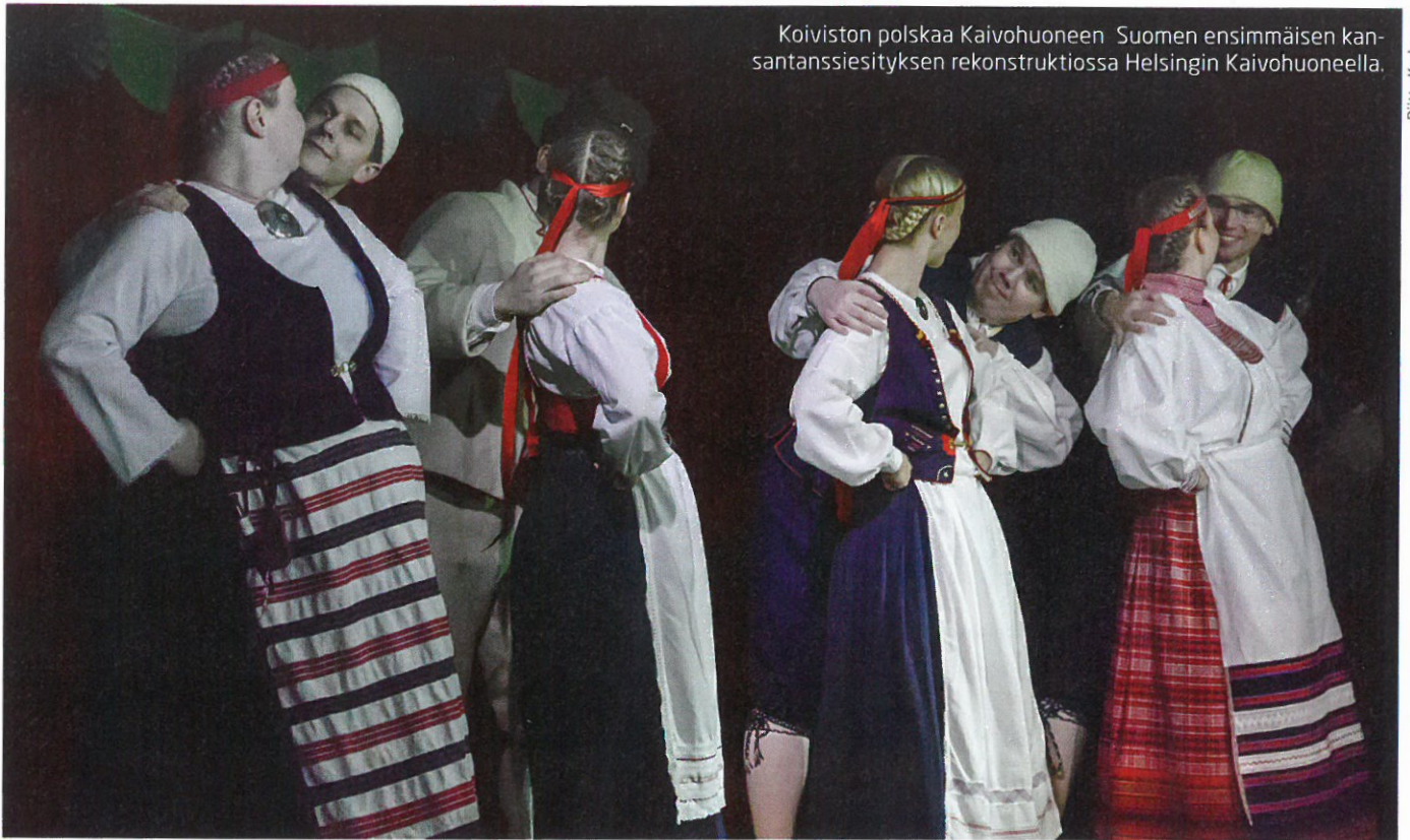
Koiviston polskaa Kaivuhuoneen Suomen ensimmäisen kansantanssiesityksen rekonstruktiossa Helsingin Kaivuhuoneella.