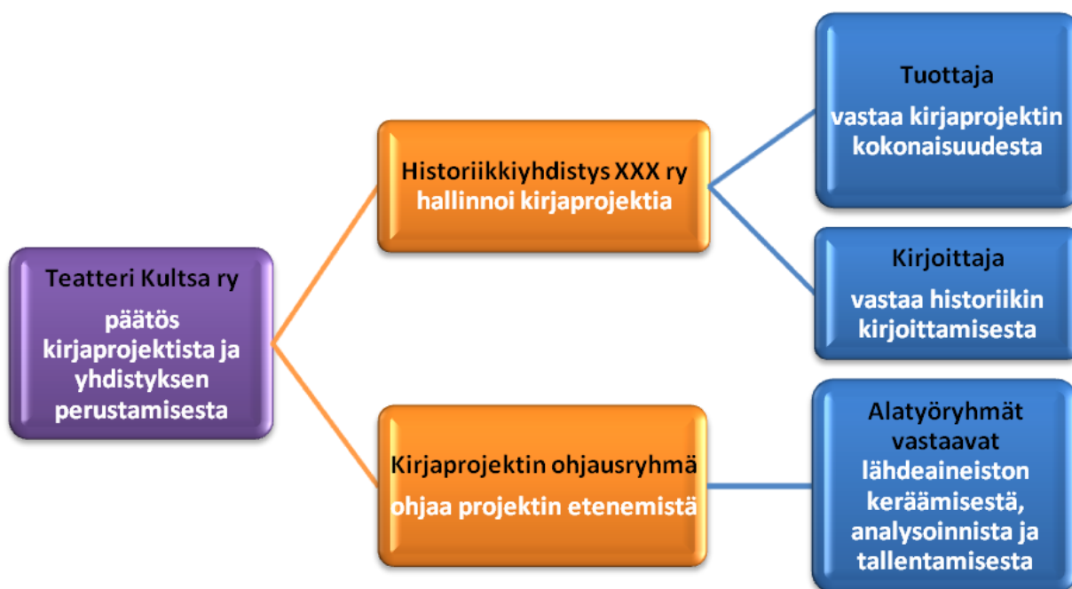
Kuva 1 Kirja projektin organisaatiossa on useita toimijoita.

Kirja projekti vaatii erillisen organisaationsa, koska kyseessä on suuri, lähinnä teatteriharrastamisen taustalla tapahtuva työ, joka ei liity suoranaisesti teatterin normaalin toimintaan eli teatterintekemiseen ja näytelmien saattamiseen esitykseen. Kirja projektiin mukaan tulevat teatterin jäsenet sitoutuvat määrääjäksi kirja projektin tavoitteisiin, aikatauluihin ja tehtävään työhön. Heidän pitää siis ottaa huomioon työn vaatima ajankäyttö muussa teatteriharrastamisessaan ja elämässään. Kirja projektin tuottaja ja kirjoittaja sitoutuvat projektiin sen edellyttämällä tavalla ja sillä työpanoksella kuin projekti vaatii ja on sovittu.