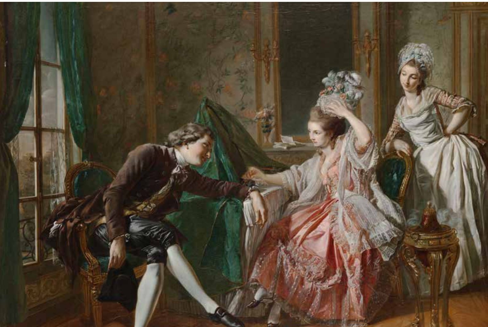
Kuva 4. 1700-luvun Ranskan hovin pukeutumista

Pukeutumisessa maskuliinisuutta viestitään siluettien lisäksi kankailla. Erilaiset ruudut ja raidat viestivät maskuliinisuudesta järjestyksen ja muuttumattomuuden kautta.