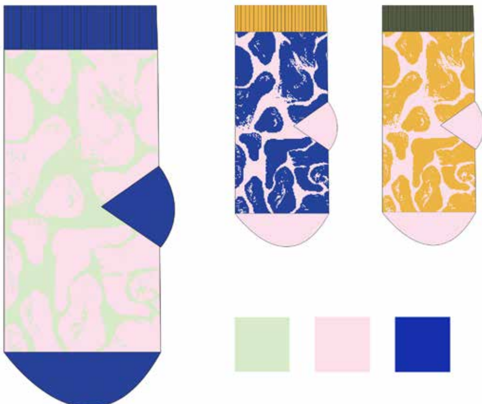
Kuva 17. (viittaus s. 21) Tasokuvat ja väri vaihtoehdot