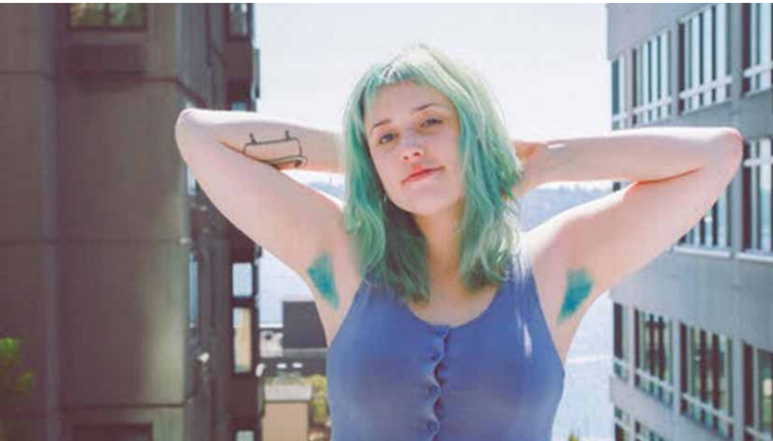
Kuva 7. Länsimaisia sukupuolinormeja kainalokarvoillaan rikkova nuori nainen

Markkinatalous ja media ovat tahoja, jotka sinnikkäästi pitävät kiinni sukupuolijaottelusta ja ylläpitävät totuttuja rooleja, symboleja ja konnotaatioita eli mielle yhtymiä. Ihmissyyden ja sukupuolisuuden stereotyyppit ja yksinkertaistukset ovat usein median keinoja herättää ihmisissä tunteita ja mielikuvia. Stereotyyppinen vastakohtainen asettelu on myös vahva osa heteroseksuaalisuutta, jota usein hyödynnetään mainonnassa. Sukupuolisidonnaistamalla tuotteita tavoitellaan suurempia myyntilukuja ja enemmän voittoa. (Yle uutiset, 2015.)