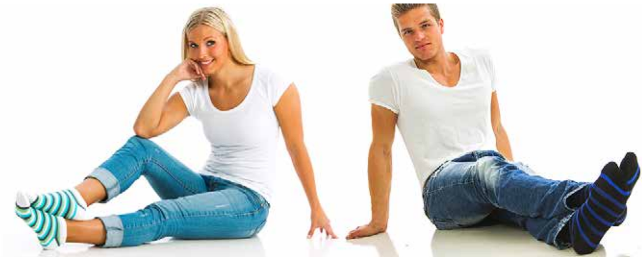
Kuva 2. Sukkamestarien vapaa-ajan sukkiä

Sukkamestareiden oma mallisto pitää sisällään niin urheiluetta vapaa-ajansukkia (kuva 2).