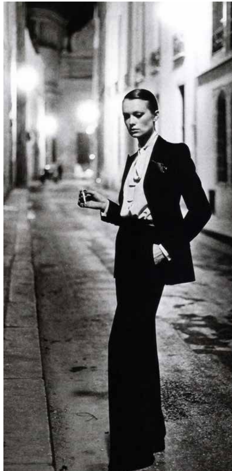
Kuva 10. Le Smoking

‘Le Smoking’ oli niin moderni, että sitä paheksuttiin ja se oli kielletty useimmissa ravintoloissa. Naisen ei ollut hyväksyttävää pitää housuja julkisesti. (Whowhatwear, 2015.)