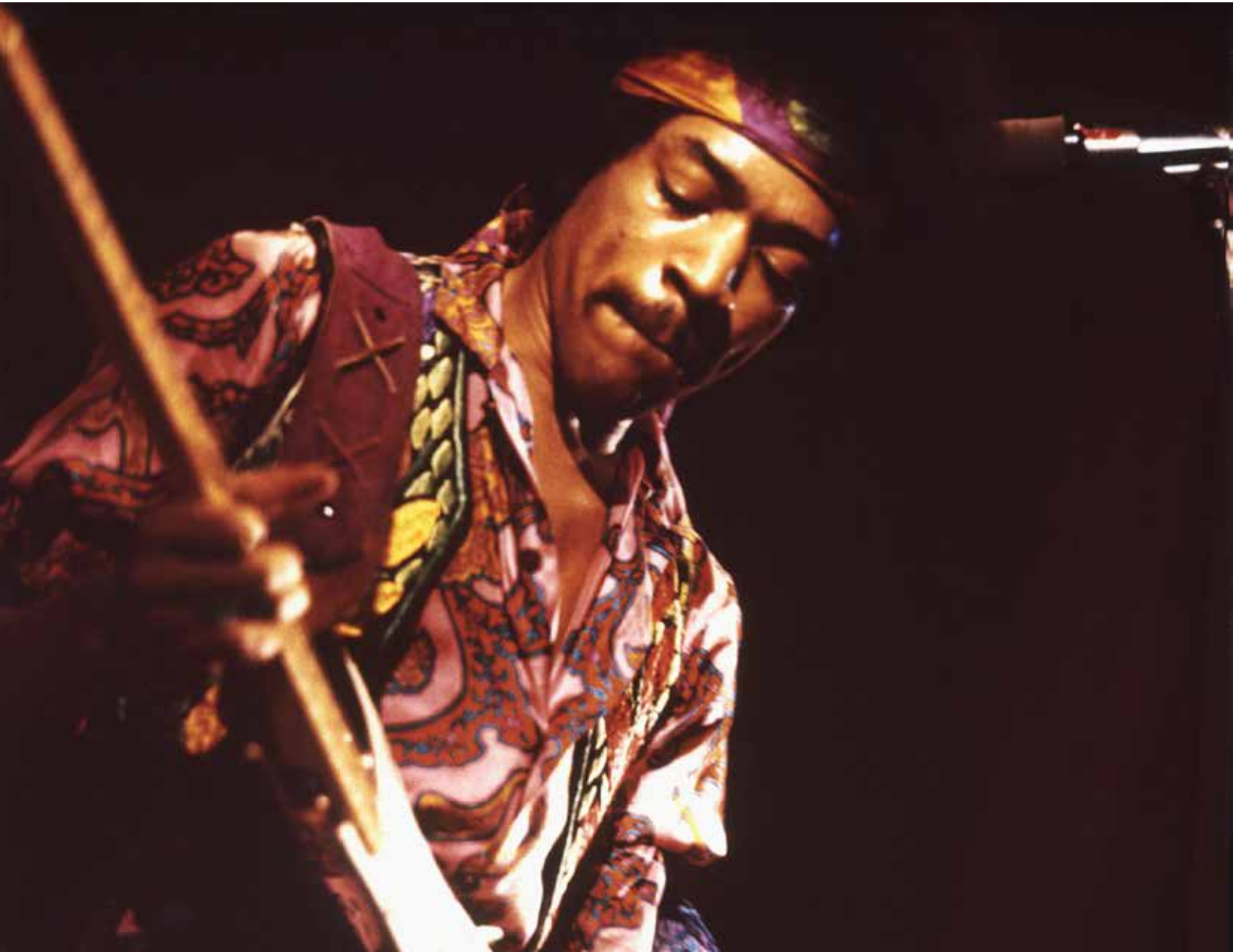
Kuva 11. Jimi Hendrix

Tyyli vapautti miehet hetkeksi vakavasta ja hillitystä pukeutumisesta. Ensimmäistä kertaa modernin pukeutumisen historiassa mies saattoi olla seksikäs, romanttinen ja feminiininen. Tyyliin kuuluivat pitkät hiukset, hoikat vartalot ja yltäkylläinen pukeutuminen värikkäisiin ja kuvioituihin vaatteisiin, koruihin ja huiveihin. Jimi Hendrix omaksui tyylin monen muun muusikon tavoin (kuva 11).