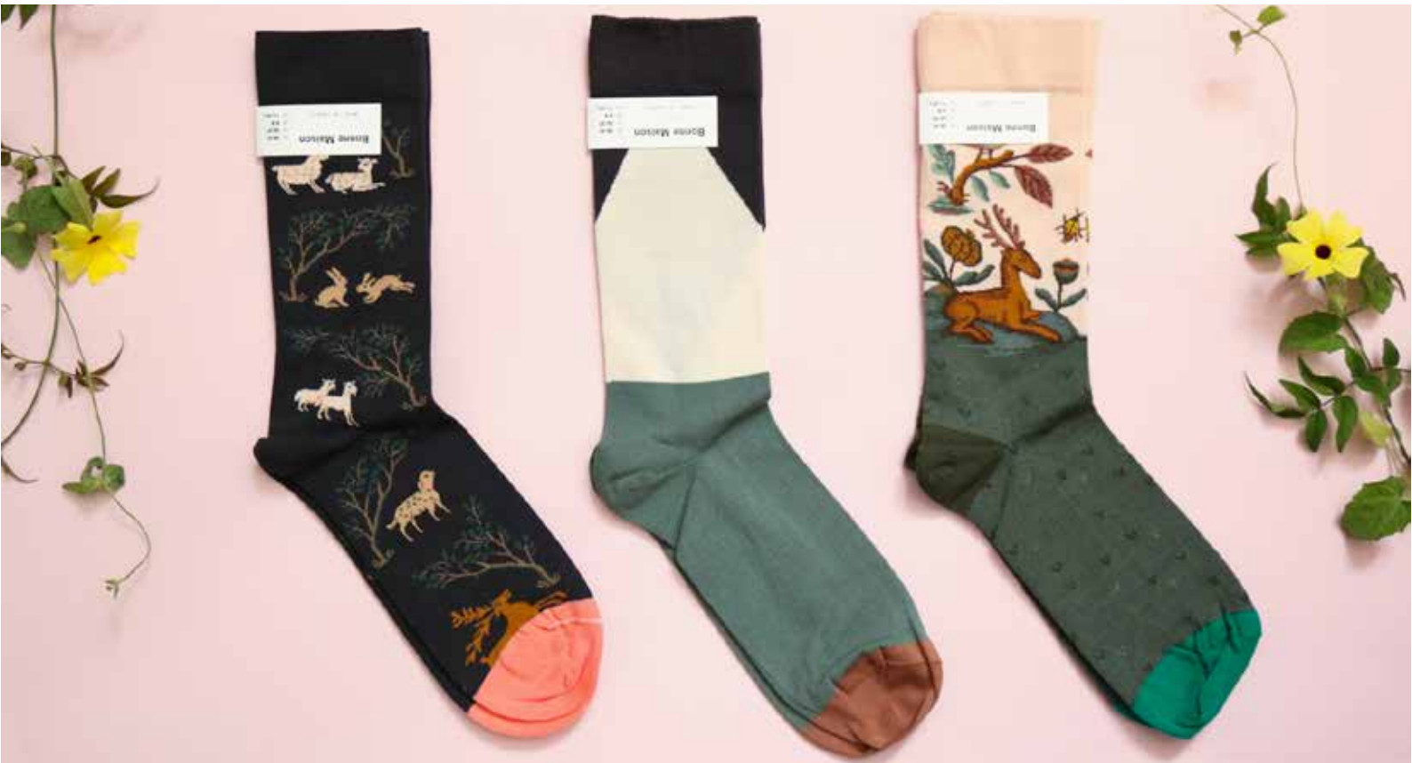
Kuva 13. Bonne Maison -merkin sukkia

Neulesuunnittelussa suunnittelutyö tehdään tietokoneohjelmaa, esimerkiksi Photoshopia apunakäyttäen. Pikselit kuvaavat neuleen silmukoita ja yksi pikseli vastaa yhtä silmukkaa valmiissa neuleessa. Silmukoita on rajallinen määrä ja se määräytyy varren leveyden mukaan.