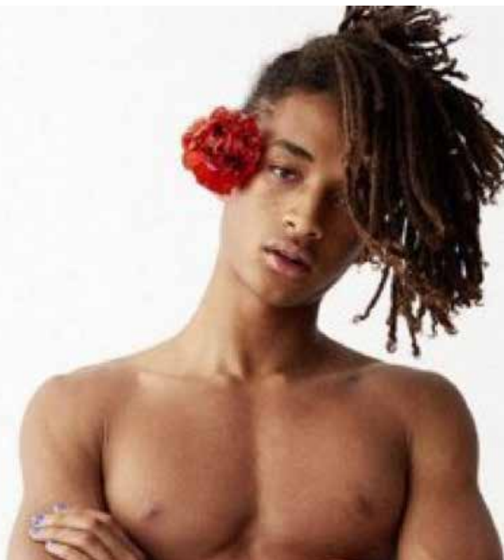
Kuva 1. Androgyni muoti-ikoni Jayden Smith

Sukupuoli, pukeutuminen ja unisex-muoti ovat olleet aiheina muutamissa opinnäytteissä, joissa myös sivutaan androgyniaa. Opinnäytteeni avaa laajemmin androgynian käsitettä ja tuo siten uuden katsantokannan aiheeseen.