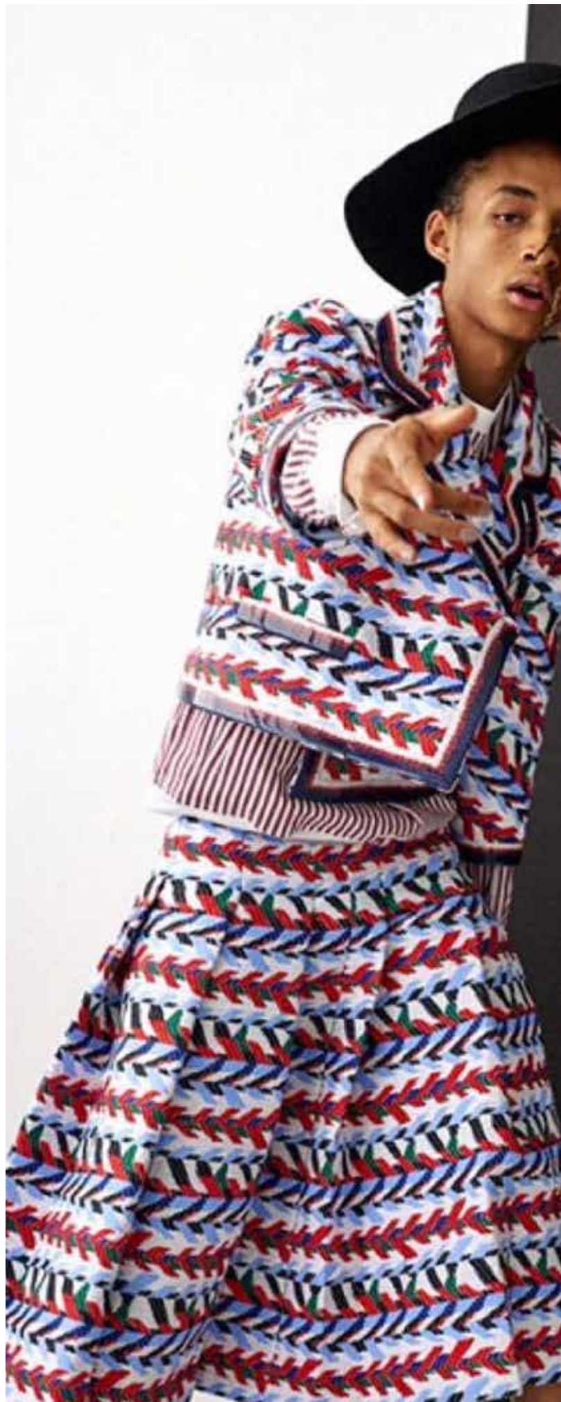
Kuva 3. Sukupuolirajoja rikkova Jayden Smith

Mieheyden ja naiseuden merkit ovat jatkuvassa muutoksessa. Nuori muoti-ikoni Jayden Smith (kuva 3) pyrkii rikkoamaan rajoja sukupuolten välillä.