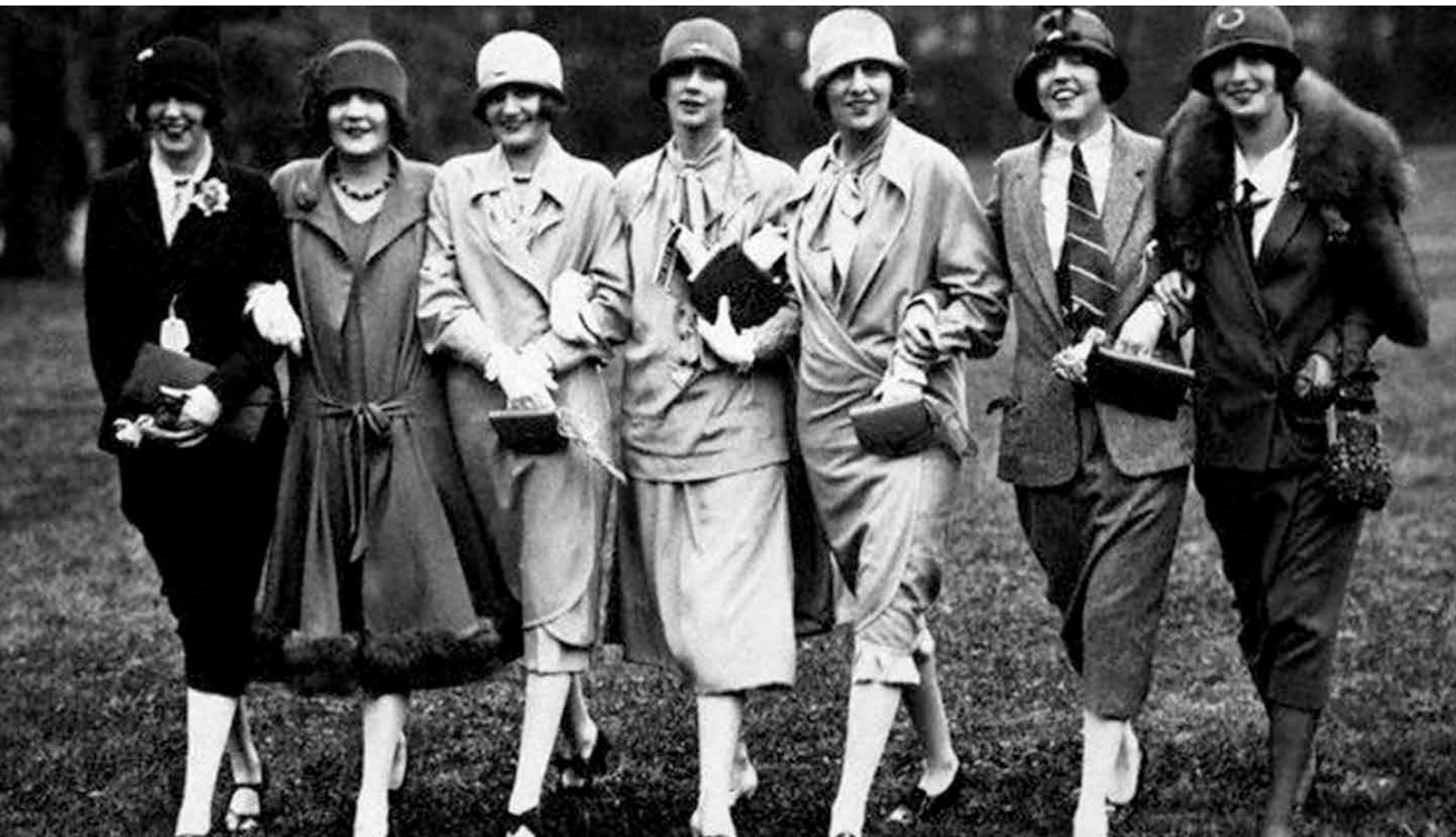
Kuva 9. Chaneliin pukeutuneita naisia

”Rhonda Garelickin mukaan suunnittelija uskoi, että naisilla oli mahdollisuus muuttaa elämänsä suuntaa vaattein. Chanelin päämääränä oli rohkaista naisia elämään kuten hän itse - fyysisesti esteetöntä, atleettista ja seksuaalisesti vapaata elämää.” (Vänskä 2006, 114.)