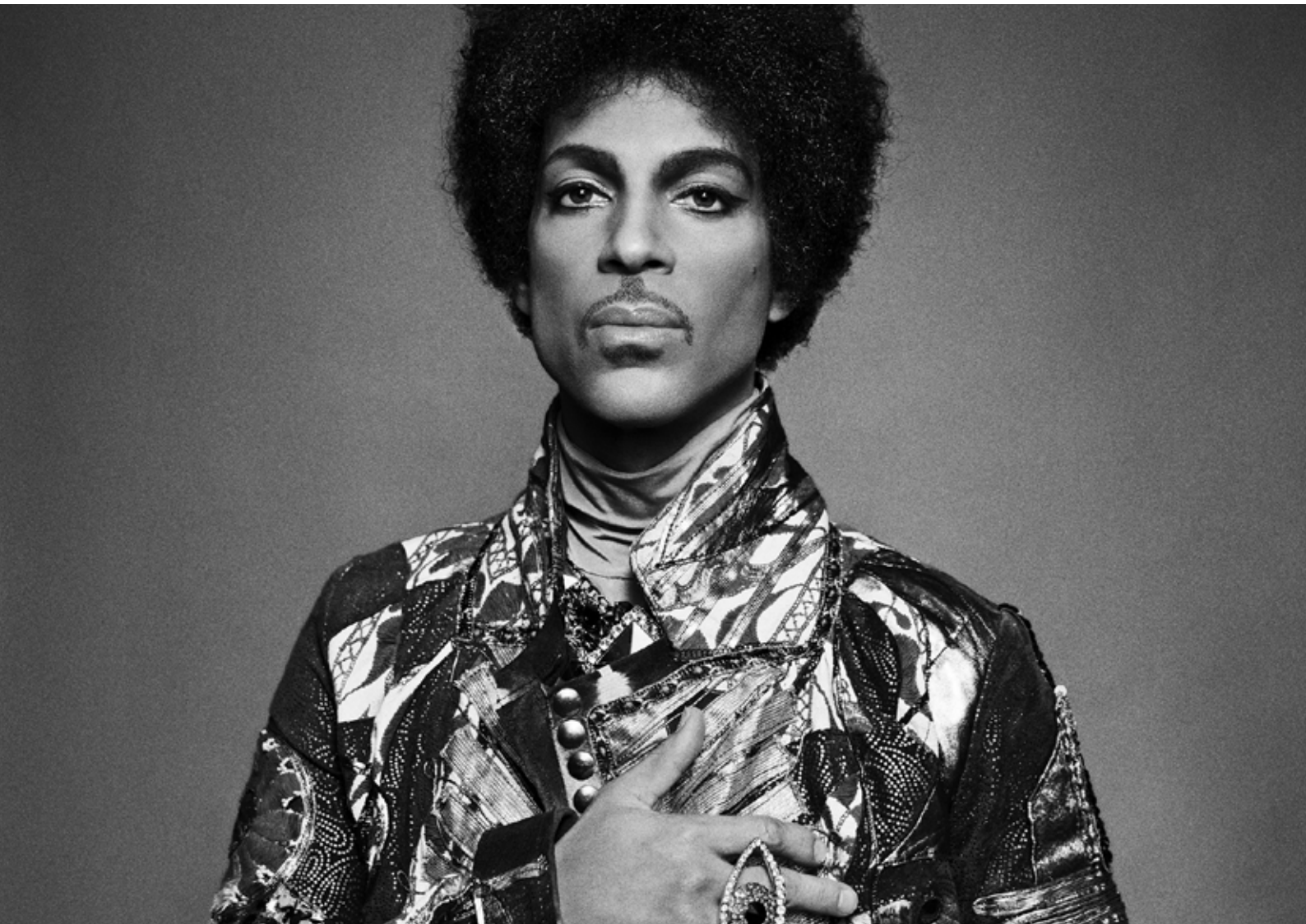
Kuva 12. Prince

80 -ja 90-luvuilla sukupuolinormeja rikottiin kumpaankin suuntaan. Naiset yrittivät tulla otetuiksi tosissaan työelämässä ja voimaantuivat naisten business puvusta, niin kutsutusta power suitista, suurine olkatoppauksineen. Punk ja grunge musiikkityylien edustajat ottivat kantaa sivuuttamalla biologisen sukupuolensa ja asettamalla edustamansa tyylin pukeutumisen pohjaksi. Nirvanan solisti Kurt Cobain esiintyi kukkamekoissa ja kuvasi itseään feministiksi. Popmuusikot, kuten Michael Jackson, Prince (kuva 12), Grace Jones, Annie Lennox ja Madonna, shokeerasivat sekoittamalla sekä feminiinisiä että maskuliinisia piirteitä omassa olemuksessaan. (Bustle, 2016.) Oman minän vastakkaisen sukupuolen piirteiden tunnistaminen tuntui olevan ajan pop-ikoneille tärkeää.