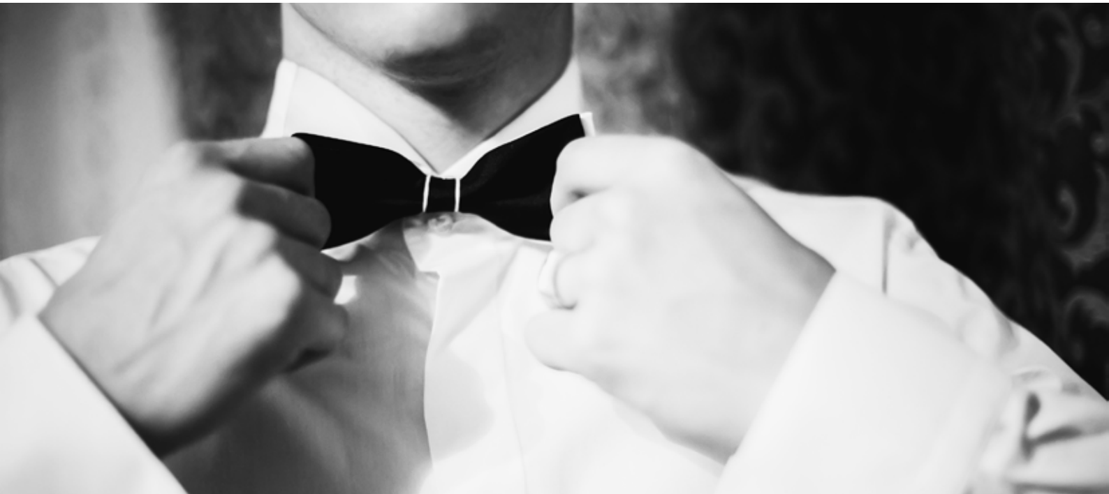
Kuva 5. Miehen juhlapuku

Naisten vaatetuskaudet ovat usein rakenteeltaan moni-mutkaisempia sekä kuvioiltaan organisempia ja romantti-sempia heijastellen feminiinisiä piirteitä. Erilaiset kirjonnat ja pitsiapplikaatiot ovat tunnusomaisia naisten asujen yksityis-kohtia. Pastelliset sävyt mielletään myös helposti feminiini-siksi (Kaiser 2012, 129).