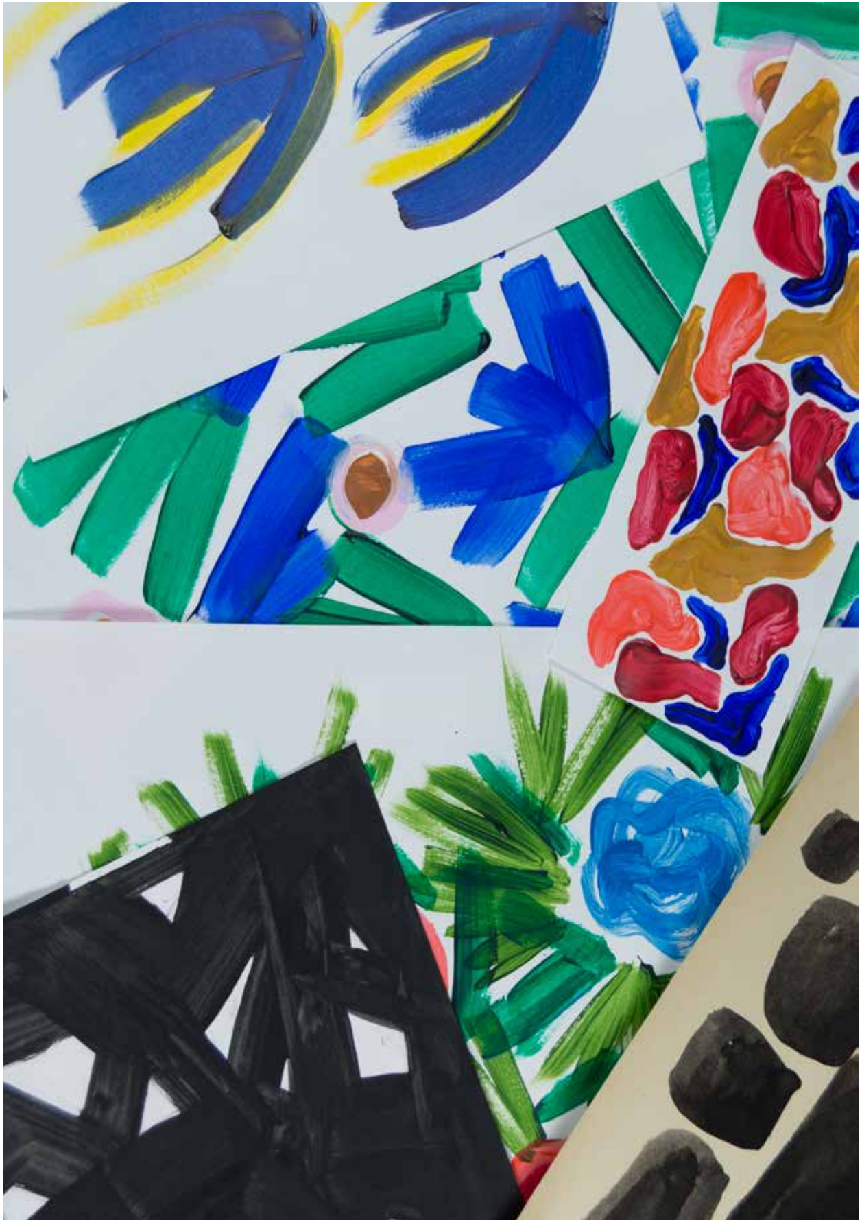
Kuva 16. (viittaus s. 20) Luonnoksia