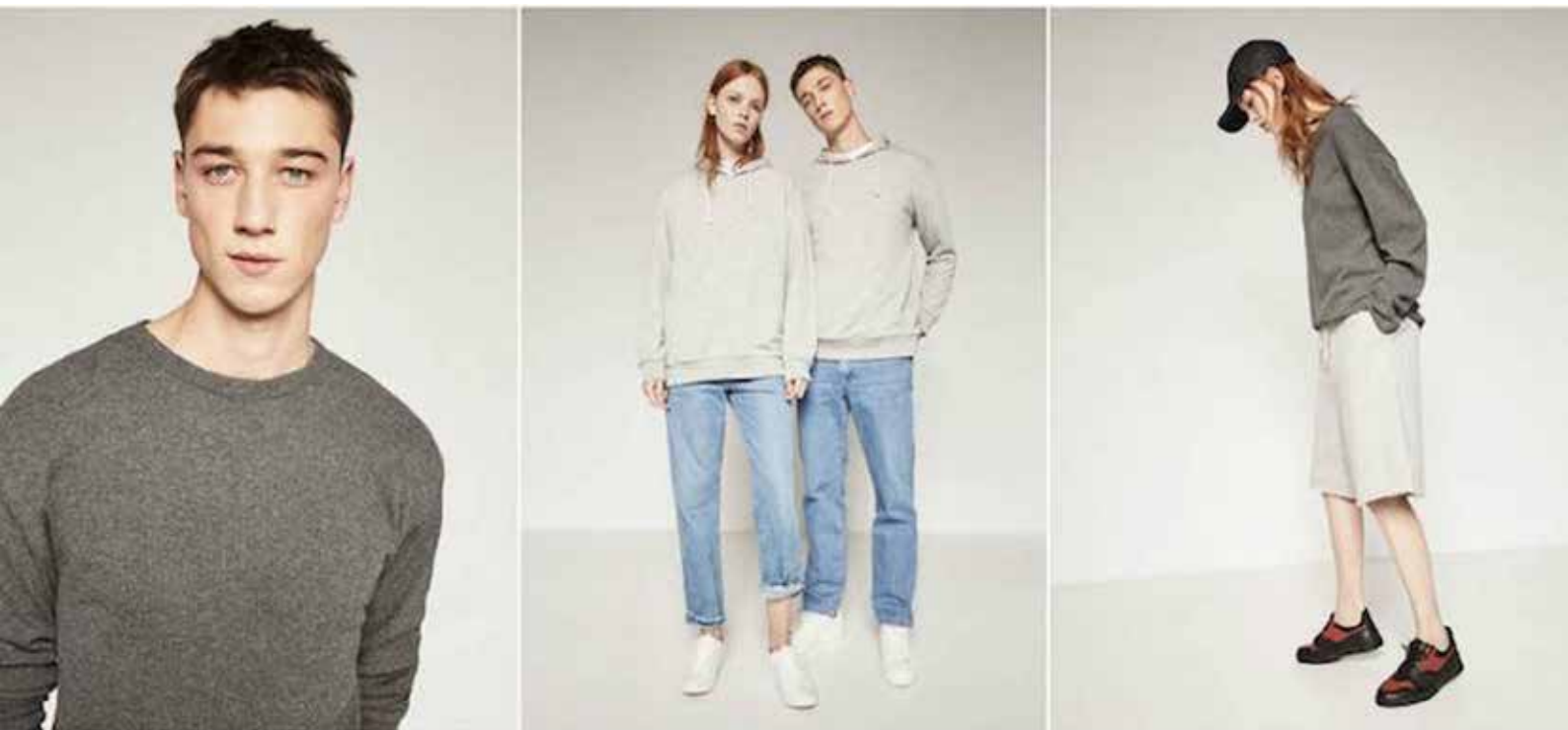
kuva 6. Vaatemerkki Zaran unisex-mallisto

Tutkiessani unisex-käsitettä ja unisex-vaatemerkkejä törmäsin vaihtoehtoiseen ajatukseen, androgyniaan, jossa sukupuolisidonnaisten merkkien välttelyn sijasta niitä yhdistellään ja siten luodaan niin miehille kuin naisillekin suunnattuja vaatteita, joissa säilyy värien ja symbolien rikkaus. Androgyynin muodin seurauksena värit ja symbolit lopulta menettävät sukupuolisidonnaisen latauksen ja vapautuvat yleisiksi persoonallisuuden ilmentämisen keinoiksi pukeutumisessa.