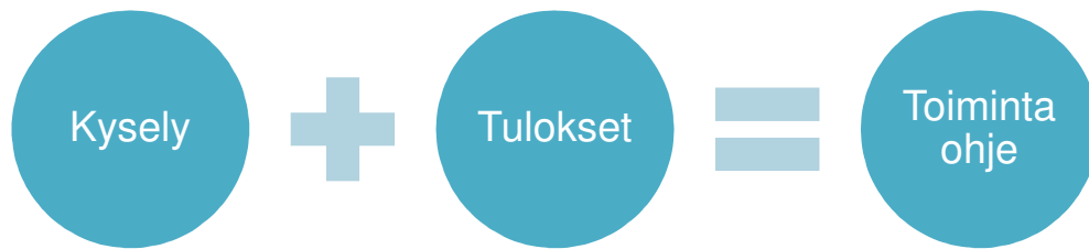
Kuvio 4. Toimintaohjeen muodostumisen prosessi.