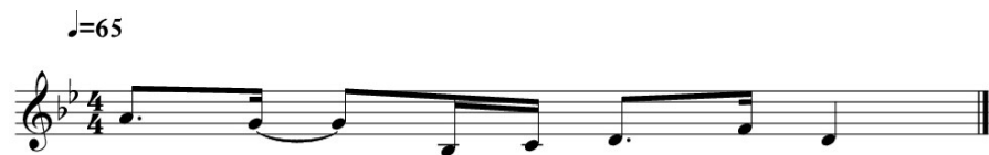
Kuva 17. Kappaleen Sonnet pianointron ja -outron melodiaidea.

Tästä sävellyksestä oli tarkoitus tehdä balladi AABA-rakenteeseen. Rytmikaltaan kappaleesta ei tullut puhdasta balladia johtuen B-osan kuudestoistaosa bassolinjasta, joka soitetään bassolla ja pianolla. Halusin luoda yhteneväisen idean, joka alkaa pianointrolla ja loppuu samankaltaiseen piano-outroon. Introon ja outroon sävelsin lyhyen ja yksinkertaisen melodian, joka tulisi kuulijalle tutuksi. Ajatuksena oli luoda tarinankerrontaa kappaleeseen tällä melodialla.