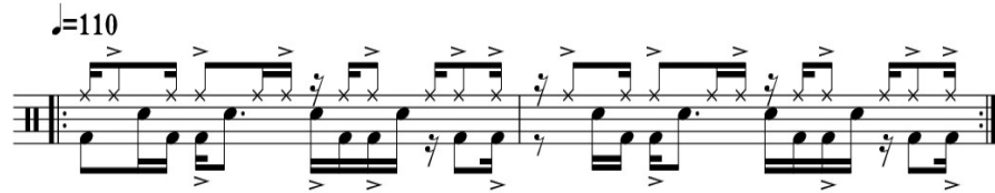
Kuva 9. Kappaleen Two Shapes rumpukomppi B-osassa

Two Shapes kappaleeseen suunnittelin myös tietynlaista rytmikkaa B- ja C-osaan. B-osaan halusin rakentaa kuudestoistaosia synkopoivan kompini, koska pianon on kuudestoistaosia synkopoiva A-osassa (kuva 4.) Rumpukompin aksentit ovat vahvasti toisella ja neljännellä kuudestoistaosauskalla: