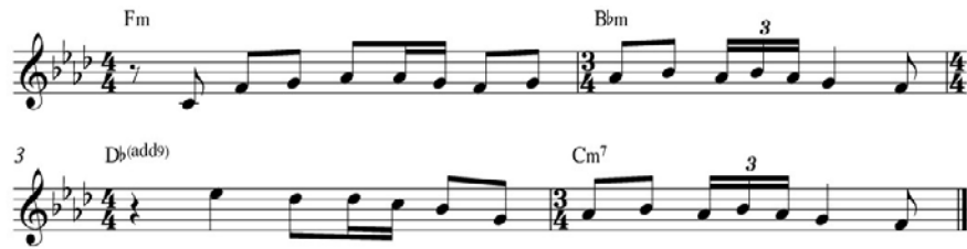
Kuva 26. Kappaleen The Greenland A-osan neljä ensimmäistä tahtia.

The Greenland on harmonialtaan yksinkertaisin muihin sävellyksiin verrattuna. Kappaleessa on samantyyppisiä elementtejä, mitä löytyy kelttiläisestä musiikista ja muusta kansanmusiikista. Tämä johtuu kappaleen poljennosta ja diatonisesta melodiakulusta, sekä sen fraseeraustyylistä: