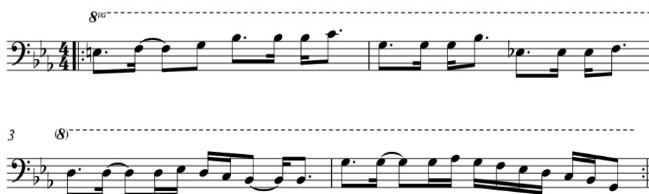
Kuva 1. Two Shapes -kappaleen bassomelodia C-osassa.

Piano ja sähköbasso olivat tärkeimmät työkalut sävellystyötä aloittaessa. Käytin sähköbassoa säveltäessä apuna, koska pidin soittimen soinnista yksiviivaisen oktaavin alueella. Minulla oli visiona tehdä kappaleita, joissa käyttäisin bassoa myös melodiasoitteina. Mm. kappaleissa Three Stories ja Two Shapes voidaan kuulla sähköbassolla soitettuja melodioita.