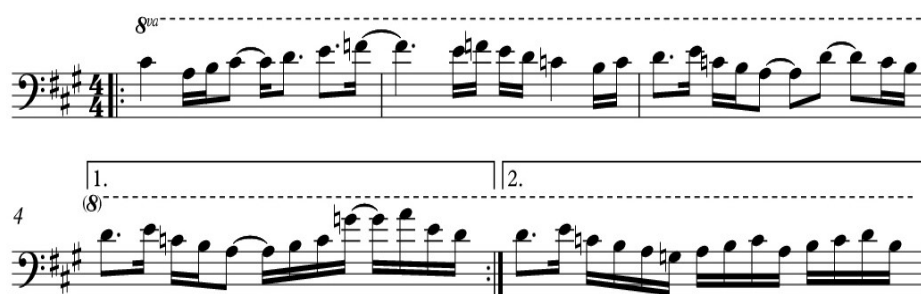
Kuva 2. Three Stories -kappaleen bassomelodia B-osassa.