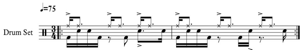
Kuva 3. Nuottikuva Poema-kappaleen rumpukompista.

Usein sävellyksiä tehdessä on vaarana luoda niistä liian saman kuuloisia. Varsinkin kun tuottaa monta kappaletta lyhyessä ajassa. Halusin luoda musiikkia erilaisissa tempoissa ja tahtilajeissa, jotta saisin sävellyksiin vaihtelua. Olin myös miettinyt rumpukomppeja, jotta saisin haluamani rytmiiän kappaleisiin. Poema-kappaletta tehdessä minulla oli tietynlainen \frac{3}{4} -osa tahtilajissa oleva rytmiiän mielessä, jossa kuudestoista-osat ovat synkopoituja ja aksentti on vahvasti tahdin kolmannella neljäsosalla. Loin tätä pohjaa käyttäen rumpukompin, jossa symbaalia soitetaan neljäsosille ja virveli tulee joka toisessa tahdissa viimeiselle neljäsosanuotille ja joka toisessa tahdissa toisen neljäsosan viimeiselle kuudestoistaosanuotille: