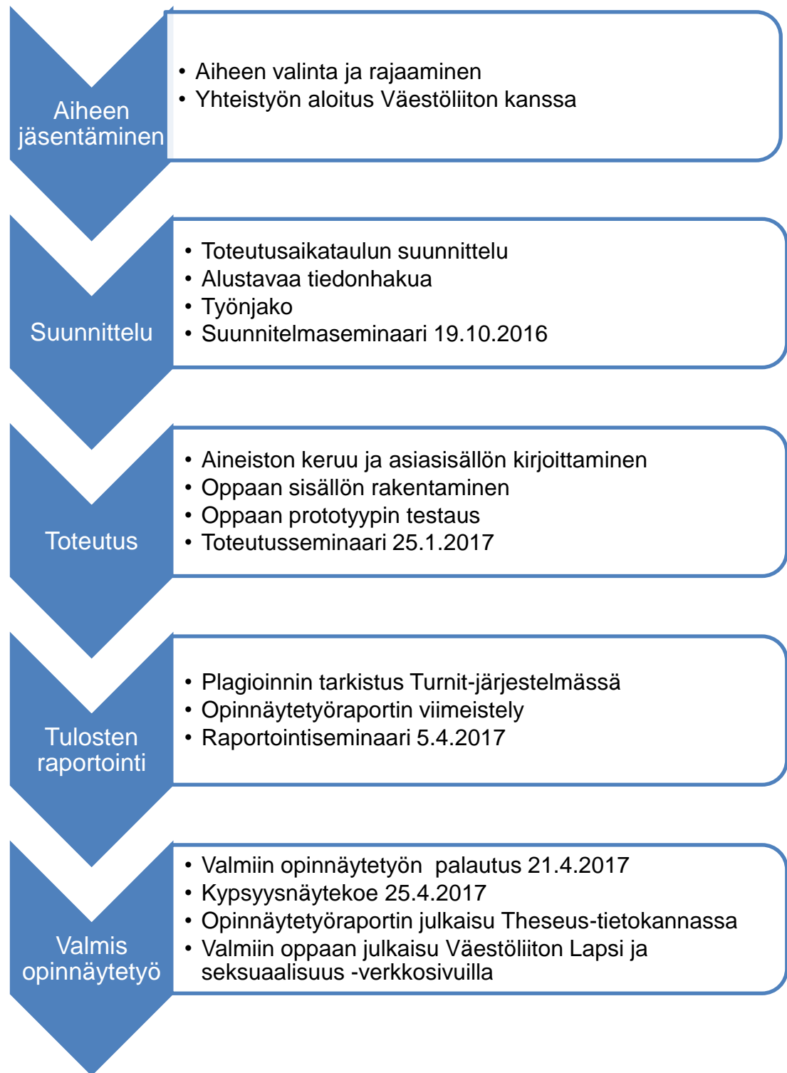
Kuvio 1. Työn toteutusaikataulu